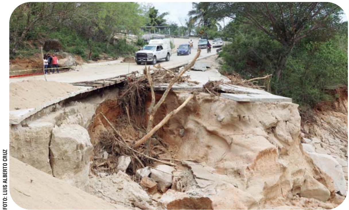
► Carreteras de la región de la Costa, destrozadas tras el impacto del huracán Agatha.