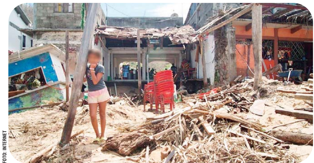
► Agatha impactó en el municipio de San Pedro Pochutla, arrasando con viviendas y caminos rurales.