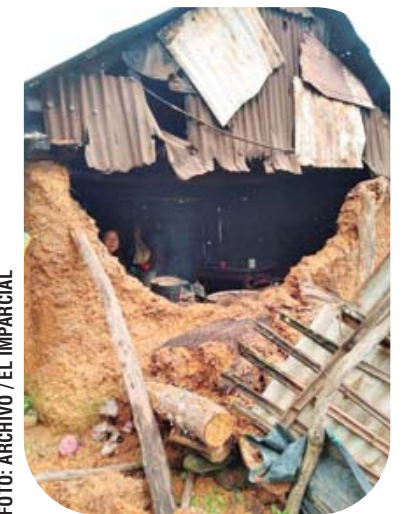
► En la Sierra Sur, Agatha arrasó con humildes viviendas.

Existen municipios que no fueron dañados severamente por el huracán Agatha y que sí fueron tomados en cuenta para recibir recursos federales, entre ellos Miahuatlán de Porfirio Díaz y Santa Catarina Juquila; el último de ellos tuvo que repartir el dinero entre sus comunidades para evitarse protestas sociales.