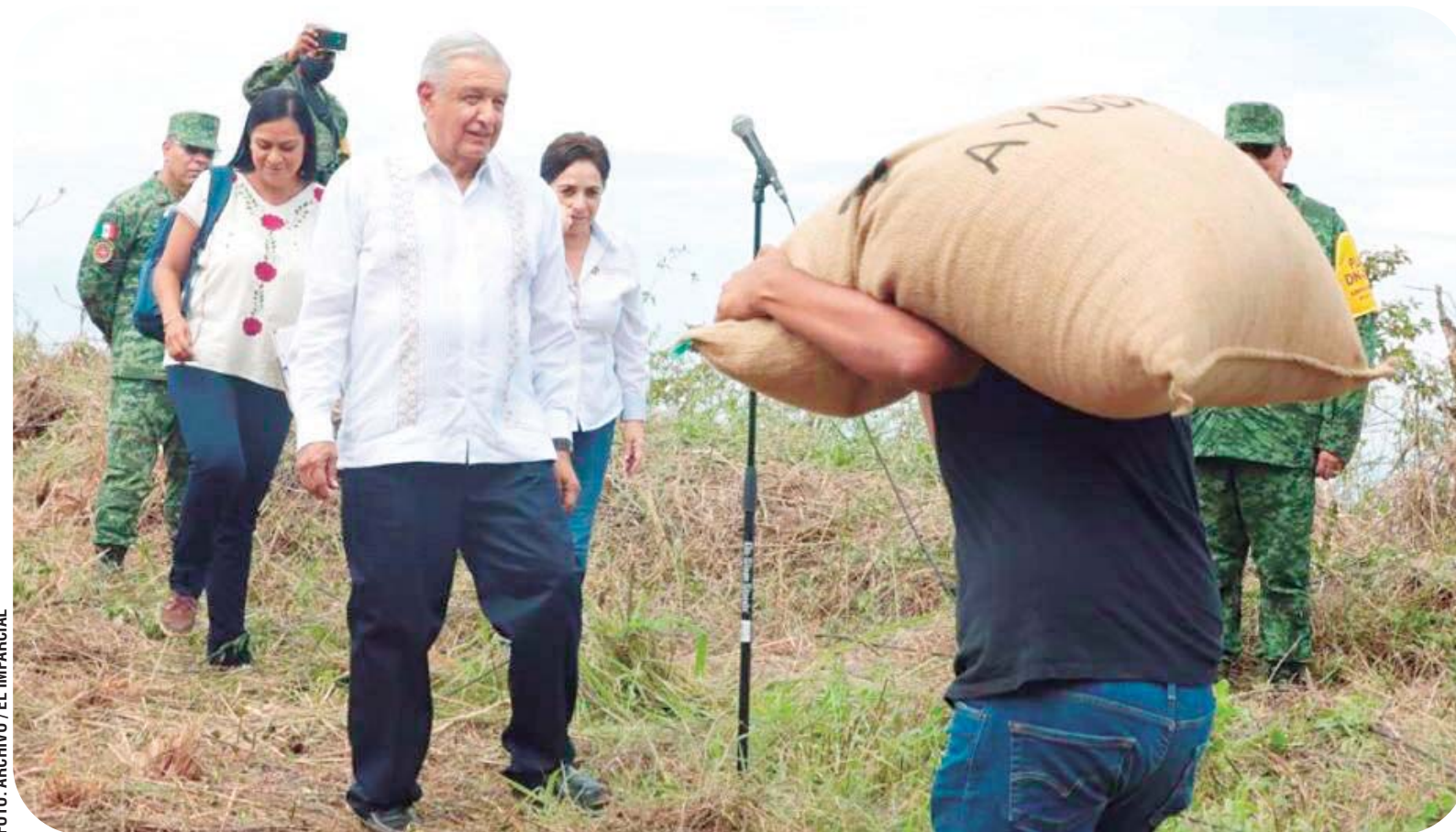
► El presidente Andrés Manuel López Obrador supervisó la entrega de apoyos a damnificados.

de los dineros federales para los daños ocasionados por el fenómeno hidrometeorológico.