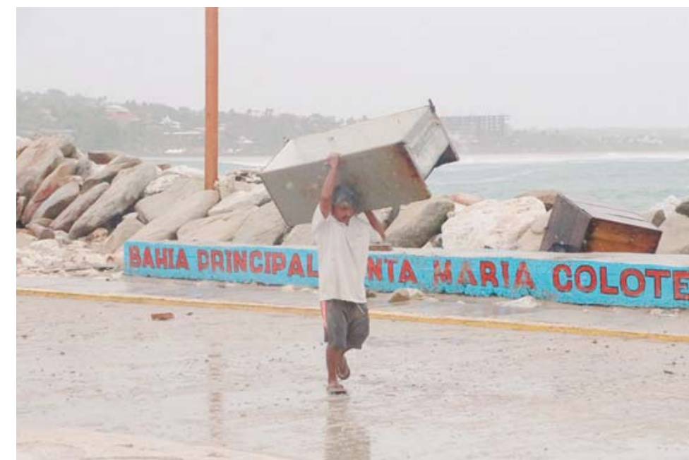
► El huracán Agatha impactó en categoría 2 en la región de la Costa.

Con más de siete horas de vientos fuertes y torrenciales aguaceros, tres de ellas con más intensidad,