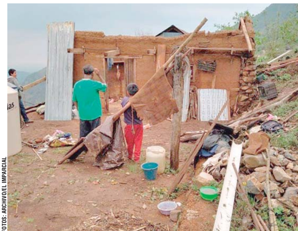
► Lo que se llevó Agatha en la Sierra Sur.

El secretario de Marina, José Rafael Ojeda Durán, indicó durante la visita del presidente Andrés Manuel López Obrador a Bahías de Huatulco para evaluar los daños, que con el Plan Marina atendieron los municipios de Santa María Colotepec, Santo Domini-