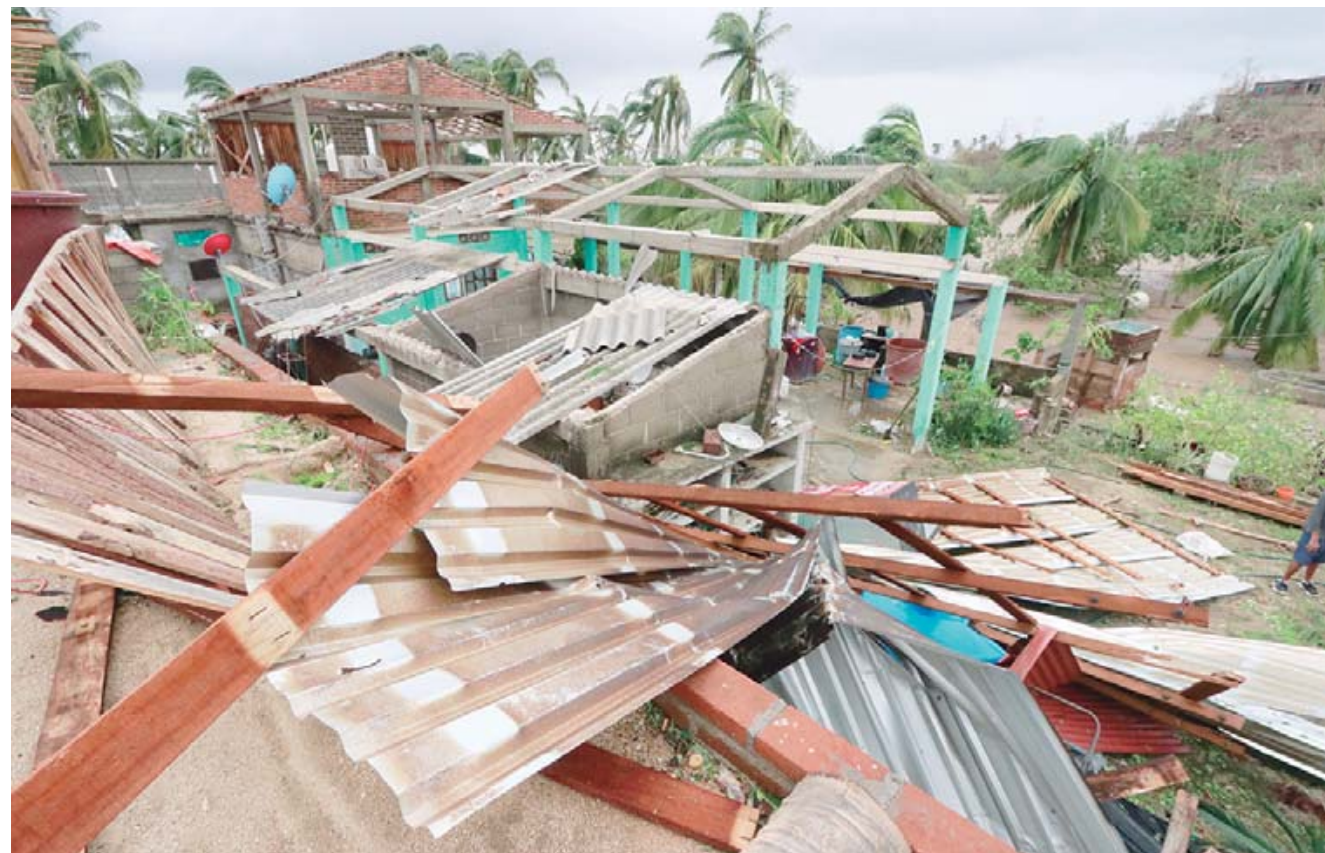
► Miles de damnificados quedaron fuera de los apoyos.

desaparecidas, comunidades incomunicadas, carreteras, caminos, viviendas y cultivos destruidos; así como miles de personas damnificadas en más de 30 municipios.