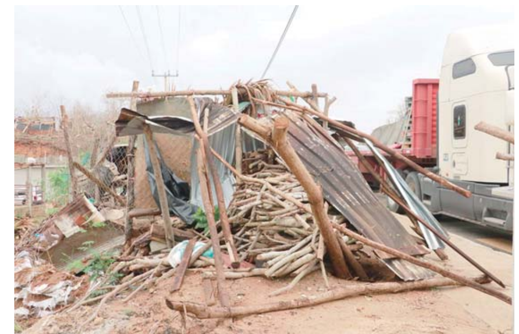
► Arrasa con humildes viviendas en la Costa.

Muchas familias que fueron afectadas y que sus domicilios se encontraban aislados, a las afueras de las comunidades no fueron tomadas en cuenta; personal de Bienestar que realizó el Censo, la