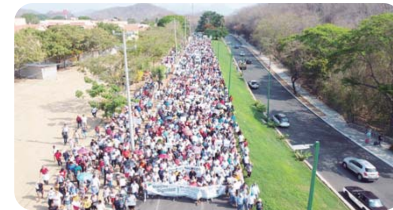
► Los afectados marcharon por el boulevard Chahué.