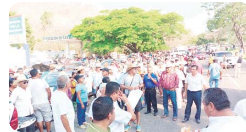
► El manifiesto no fue recibido por el responsable del CIP de FONATUR.

horas del lunes inició la megamarcha del boulevard Chahué, hasta las oficinas del FONATUR.