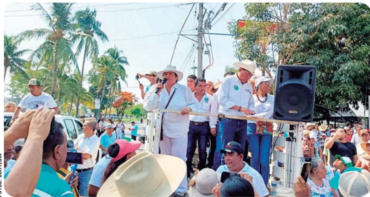
► Los comuneros exigen la devolución de tierras que no fueron utilizadas desde la expropiación de 1984.