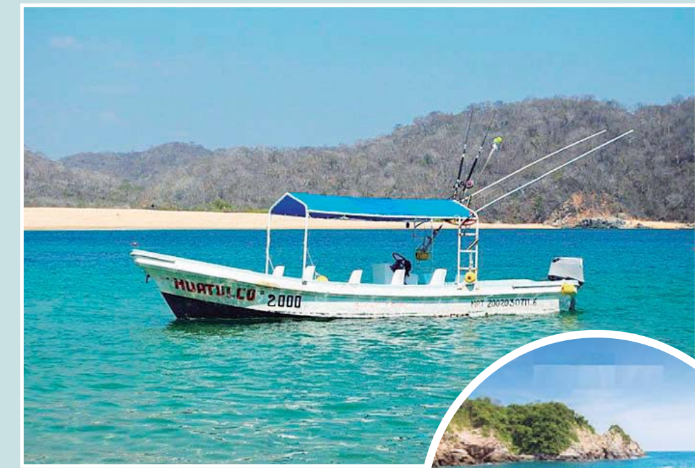
► La zona es hermosa.

Trascendió que para el próximo 5 de junio, Día Mundial del Medio Ambiente, la titular de SEMARNAT, María Luisa Albores González, visitará Bahías de Huatulco en donde se dará a conocer mayor información sobre el uso del predio.