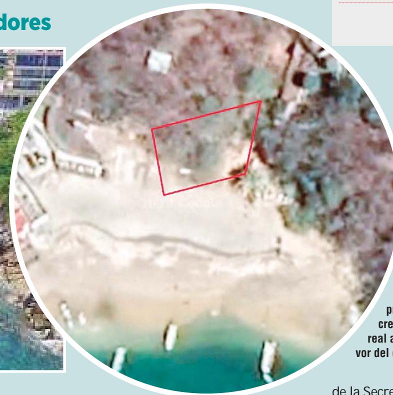
► La destinación del predio no transmite la propiedad ni crea derecho real alguno a favor del destinatario.

de la Secretaría de Medio Ambiente y Recursos Naturales, o dejara de utilizarla o necesitarla, dicho bien con todas sus mejoras y acciones se retirará de su servicio para ser administrado por dependencia