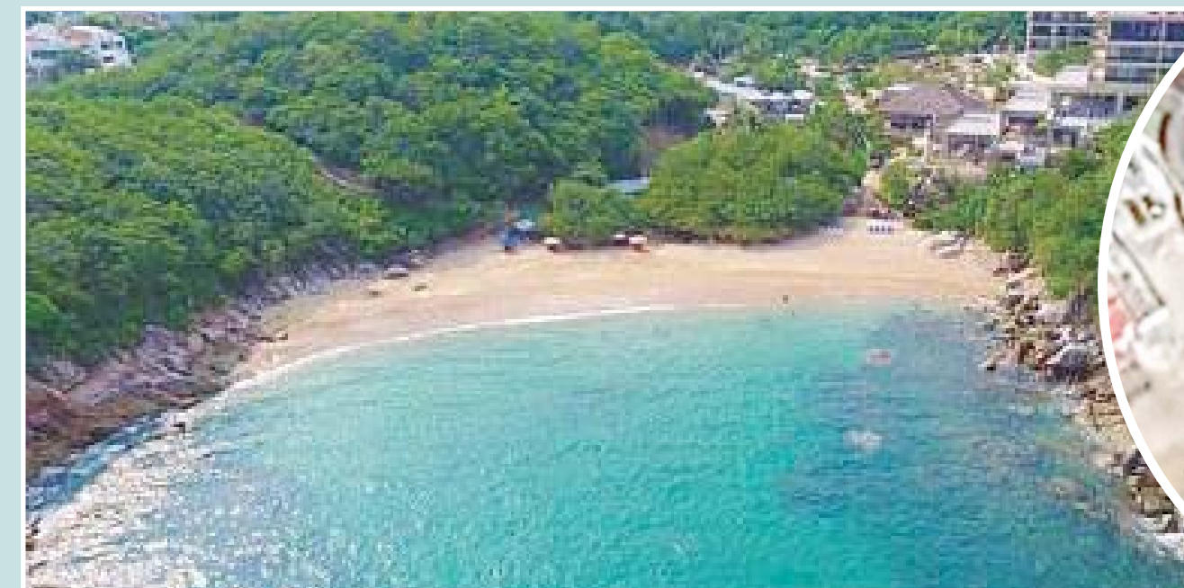
► El terreno en cuestión se ubica en las inmediaciones de la playa Pescadores.

Cinco años después, el 3 de mayo de 2023, la Secretaría de Medio Ambiente y Recursos Naturales que encabeza María Luisa Albores González, destinó el predio en cuestión, decreto que fue publicado en el Diario Oficial de la Federación el pasado lunes 23 de mayo y entró en vigor el pasado miércoles 24 del mismo mes.