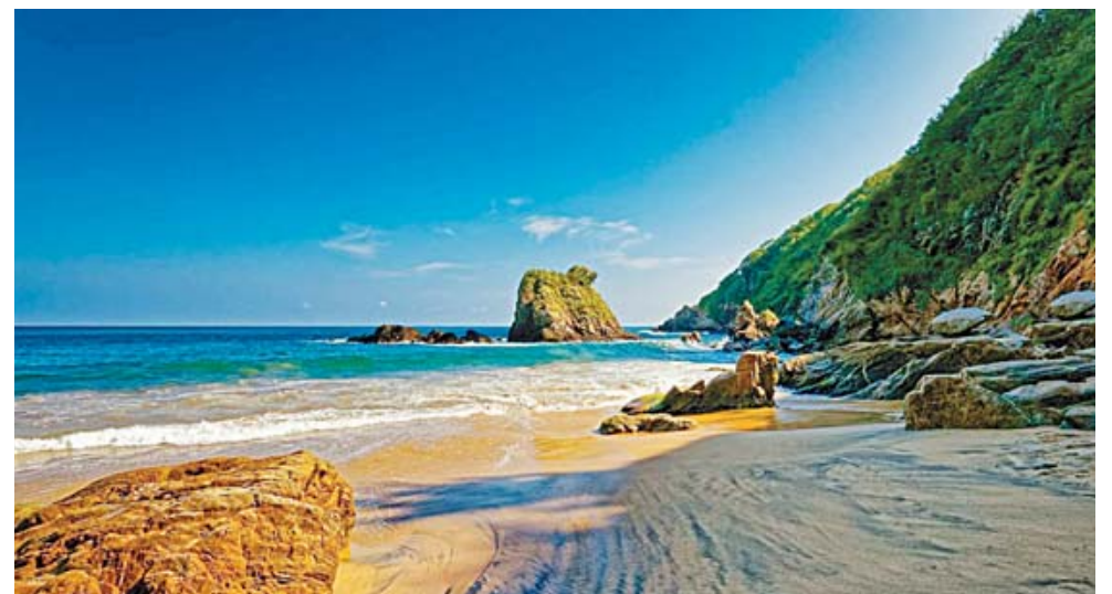
► Playa de Mazunte.

tas para realizar diferentes actividades, especialmente para practicar surf.