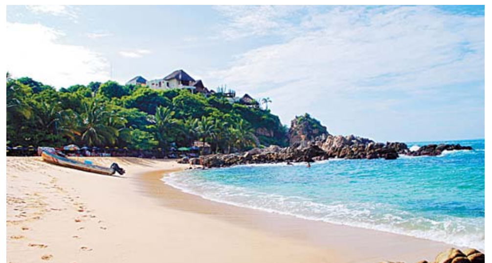
► Puerto Escondido.