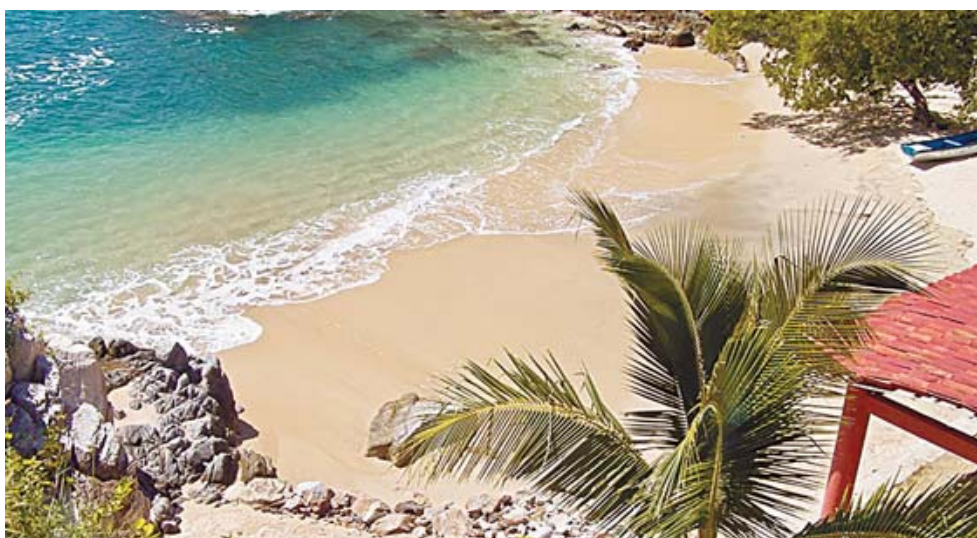
► Playa Estacahuite.

conocer más de la especie; lo mejor de todo es que no encontrarás grandes cadenas hoteleras alrededor.