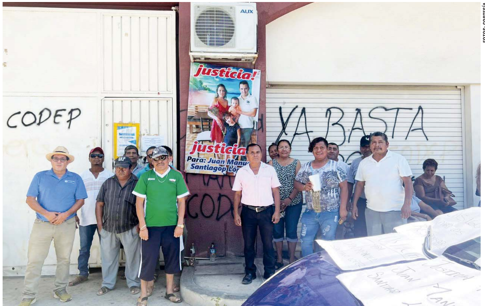
► Los manifestantes exigen justicia para que el crimen no quede impune.

mantuvieron su protesta, recordaron que en octubre de 2020, luego de que los imputados fueron detenidos, realizaron una protesta igual en