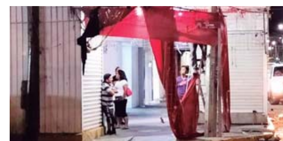
• Toman la subestación de bombeo del sistema de ductos ubicada en Donají.

SALINA CRUZ SE HA VUELTO REHÉN DE LOS CASETEROS