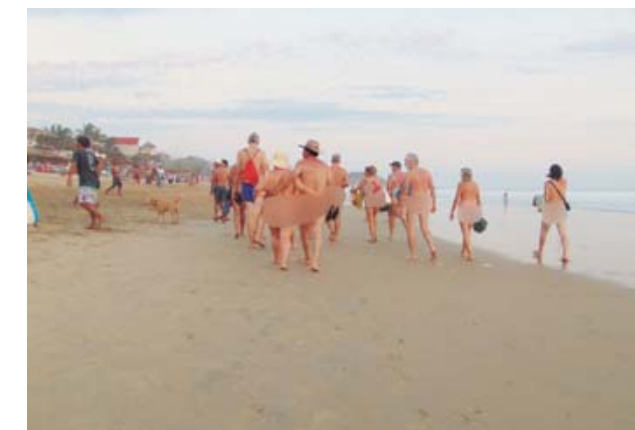
► Caminata nudista.