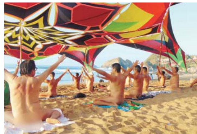
► Yoga en pabellón.