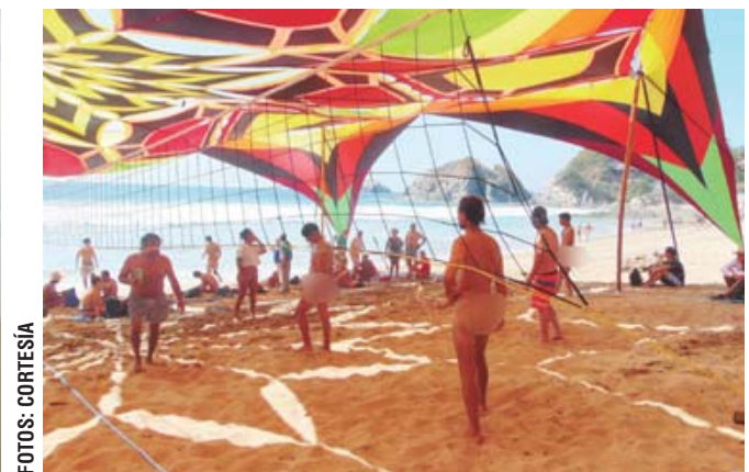
► Vólibol playero.

ra edición y un año anterior, al celebrarse el Sexto Encuentro Nudista Latinoamericano, "es generar trabajo y ganancias para prestadores de servicios, más allá de las dos temporadas importantes para el destino que son Semana Santa e invierno, lo que se