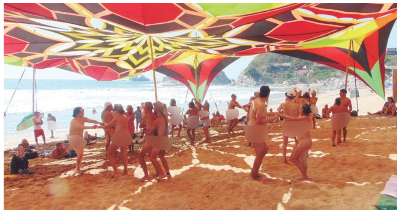
► El evento nudista inició el pasado 2 de febrero y culminará mañana domingo.

del Festival Nudista Zipolite 2023 en su octava edición. De acuerdo con organizadores, el evento nudista que se realiza en "La Playa Nudista de México", "es el más grande a nivel mundial", ya que llegan gustadores del nudismo y naturismo desde diversas regiones del país y de otros países. La importancia del evento es a tal grado que la ocupación hotelera se ve reflejada al 100 por ciento