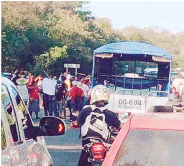
► Los manifestantes exigen atención gubernamental.