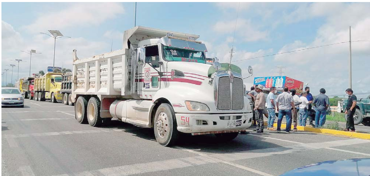
► Las pesadas unidades transportan rocas para la construcción de la obra federal del rompeolas.