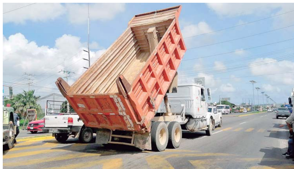
► En los últimos meses se han registrado varios accidentes.