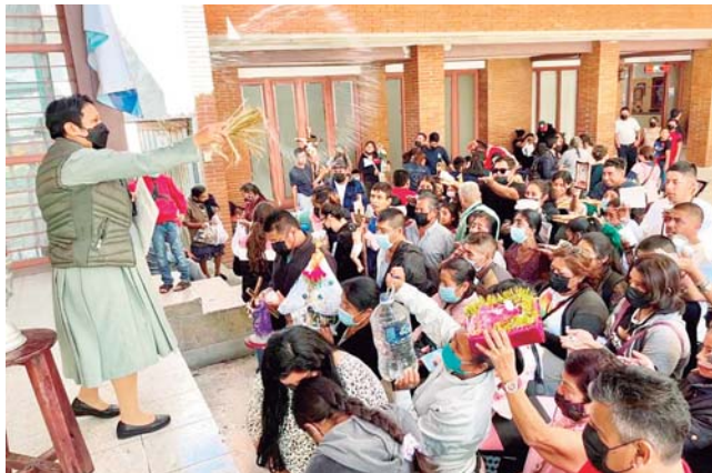
► Miles de feligreses arriban desde muy lejos.