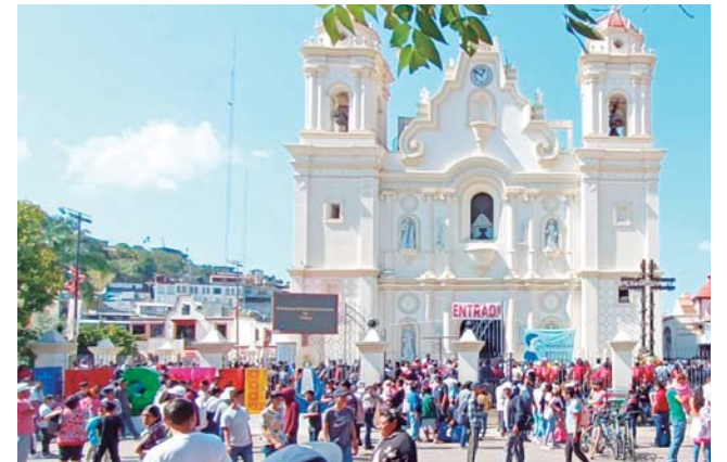
► Su devoción por imagen es grande.

Al año, llegan al santuario más de un millón de feligreses que llevan ofrendas y oraciones