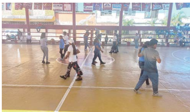
► Los encuentros se jugaron en la cancha municipal.