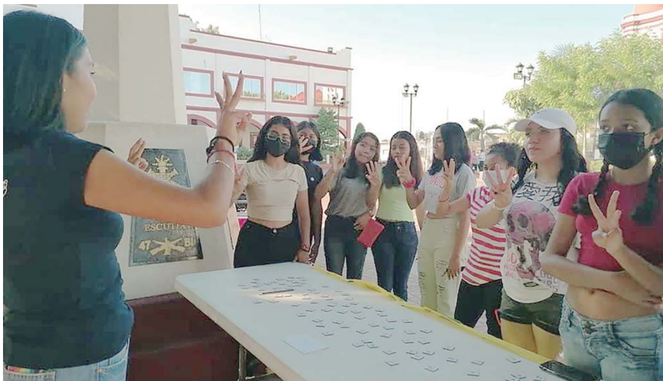
► Este proyecto se llevó a cabo por las Unidades de Servicio de Apoyo a la Educación Regular 04 y 97.

Los encuentros que se jugaron en la cancha municipal se dieron entre la universidad REU, el Instituto Tecnológico