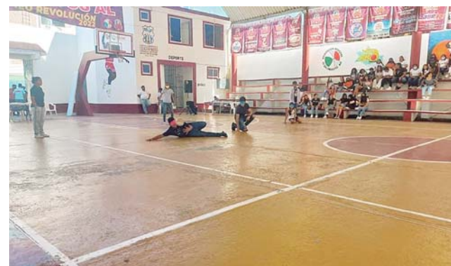
► Participaron jóvenes estudiantes y autoridades.

de Pinotepa, el Colegio de Bachilleres de Oaxaca, la USAER, el Ayuntamiento de Pinotepa Nacional y el DIF municipal. El objetivo del juego fue