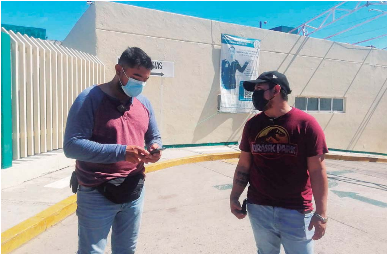
Padres de familia se manifestaron frente al nosocomio.