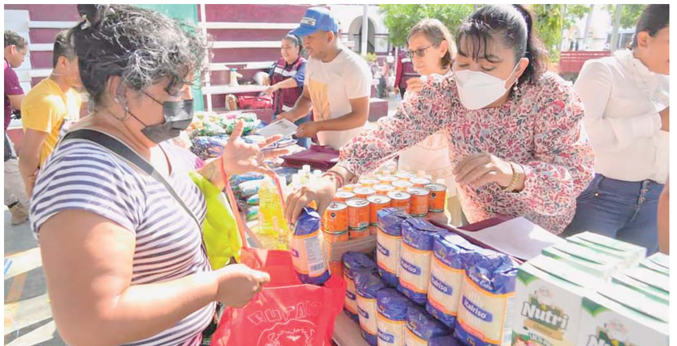
► Cientos de personas hicieron fila para intercambiar sus residuos sólidos.