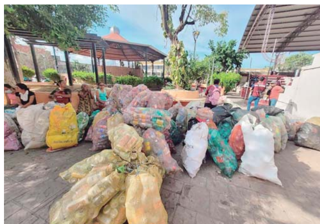
► La finalidad es recuperar la mayor cantidad de plástico.