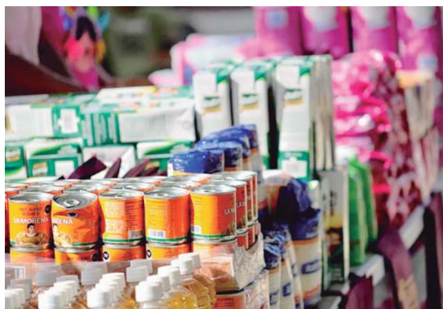
► Productos como chiles, azúcar, aceite, entre otros.

también aplican un sistema de bienestar familiar", detalló.