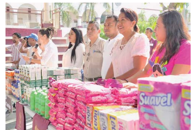
► El programa ha tenido éxito en educación ambiental.