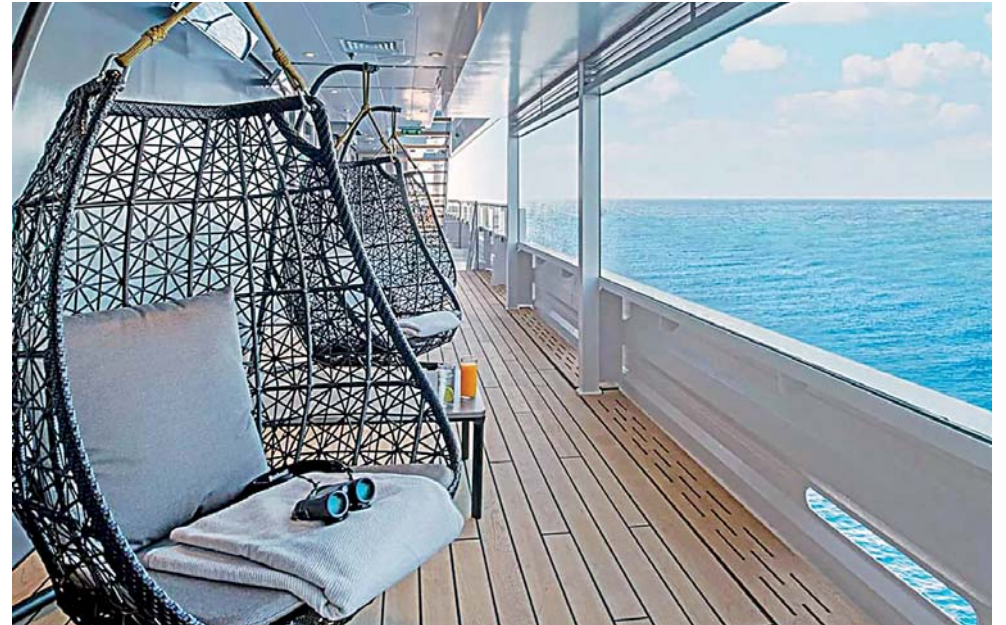
► Se puede disfrutar de una fabulosa vista.

Llegaron los cruceros Celebrity Millennium, procedente de San Diego California y el Scenic Eclipse, de La Paz, Baja California