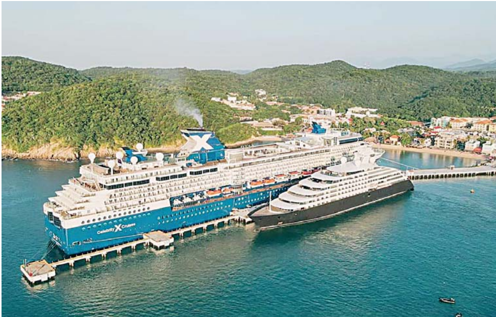
► Los cruceros cuentan con grandes comodidades para los viajeros.