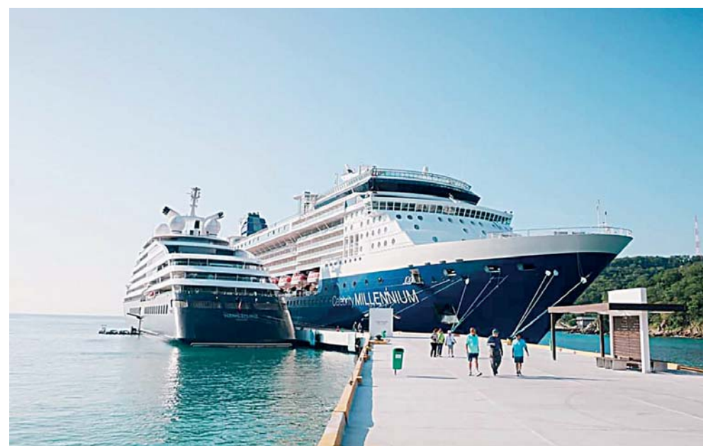
► La llegada de los cruceros reactiva la economía local.