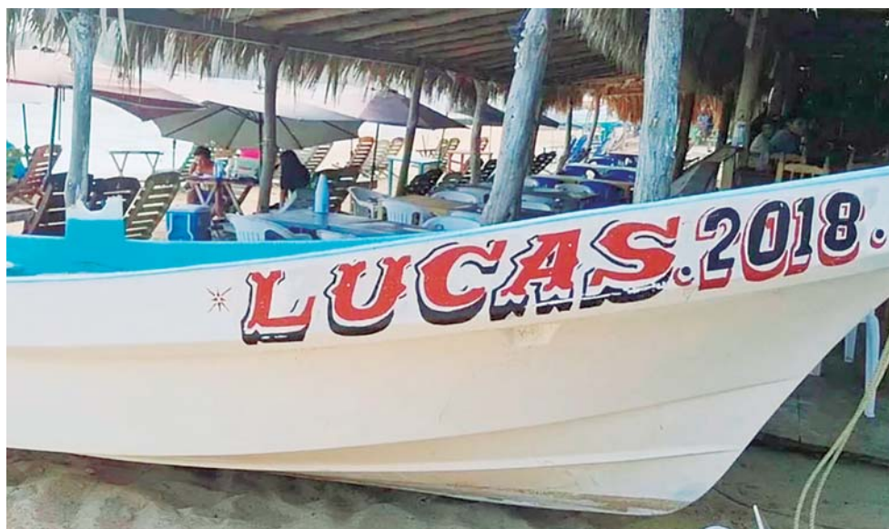
► Embarcación siniestrada.

Este es el segundo accidente que involucra a una embarcación con turistas que se registra en la zona, la primera fue a finales de julio frente a Roca Blanca, jurisdicción de Puerto Ángel, aunque la embarcación salió de Mazunte.