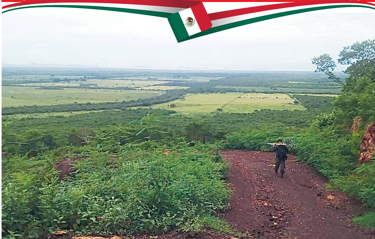
► La mina se ubica en un cerro de alta biodiversidad.