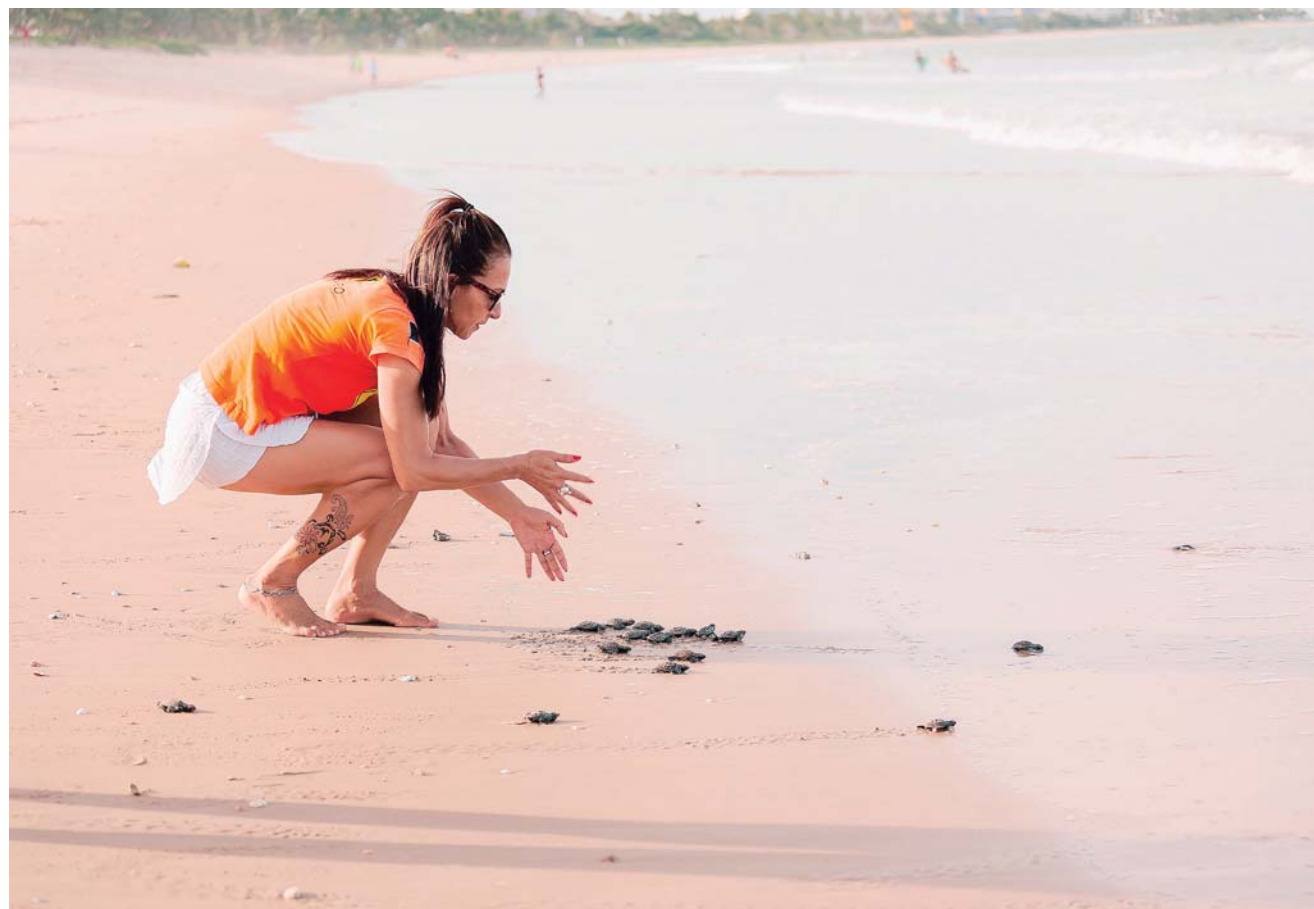
► La liberación de tortugas es una de las experiencias más agradables del hermoso destino turístico.

que Oaxaca es la cuna del mezcal, es por ello que en Puerto Escondido no podía faltar una ruta dedicada a dicha bebida. Aquí podrás acceder a un tour en el que conocerás los detalles de su producción, recorrerás una destilería tradicional y disfrutarás de una degustación