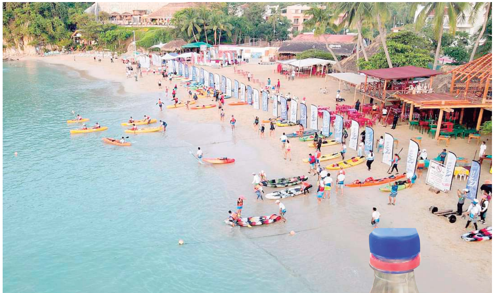
► La bahía de Santa Cruz Huatulco obtuvo el distintivo como "Playa Platino"

Las autoridades municipales y ambientales lamentan dicha irrespon-