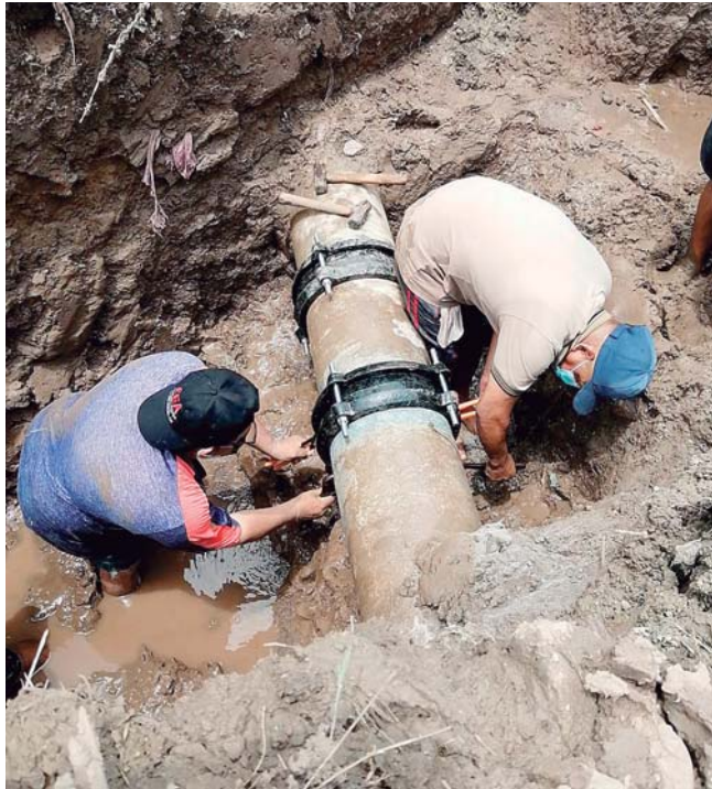
▪ La tubería PVC de 12 pulgadas presenta fallas.