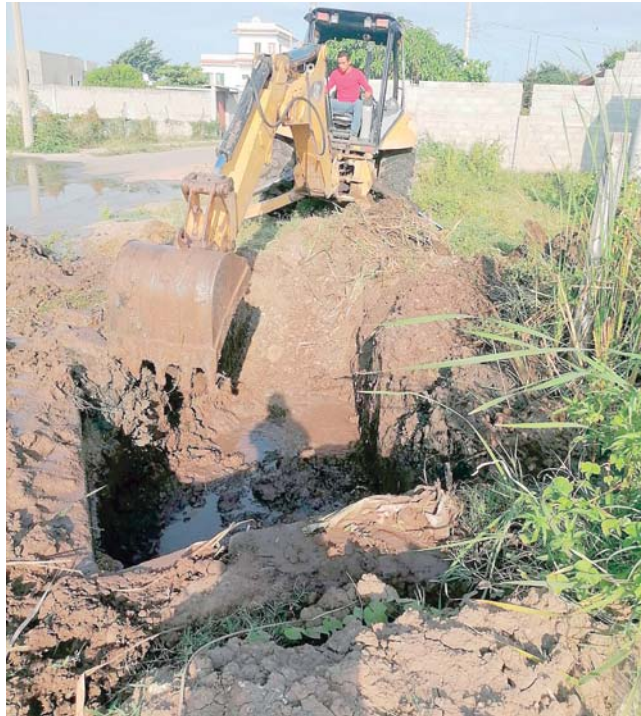
▪ Personal del SAPA trabaja a marchas forzadas.