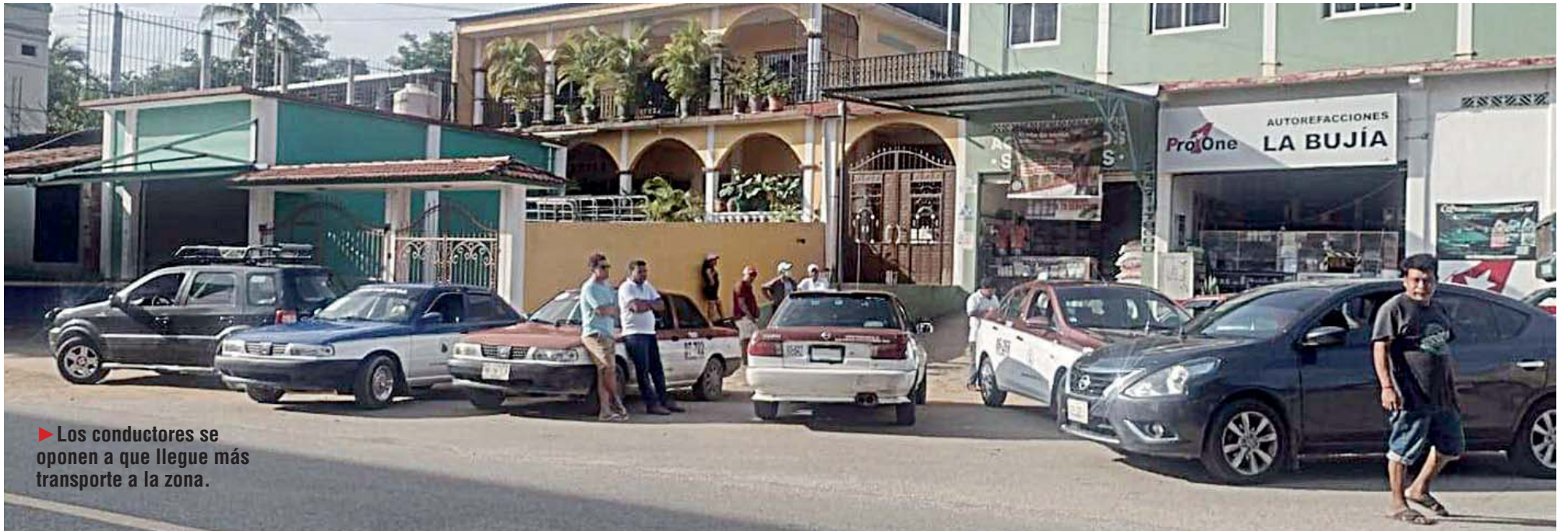
► Los conductores se oponen a que llegue más transporte a la zona.

La Alianza de Transportistas de la Costa montó un bloqueo carretero en el tramo Pinotepa Nacional-Salina Cruz