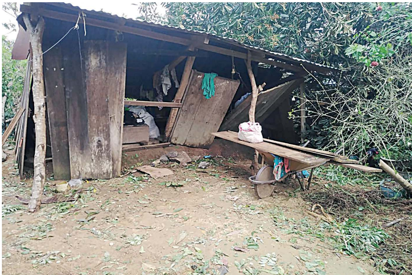
► Varias viviendas resultaron destruidas por el paso del huracán Agatha.

Por ello, insistieron que la mitad de familias que fueron afectadas por Agatha no recibieron apoyos y ello desató inconformidad contra el personal