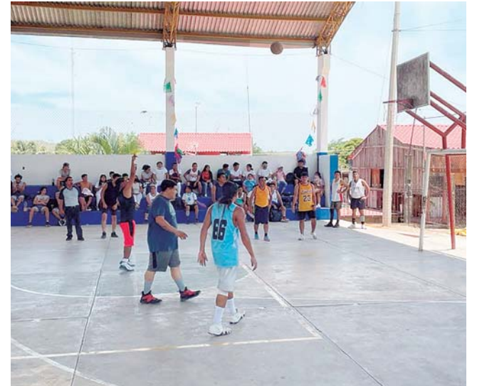
► Diversas actividades engalanaron las festividades de la Patrona de Santa María Tonameca, las cuales iniciaron el primero de mayo.