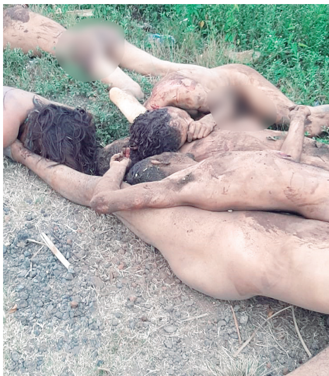
► Los cadáveres se encontraban desnudos.

“Desde el Gobierno de Veracruz, a través de la SSP, atendemos y actua-