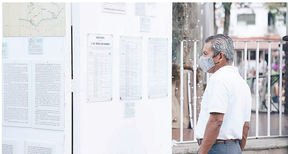
► Invitan a conocer la vida del pueblo de Huatulco.

Dentro de la programación se contempla la tradicional camina-