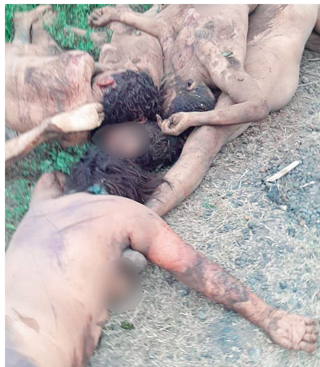
► Aparecieron en el municipio de Isla.