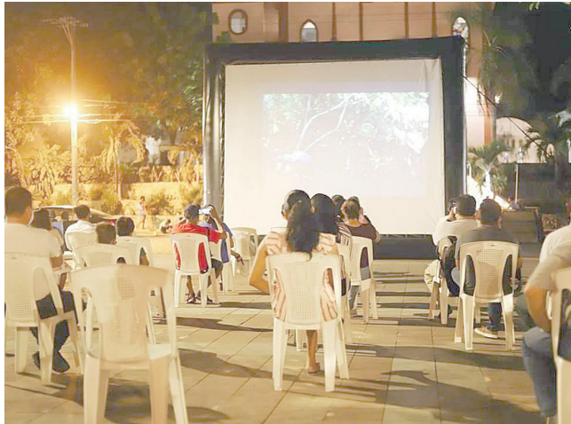
► Proyectan documentales con contenido histórico, social y cultural.