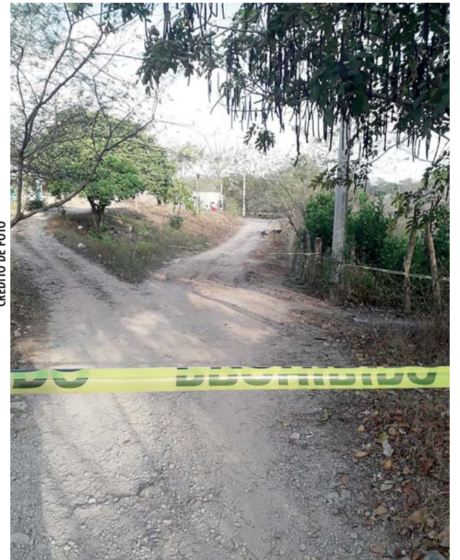
CRÉDITO DE FOTO