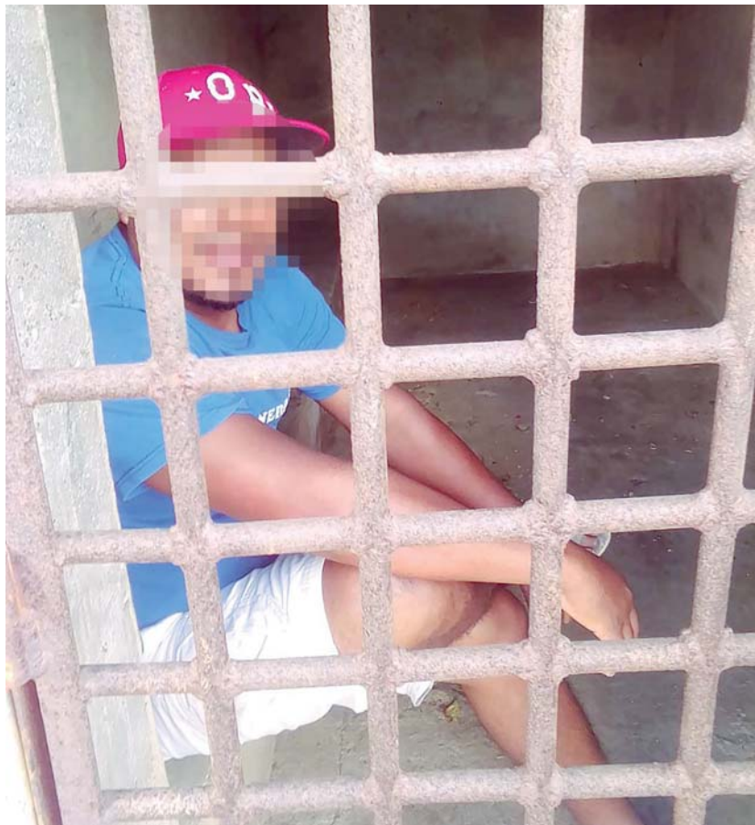
► Ocampo García es acusado por rotular su casa con los colores de Morena.