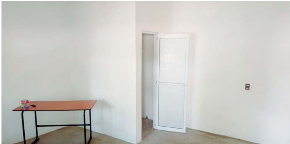
► La instalación médica se ubica en la anterior oficina de Bienes Comunales.