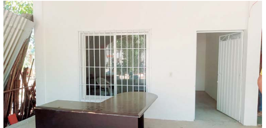
► Será habilitada con equipo necesario.

Se listan detalles para que el establecimiento empiece a funcionar desde los primeros días de febrero