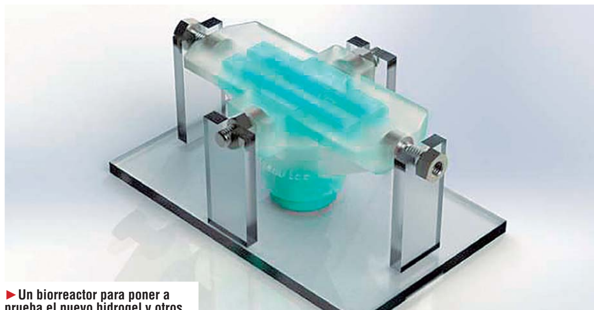
► Un biorreactor para poner a prueba el nuevo hidrogel y otros.

El trabajo es obra de un equipo que incluye, entre otros, a