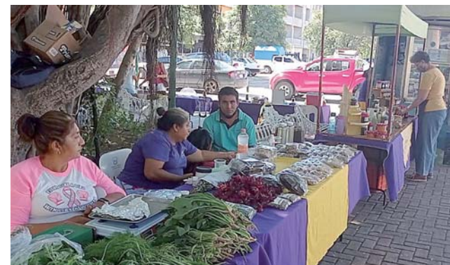
► Se impulsa la alimentación saludable.

“Ha sido un caminar muy bonito porque se han sumado más y más personas conforme han pasado los años, personas que al