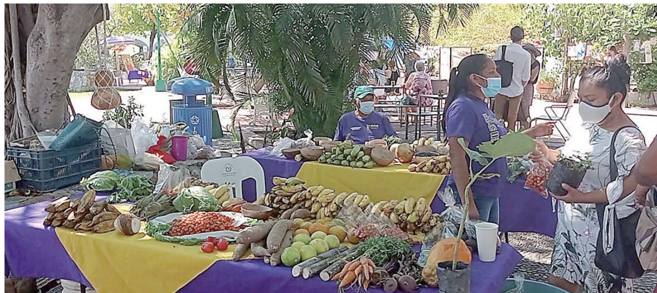
► Los comerciantes ofrecen todo tipo de productos libres de químicos.

El Mercado Orgánico Huatulco está compuesto por productores, en su mayoría por mujeres y hombres provenientes de comunidades de los municipios de Santa María Huatulco, San Pedro Pochutla, Candelaria Loxicha, San Miguel del Puerto, entre otros, quienes siembran y cosechan sus productos de