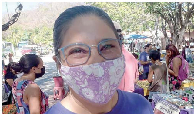
► El lugar también ofrece música, danza y teatro.

manera orgánica y los llevan a la plaza ubicada en el parque de Santa Cruz Huatulco para su expendio.