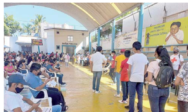
► En punto de las 09:00 horas dio inicio el programa de vacunación contra el Covid-19.

En punto de las 09:00 horas de ayer dio inicio el programa de vacunación contra la Covid-19, en las instalaciones de la unidad deportiva Benito Juárez ubicada en el centro de la ciudad de Puerto Escondido, desde muy temprano se empezaron a dar cita muchos jóvenes de entre 15 y 17 años de edad, acompañados