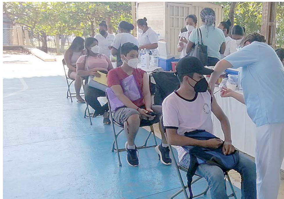
► La aplicación de la vacuna anti Covid-19, está programado para los días 30 de noviembre al 2 de diciembre.

Se tiene previsto la inmunización de alrededor de más 40 mil adolescentes en esta zona, comprendiendo los municipi-