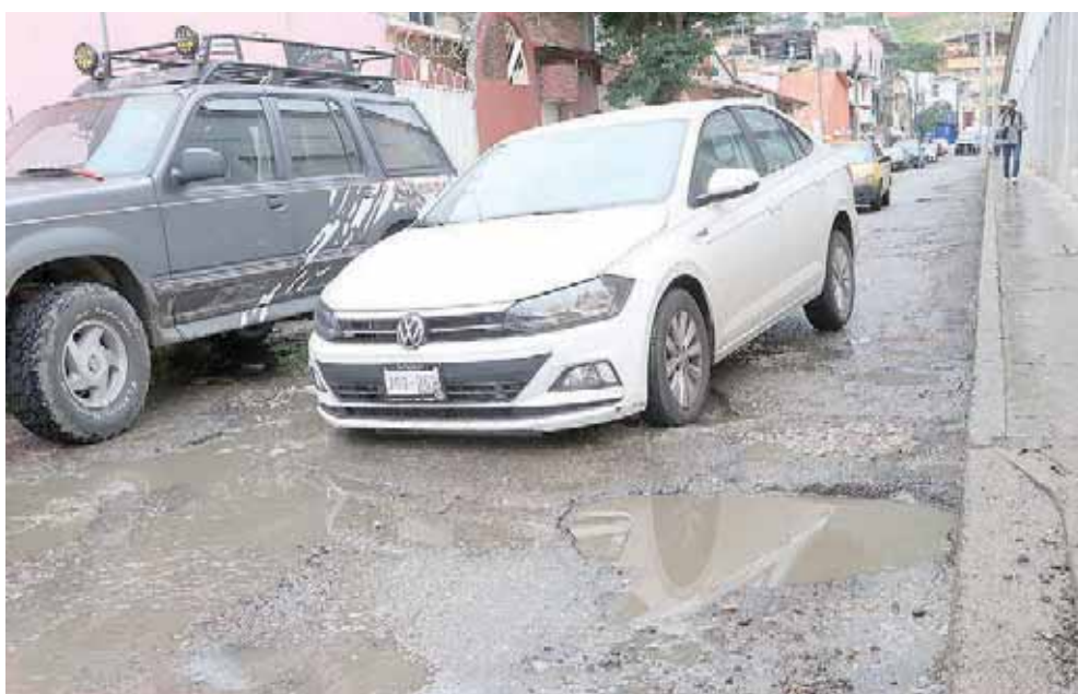
Baches en privada de Margaritas entre Niños Héroes y Calzada Madero.