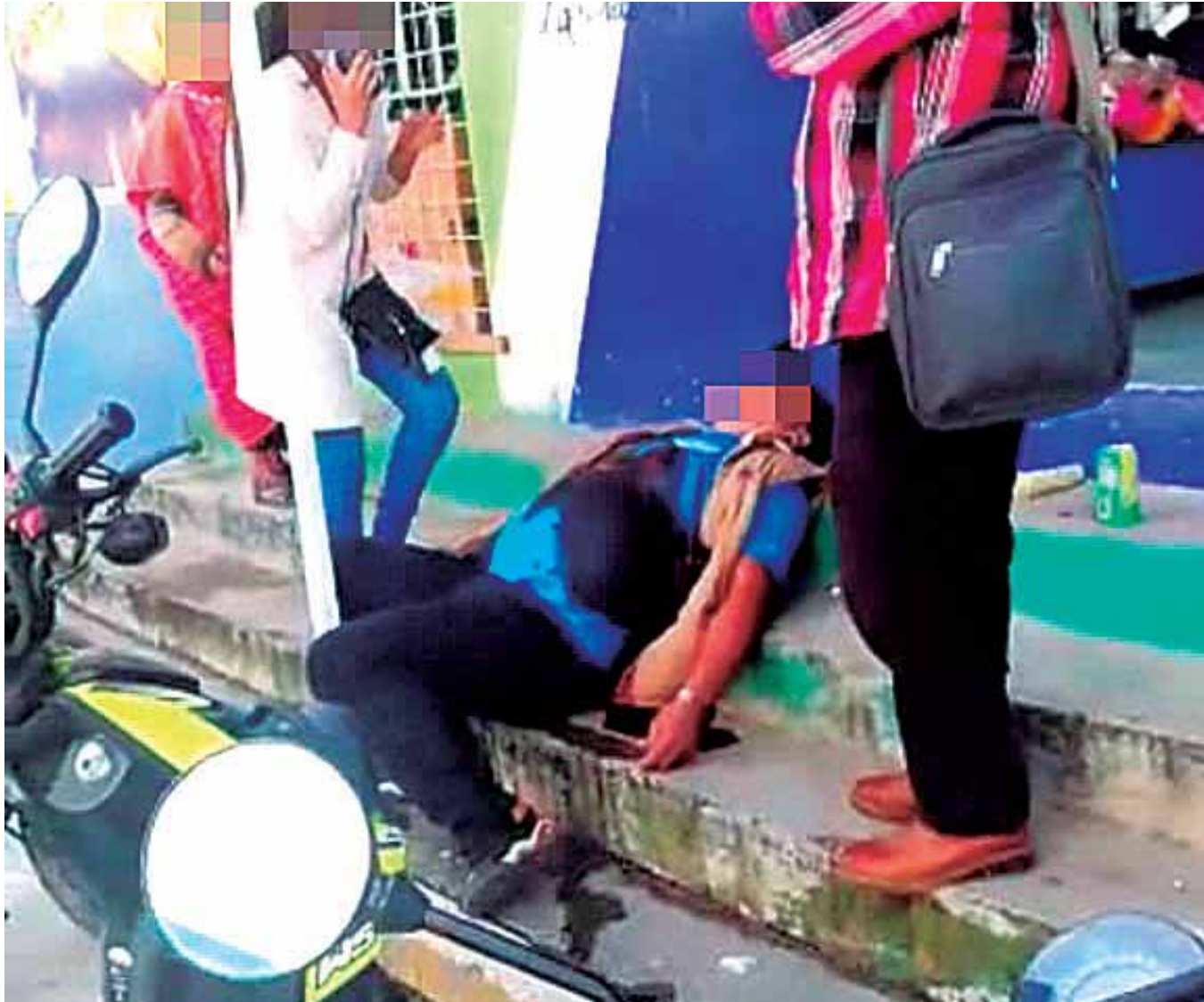
El hombre fue abatido en una banqueta.