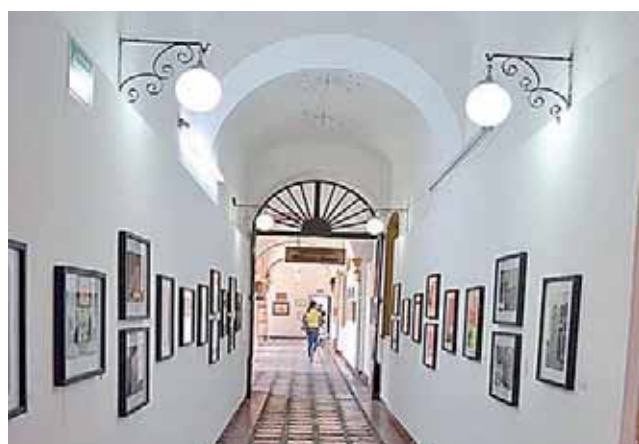
Los detalles de la programación pueden consultarse en las redes sociales de la Seculta y de la CCO.

directores en su historia, por lo que este memorial busca conocer desde la voz de ellos “la trayectoria de la institución a través de las anécdotas”.