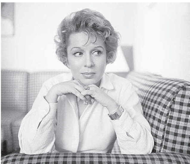
La figura de Pita Amor y su obra están resurgiendo.