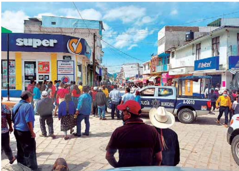
La zona del crimen fue inundada de curiosos.

integrantes de MULT han sido asesinados en 20 años