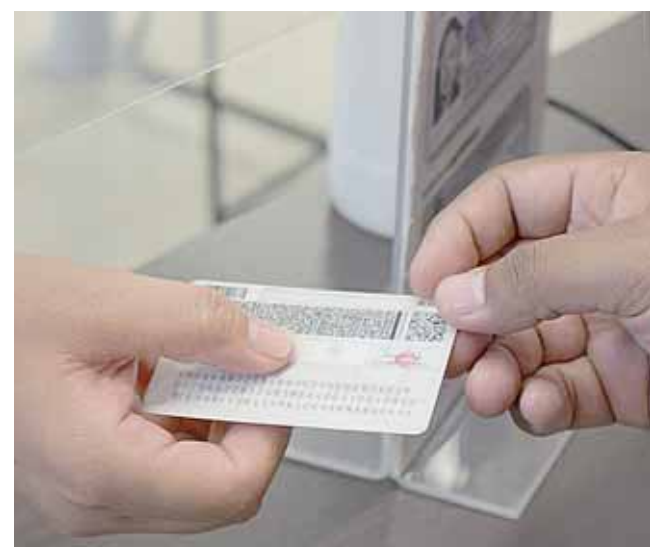
El Registro Federal de Electores resguardó las micas de 5 mil 235 ciudadanos.

Para las elecciones pasadas, unos 37 mil 306 jóvenes que cumplieron 18 años y que cuentan con su credencial de elector tuvieron la oportunidad de ir a las urnas por primera vez.