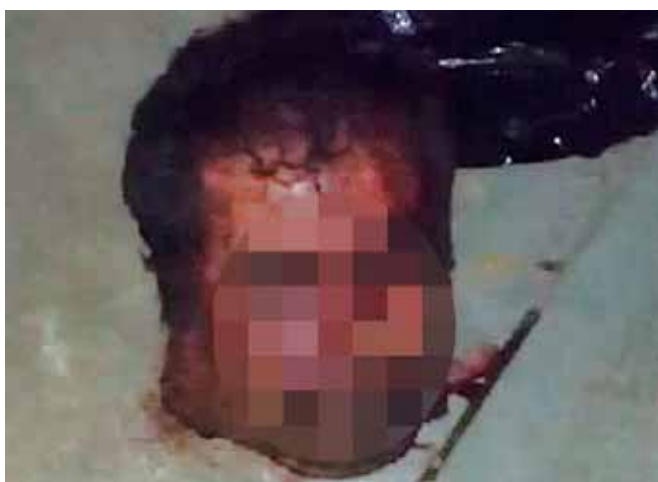
Las cabezas cercenadas estaban junto a un mensaje amenazante.

MATÍAS ROMERO. - Un macabro descubrimiento realizaron vecinos de la cabecera municipal de Santo Domingo Petapa, al darse cuenta que frente a la Escuela Secundaria General, Benito Juárez, había dos cuerpos de hombres descuartizados, y al lado de los cadáveres apilados se encontraban dos cabezas cercenadas y dos cartulinas de