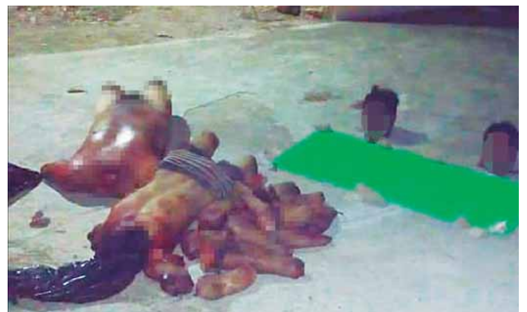
Los cadáveres estaban apilados frente a una Escuela Secundaria General, Benito Juárez, en Petapa.

Hasta el momento, las víctimas permanecen en calidad de desconocidas, por el caso las autoridades