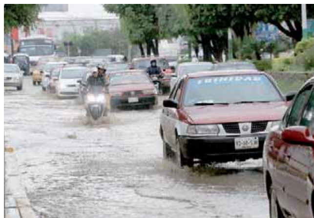
Los encharcamientos en Xoxocotlán han provocado baches en varias vialidades.

Así mismo, Camino Nacional es otra de las vías de comunicación que luce abandonada debido a que en varios tramos desde el