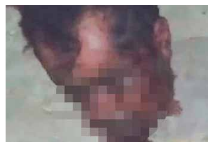
Las víctimas aún no han sido identificadas.

Los hechos dejaron conmocionados a los vecinos de Petapa y ciudadanos de la región del Istmo, pues parece que la violencia se ha recrudecido en la zona y exigen a las autoridades tomar cartas en el asunto.