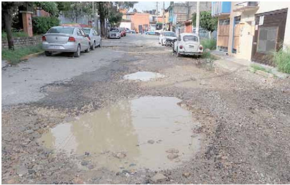
En la quinta Etapa Fraccionamiento el Rosario los baches cada vez son más grandes.

Por lo que, los automovilistas deben sortear hoyancos grandes en su camino a sus centros de trabajo, zonas comerciales, o inclu-