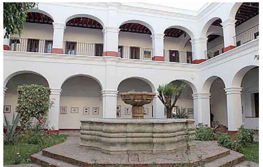
La CCO ha tenido 19 directores en su historia.

Del 28 de junio al 3 de julio, el recinto ofrecerá un programa multidisciplinario con la participación de exdirectores, alumnado, talleristas y artistas invitados