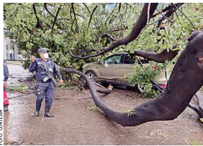
En Periférico, un árbol cayó sobre un automóvil que circulaba a la altura de la tienda Piticó; el conductor salió ileso.

Los efectos serán generados por dos canales de baja presión extendidos en diferentes regiones de la