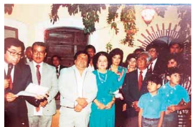
■ Este importante proyecto se inauguró en la avenida Hidalgo 1311-B en un evento que contó con la participación de familiares y amigos de los propietarios.