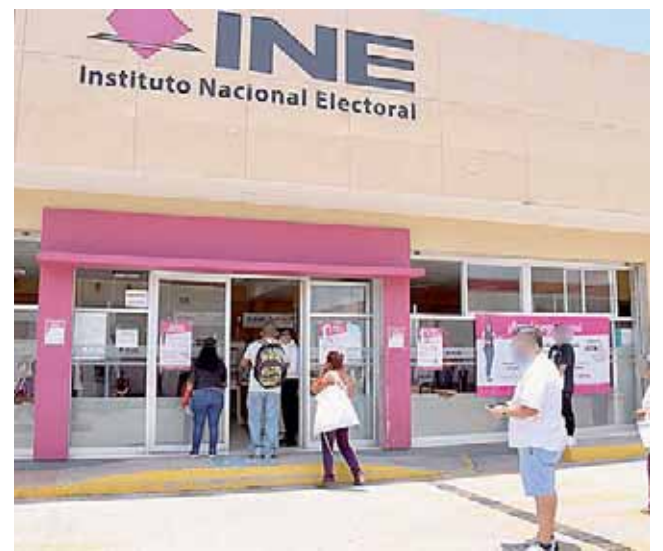
En la entidad se tienen en operación 14 módulos fijos del RFE.

De donde, usuarios urgieron tanto a la SCT como a Caminos y Aeropistas de Oaxaca dar mantenimiento a las vialidades, dado que las abandonaron desde hace un año con el inicio de la pandemia de Covid-19.