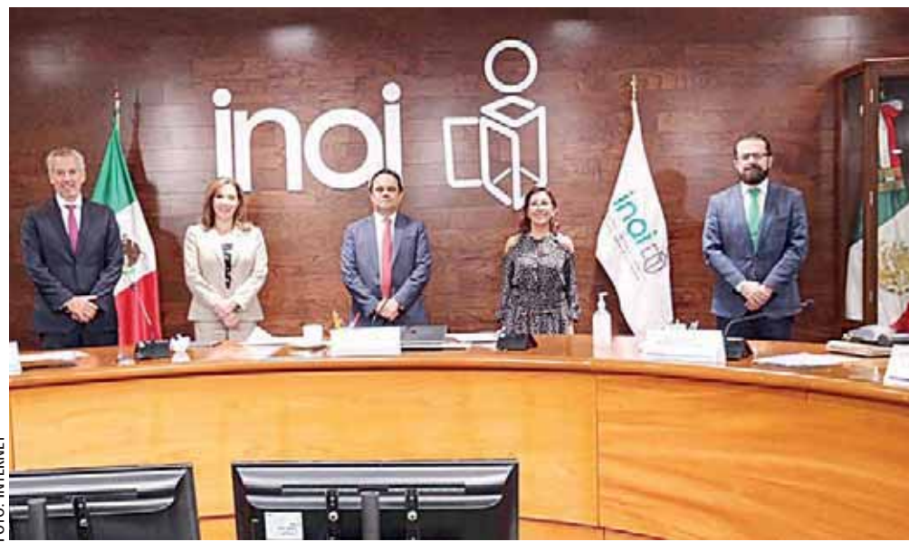
El pleno del INAI aprueba interponer una acción de inconstitucionalidad ante la Suprema Corte para evitar la desaparición del IAIP.

“Es cuestionable cómo se llevó a cabo el proceso legislativo para la desaparición del órgano garante, además, pone en riesgo la garantía de los derechos de acceso a la información y acceso