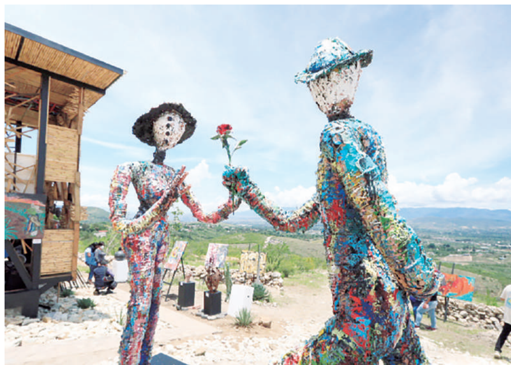
El Mogote de Humo reunió a más de 55 artistas plásticos y visuales en la exposición colectiva que presentó este fin de semana.