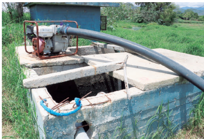
El manejo deficiente de las aguas provoca contaminación en los ríos.

98 % de las descargas de aguas residuales que contaminan a los ríos Atoyac y Salado, son descargas de tipo municipal sin tratamiento debido a la mala o nula operación de las Plantas de tratamiento, destacando que “el contenido de coliformes fecales se presenta muy por arriba de los límites permisibles tanto en temporada de lluvias como de estiaje”.