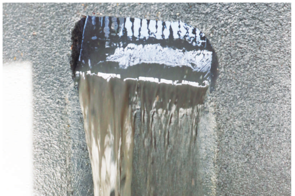
Las aguas negras terminan en el río Atoyac o el Salado.