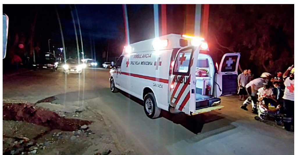
Los hechos fueron en la avenida Gómez Morín.