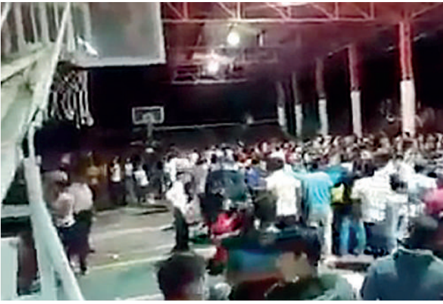
Tras la trifulca una persona resultó severamente herida y fue trasladada al hospital.