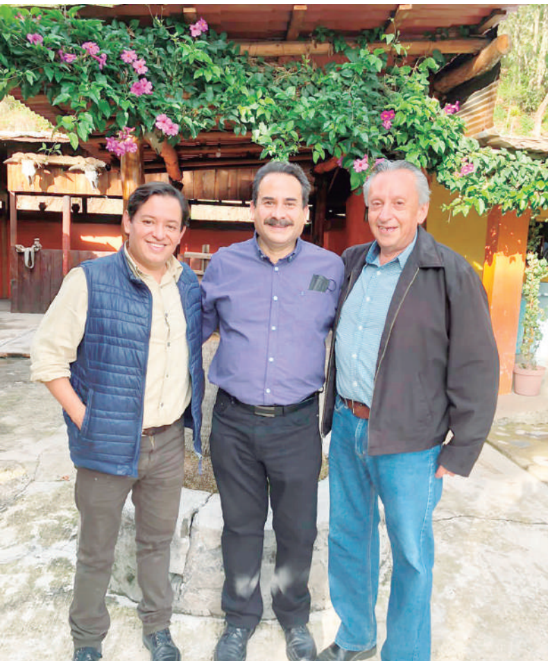
■ El cumpleaños convivió también con sus compañeros de trabajo que lo felicitaron en su día.