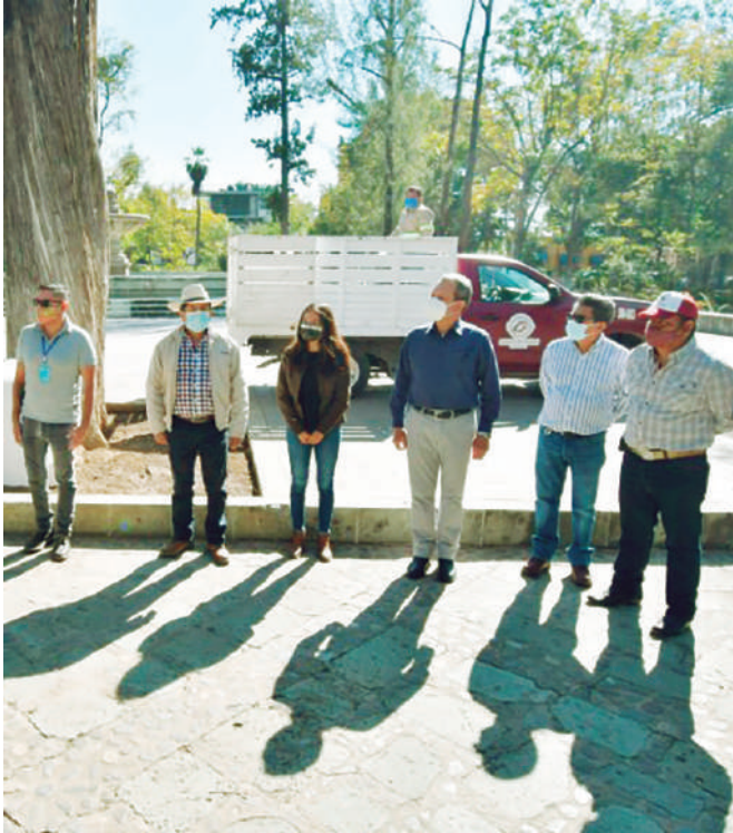
El hermanamiento con Palo Alto, California, quedó asentado con un cedro blanco sembrado en El Llano.