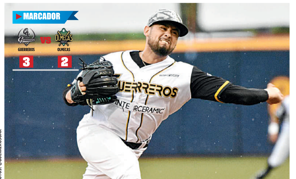
■ Guerreros dio el máximo esfuerzo.