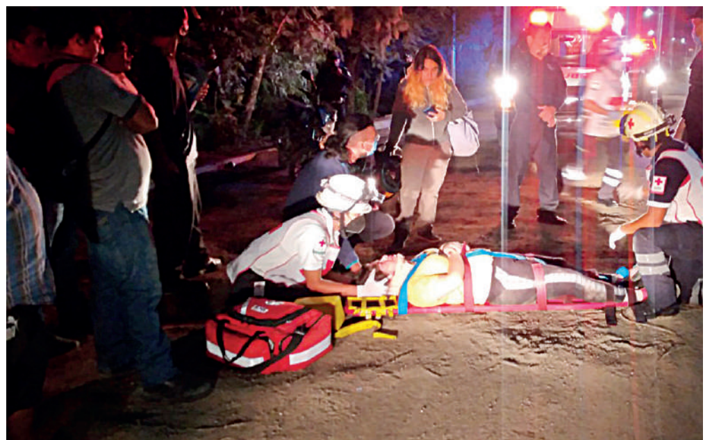
Una mujer resultó con lesiones en la cadera al caerse de la moto.

Mientras que en la avenida Emiliano Zapata esquina con Heroica Escuela Naval Militar, en la colonia Reforma, se registró el derrape de un repartidor de comida rápida de la empresa Didi Food, cuando via-