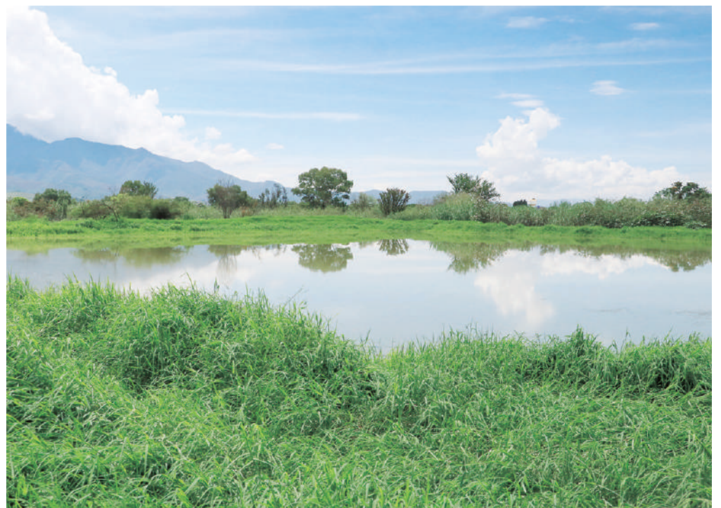
Algunos vecinos señalan que el olor que desprende la planta tratadora se intensifica.

Con el aumento de temperaturas, algunos vecinos señalan que el olor que desprende la planta tratadora se intensifica. Además de que —como se confirmó— algunos de los registros muestran deterioro o