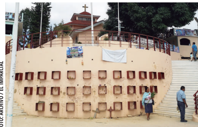
■ Los peregrinos católicos no pueden acceder a El Pedimento por un conflicto agrario entre Juquila y Yaitepec.