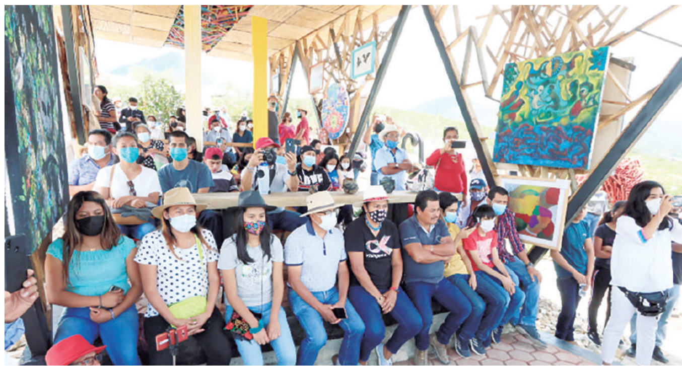
El objetivo es que la sociedad se reconecte con la naturaleza y haga propia la necesidad de preservar el medio ambiente.

Con un programa artístico y cultural, se dio a conocer este fin de semana un espacio para promover el cuidado del medio ambiente y que este sea disfrutado por futuras generaciones