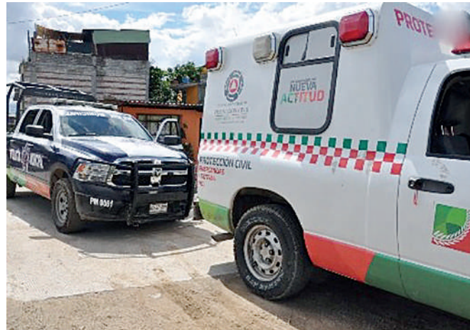
Paramédicos de Protección Civil de Santa Lucía auxiliaron a la víctima.