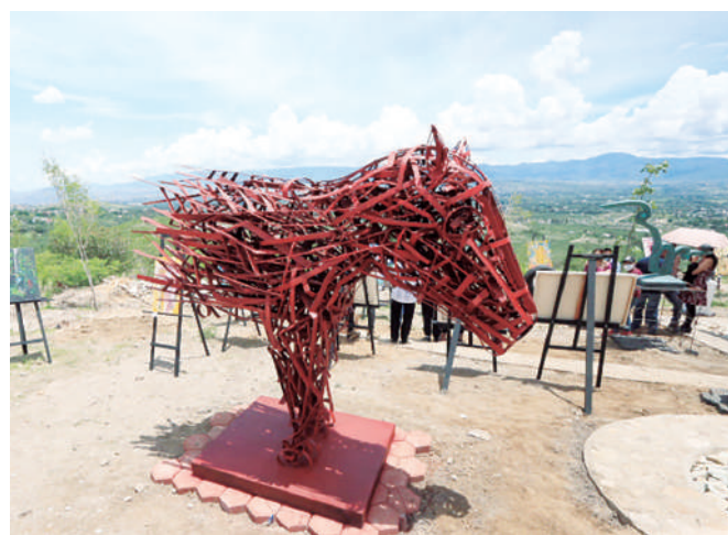
También se observa la necesidad de que la humanidad cuide su entorno.

“Quieren implementar proyectos que se integren al espacio, como este, que no es ni una cabaña