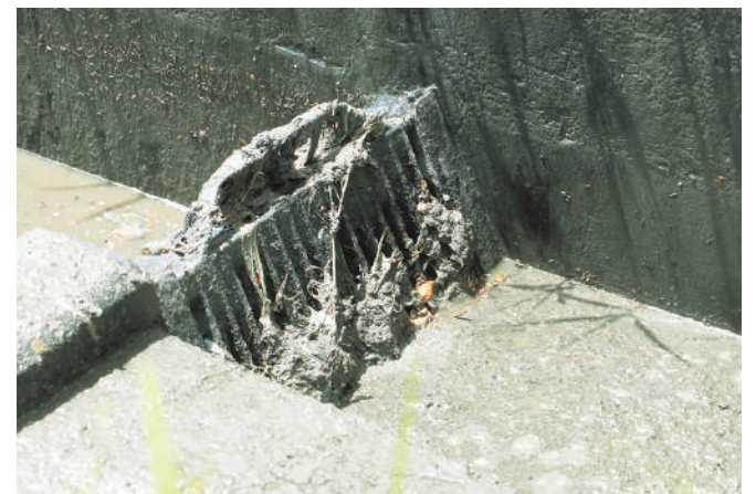
El 78 % de las viviendas de Nazareno están conectadas a la red pública.