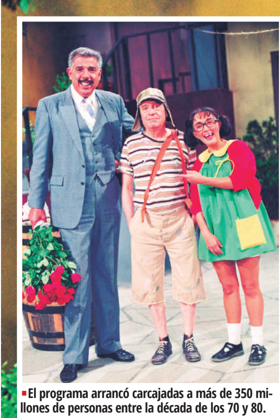
El programa arrancó carcajadas a más de 350 millones de personas entre la década de los 70 y 80.