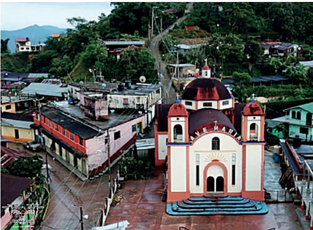
El violento acontecimiento sucedió en Pluma Hidalgo.

Por el momento, la autoridad municipal no se ha pronunciado por lo ocurrido durante este baile popular, en el cual un grupo costeño amenizó el evento.