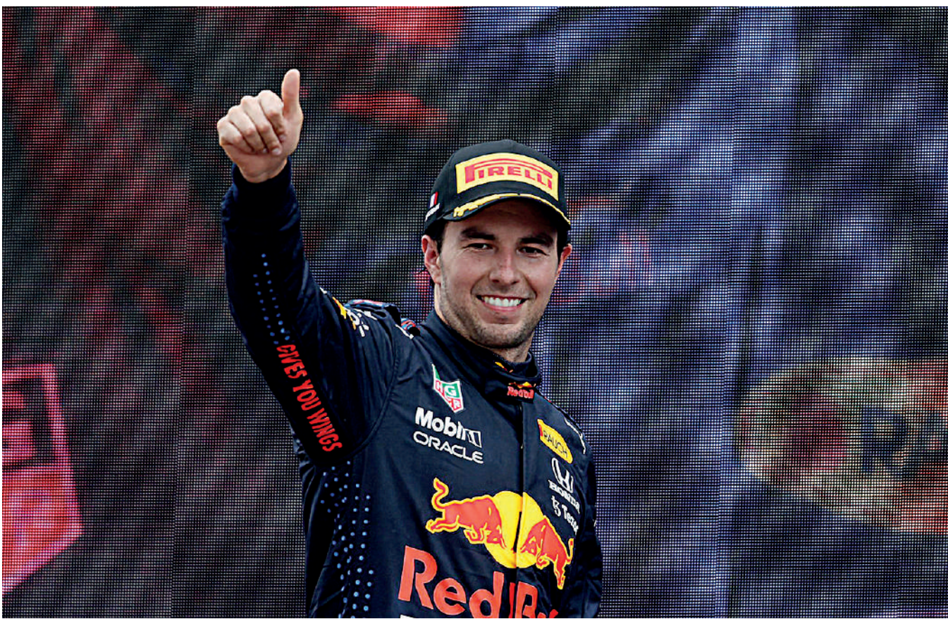
■ Su sonrisa lo expresa todo.