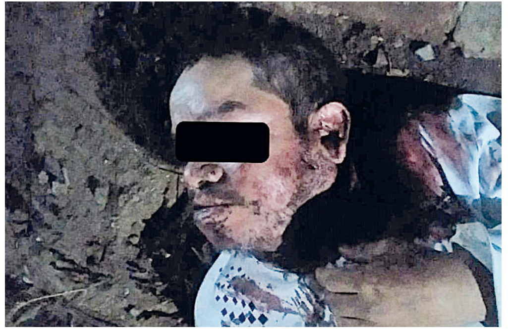
El hombre quedó con serias lesiones en el rostro.

En las primeras declaraciones del lesionado, señaló que serían alrededor de las 23:30 horas del domingo, cuando se dirigía a su domicilio ubicado en Santa Lucía del Camino, pero