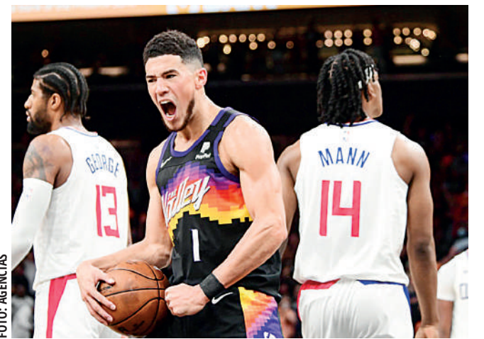
■ El primer capítulo va para los Suns.

Reggie Jackson agregó 24 puntos para los Clippers.