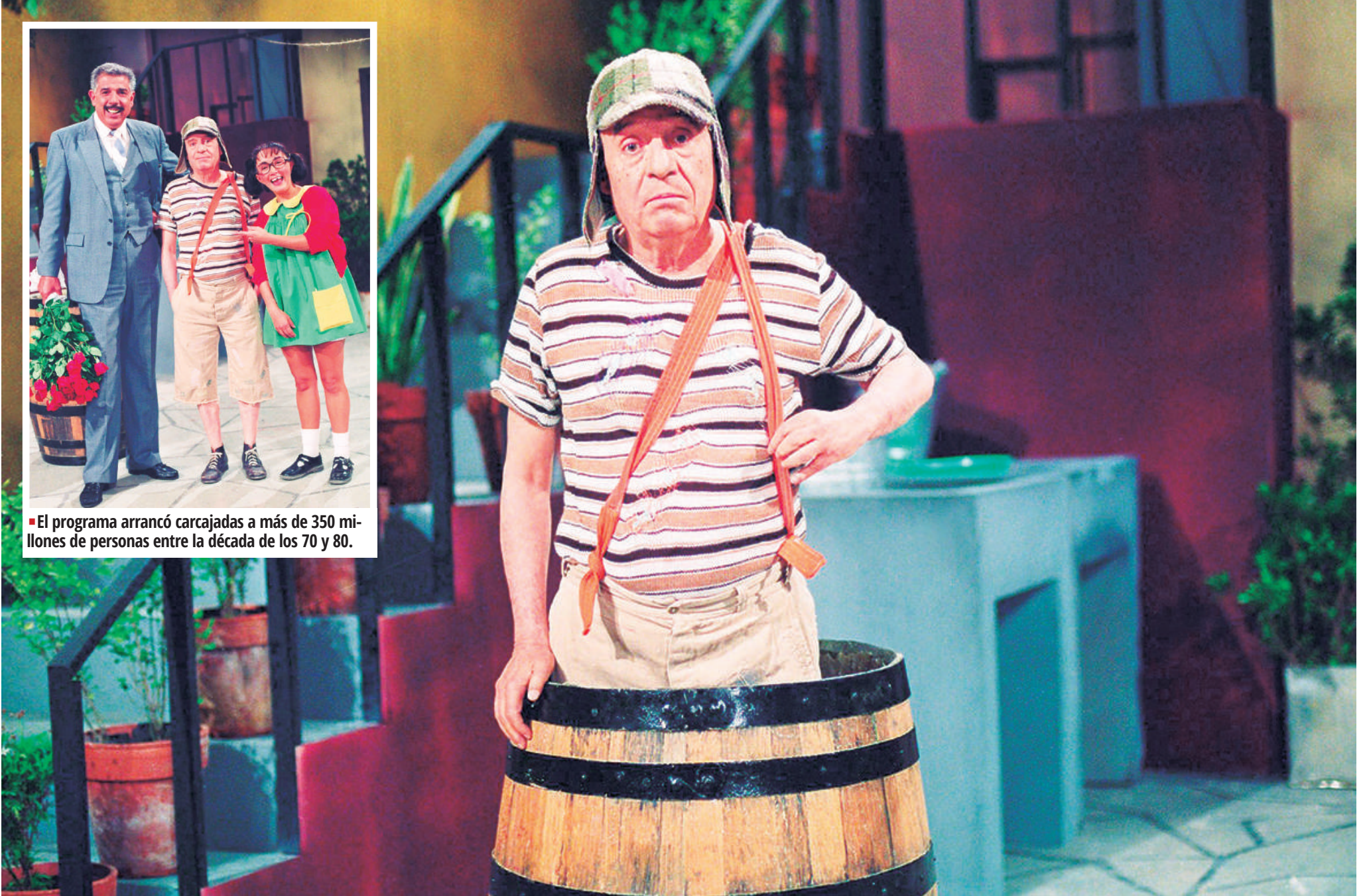
“El Chavo del 8” es considerada por décadas la serie de comedia mexicana más importante de la historia.