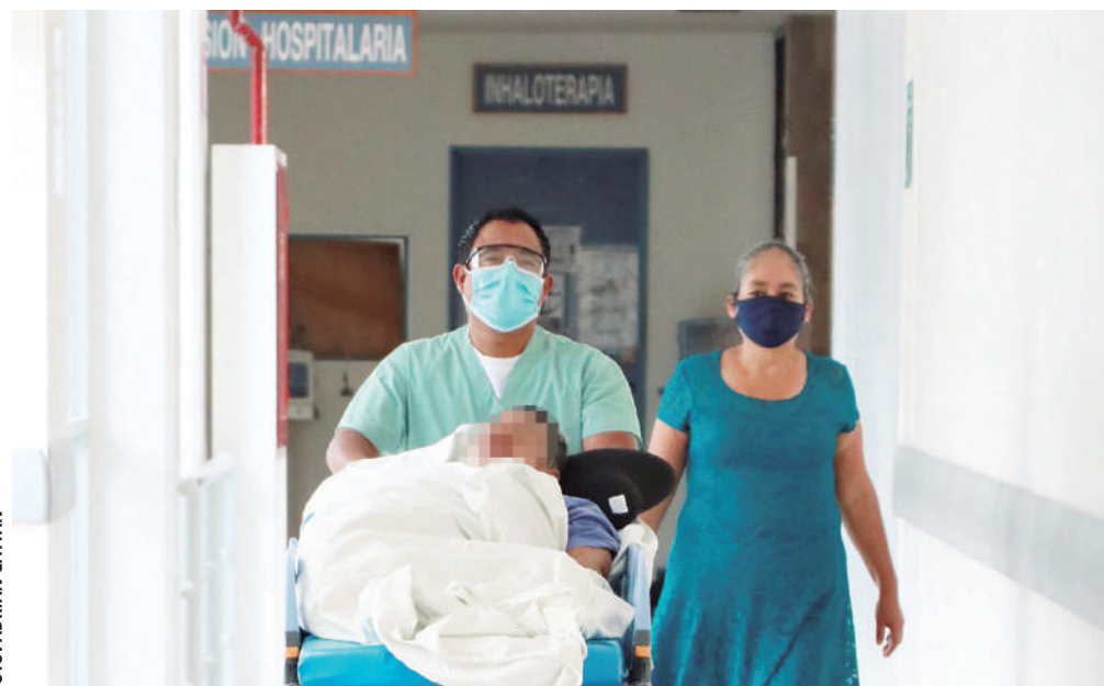
■ Mientras el sector Salud ha iniciado con la reconversión de hospitales Covid en Oaxaca, los contagios tienden a aumentar como consecuencia de los festejos y por no acatar las medidas sanitarias.

Así también, la red hospitalaria para la atención de pacientes con Covid registró un aumento del 2.6% en el número de hospitalizados en comparación con la semana anterior, por lo que la ocupación promedio es del 17.7%. De igual for-