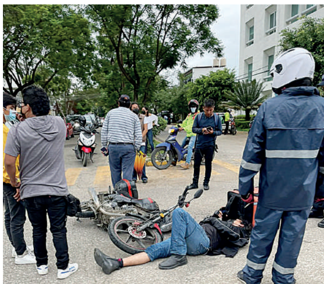
Un joven repartidor derrapó en la colonia Reforma.