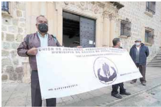
La protesta se dio casi a la par de la sesión virtual de cabildo.

“El ayuntamiento siempre ha dado largas, hay compañeros que tienen tres o cuatro años que no han cobrado sus finiquitos, hasta cinco años. No se vale porque ya trabajamos, ya dimos un ser-