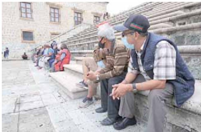
Son cerca de 20 jubilados que no han recibido sus finiquitos.