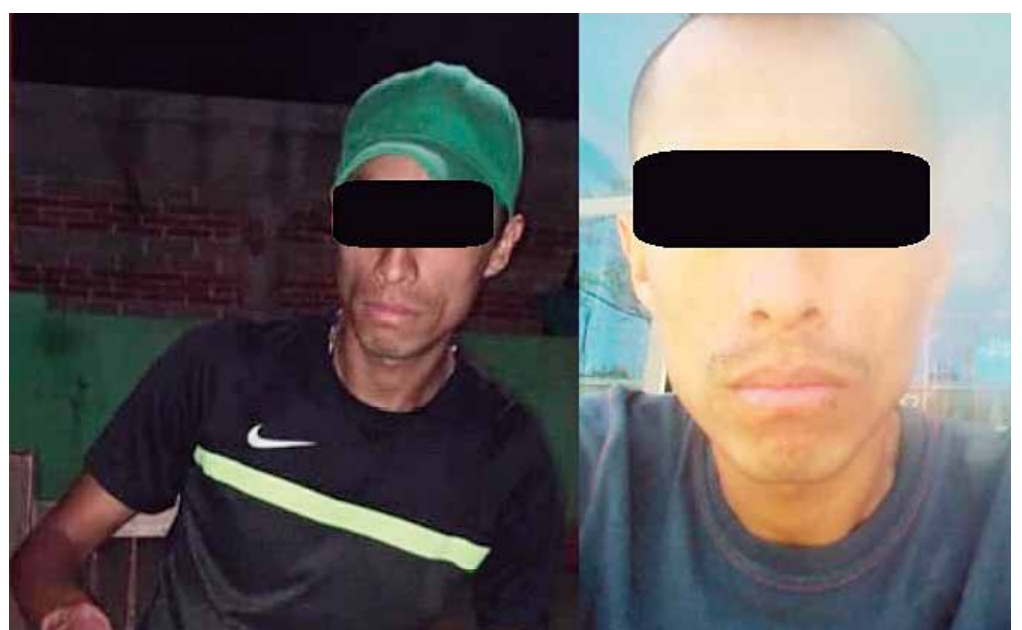
El sujeto fue encontrado culpable del delito de sustracción de menores; la víctima del desalmado hombre fue una niña de 11 años de edad.

La Fiscalía Especializada en Atención a Delitos Contra la Mujer por Razón de Género, al lograr identificar al probable responsable, solicitó la colaboración de la Fiscalía de Puebla, en donde presuntamente se