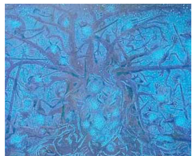
Aplica la técnica correcta del color en su obra, la misma que ahora expone al público en es Casántica.