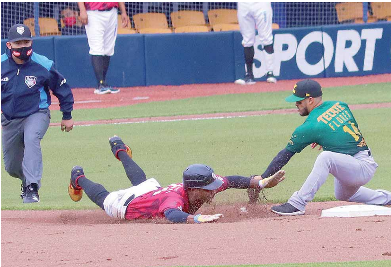
Guerreros de Oaxaca empató la serie ante Leones de Yucatán.