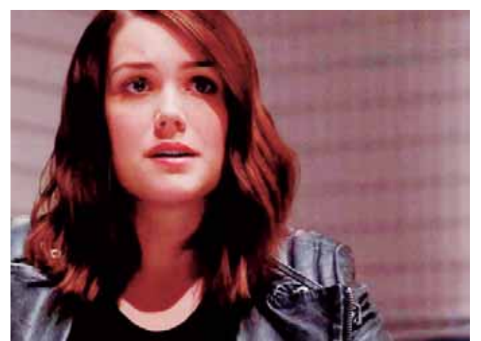
Boone tomó la decisión de abandonar la serie antes de que renovara por una novena temporada.

Incluso Lucero revivió aquella escena con una fotografía en sus redes sociales en la que la vemos al momento de ser maquillada para la escena final.