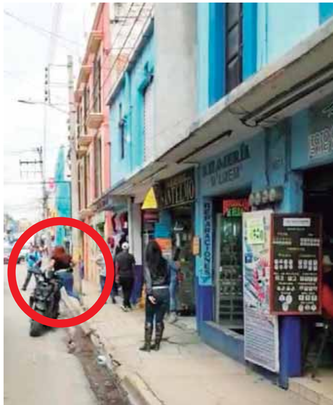
Al final, la supuesta delincuente corre hacia el centro de la ciudad, sin que nadie la detenga y auxilie a la mujer.

Los hechos fueron captados a través de cámaras de videovigilancia del lugar y fueron exhibidos a través de las redes sociales, virilizándose el video y causando la indignación de los usuarios, quienes exigieron justicia para la víctima y se le aplique todo el peso de la ley a la presunta delincuente.