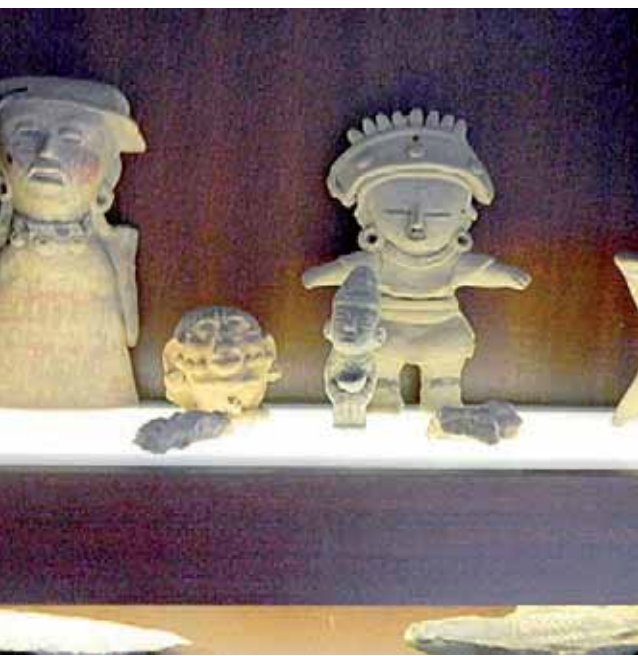
Se trata de una treintena de figuras procedentes de culturas del altiplano central mexicano.