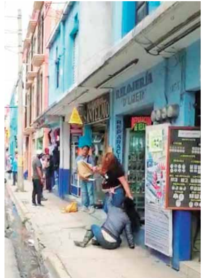
En las imágenes se aprecia el momento en que la presunta asaltante intercepta a su víctima y al resistirse al atraco, arremete a golpes sin compasión contra ella, hasta dejarla tirada en el piso.