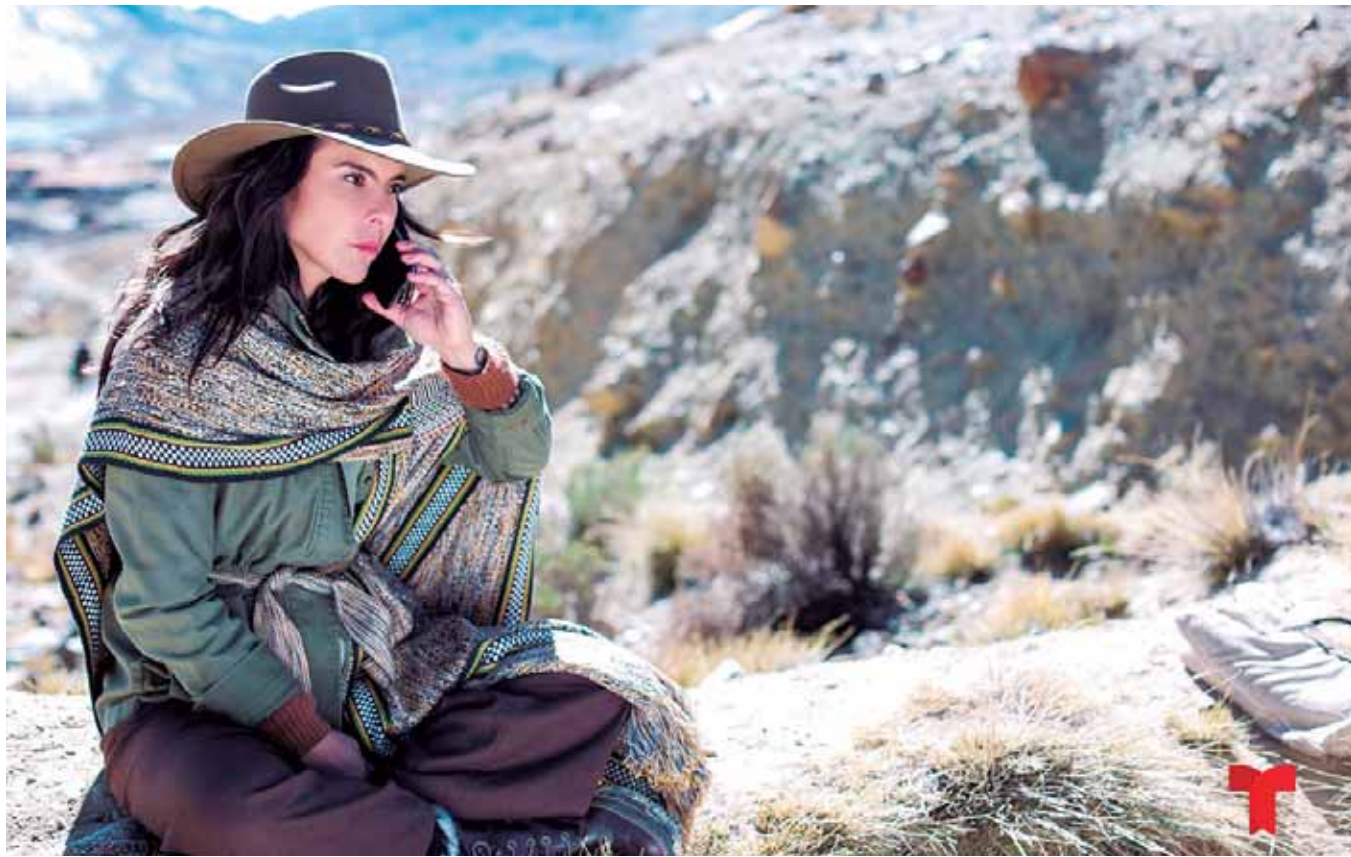
La segunda temporada, transmitida en Estados Unidos en 2019, tuvo tanta popularidad que hacer la tercera era necesario.

“La gente de Telemundo es muy celosa de sus guiones y no nos cuentan mucho hasta que se empie-