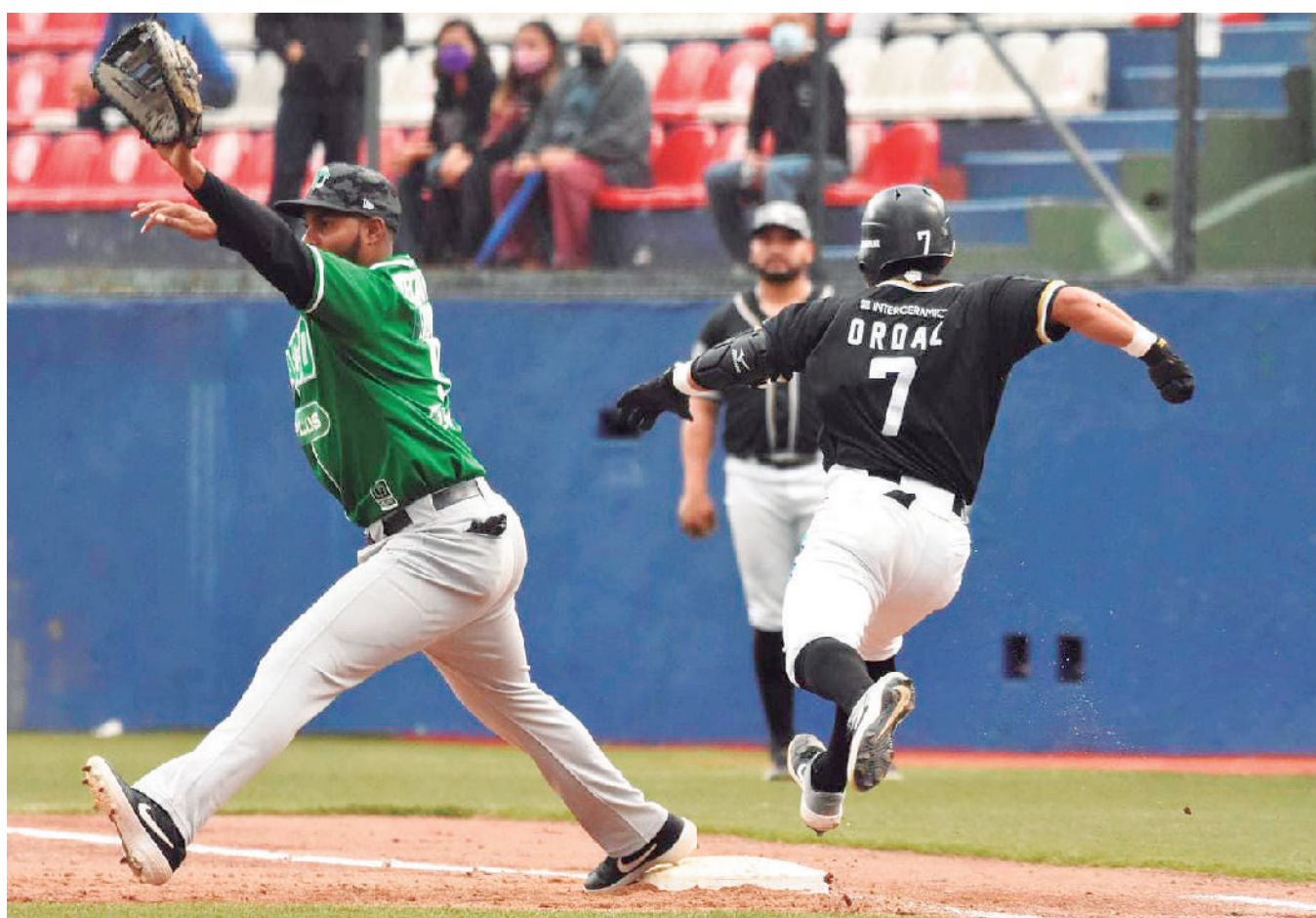
Los visitantes hicieron su trabajo.