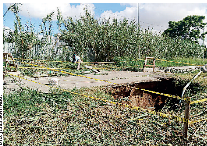
Acordonan los socavones que han aparecido en la ciudad, pero no brindan soluciones.

Si bien, hasta este sábado no se habían reportado accidentes o daños a causa de los socavones. INFORMACIÓN 5A