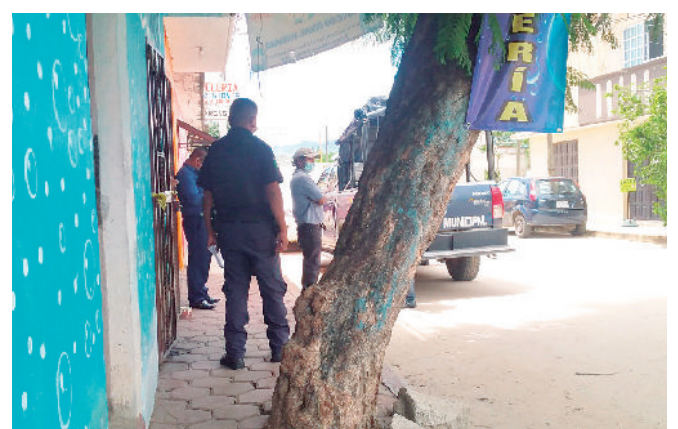
Policías acordonaron el área en la espera de la AEI.

Ellos creen que los problemas que tenía con su esposa, tras separarse, pudieron haber sido las causas de tal decisión.