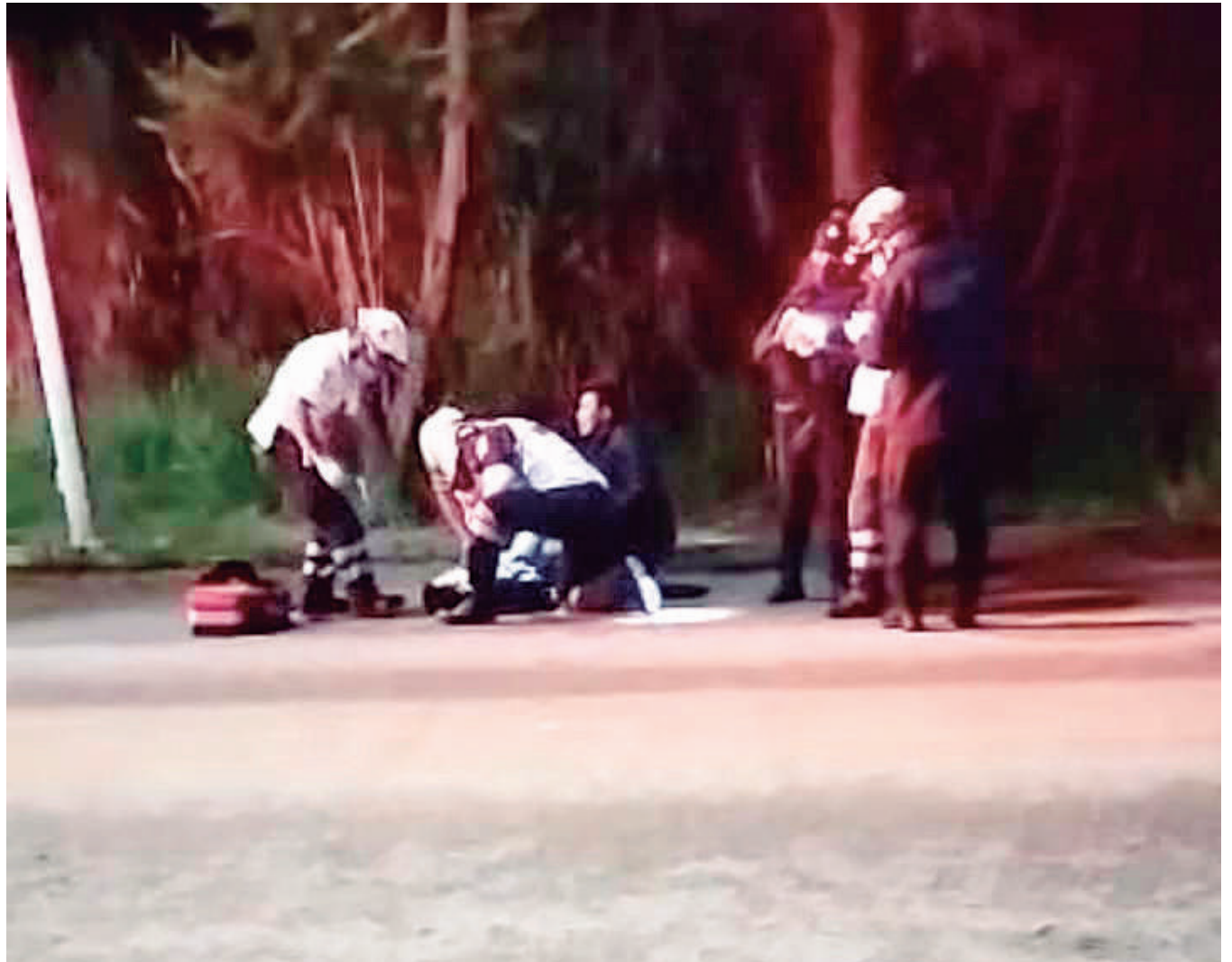
La víctima falleció al instante al recibir un impacto de bala a la altura del pecho.

Reportes preliminares aseguran que, en un salón de eventos llamado Quinta Amaranto, ubicado en esa zona en donde sucedió el crimen, se estaba llevando a cabo un mega evento, al parecer de dicho lugar habían salido el ahora occiso y sus agresores, sin embargo, eso no ha