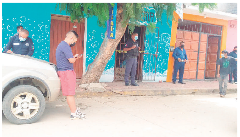
Los lamentables sucesos fueron en un domicilio ubicado en la colonia la Paz, en Santa Cruz Xoxocotlán.

La madre del suicida señaló que alrededor de las 7:00 horas subió a la segun-