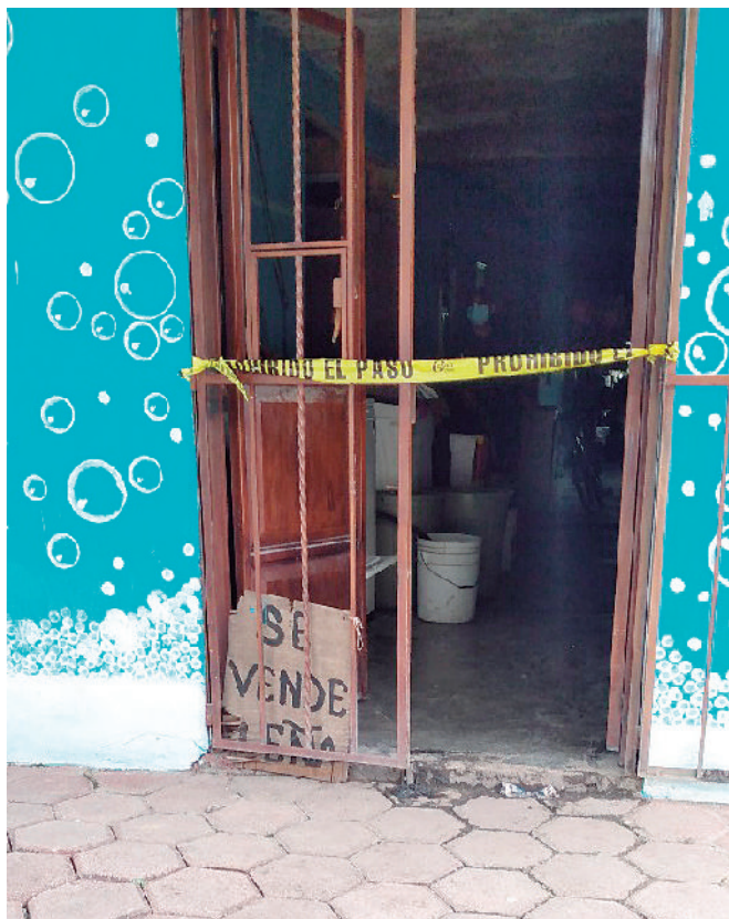
El hombre fue localizado pendiendo de un mecate en una puerta.

Más tarde, a la zona arribaron elementos de la Agencia Estatal de Investigaciones (AEI), quienes realizaron una inspección el área, los primeros reportes indican que el albañil se había suicidado colgándose