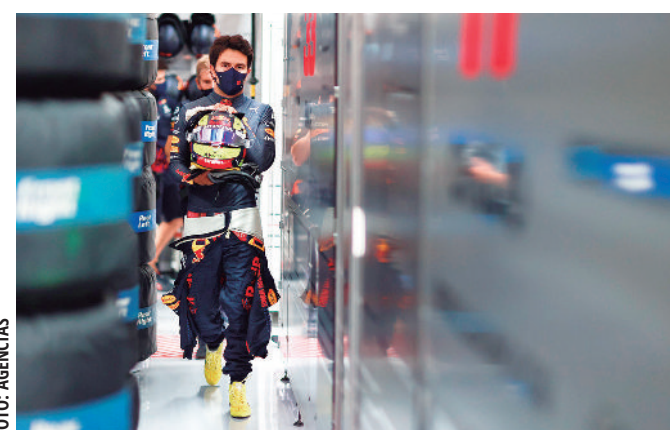
El piloto mexicano se alista para la carrera.

Los Mercedes no se quedaron atrás durante las prácticas no la pasó nada bien, sacó provecho en la clasificación para amarrar el segundo lugar. Valtteri Bottas logró mejorar en su último chance, por apenas 386 décimas detrás del piloto del equipo de la escudería austriaca.