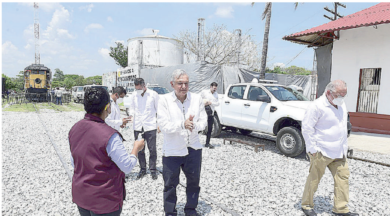
■ El llamado Corredor Interoceánico del Istmo de Tehuantepec (CIIT) es, hasta este momento, un proyecto ficticio. No ha avanzado ni un ápice.

Desde el Palacio de los Virreyes el concono social se acentúa y se inventa una lucha de clases. Se accedió por vía democrática, pero se cierran espacios a la libre expresión y a la diferencia de opiniones. Se vislumbra un “aspiracionismo” a prolongar mandato y a la imitación de dictaduras. El patíbulo parece destino de los opositores.