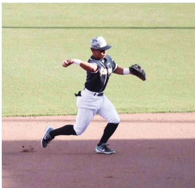
Oaxaca lo intentó hasta el final.