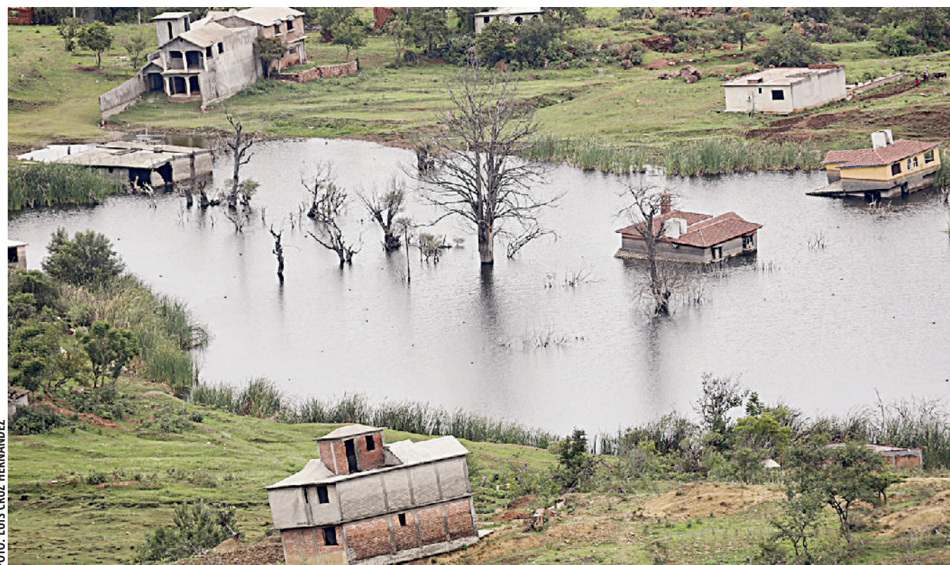
Desde hace casi una década un socavón y una laguna devoraron a Santiago Mitlatongo.

ANDRÉS CARRERA PINEDA- LUIS CRUZ HERNÁNDEZ/ ENVIADOS