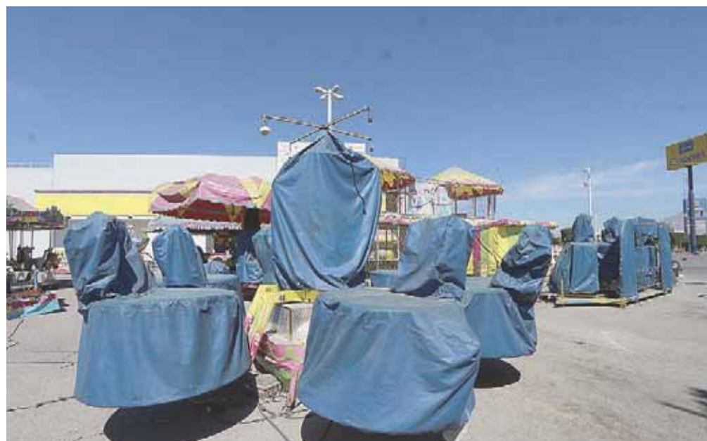
Es casi nula la asistencia de la gente, por lo que no tienen ingresos.