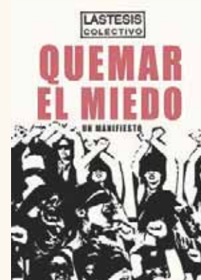
■ El libro está bajo el sello de editorial Planeta.

comencé leyendo el libro con algunos prejuicios inconscientes; sin embargo, conforme me fui adentrando en la lectura fui entendiendo conceptos e ideas de este movimiento, pues textos como este nos demuestran que no son mujeres que simplemente salen a protestar, porque es lo necesario y porque tienen rabia y porque quieren justicia, sino que son mujeres que exigen sus derechos basándose en tesis del feminismo de academia, de importantes pensadoras como Silvia Federici y Rita Segato, entre otras.