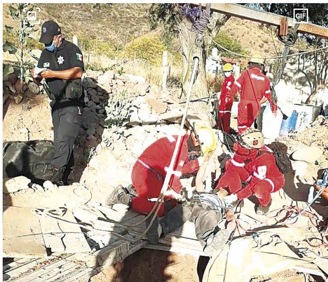
Elementos de Bomberos realizaron las labores de rescate al interior del pozo, salvando al hombre de 50 años de edad, quien presentaba de traumatismo craneoencefálico.

De inmediato, al lugar se trasladaron elementos de la Policía Muni-