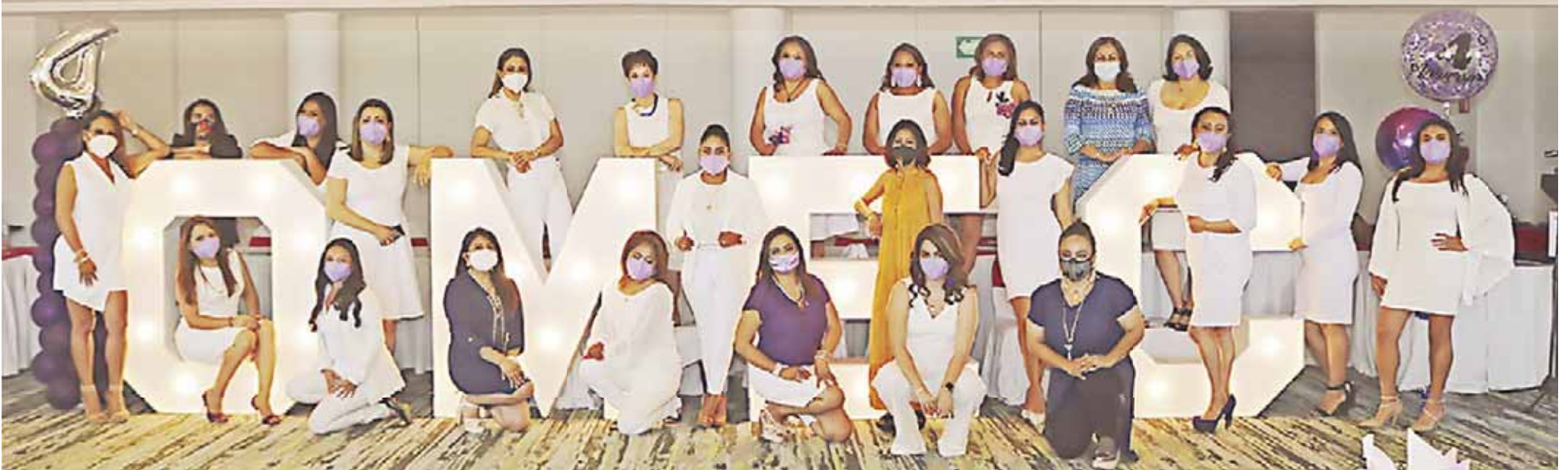
■ Miembros de la Organización de Mujeres Empresarias y Constructoras A.C. se reunieron para celebrar el Día Internacional de la Mujer y su cuarto aniversario.