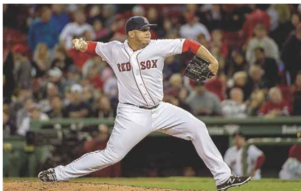
• El pelotero dominicano es confirmado por la tribu.