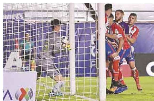
• El árbitro no vio cruzar la bola.

El Atlético de San Luis no logró conseguir los 6 puntos importantes para evitar pagar su multa millonaria.