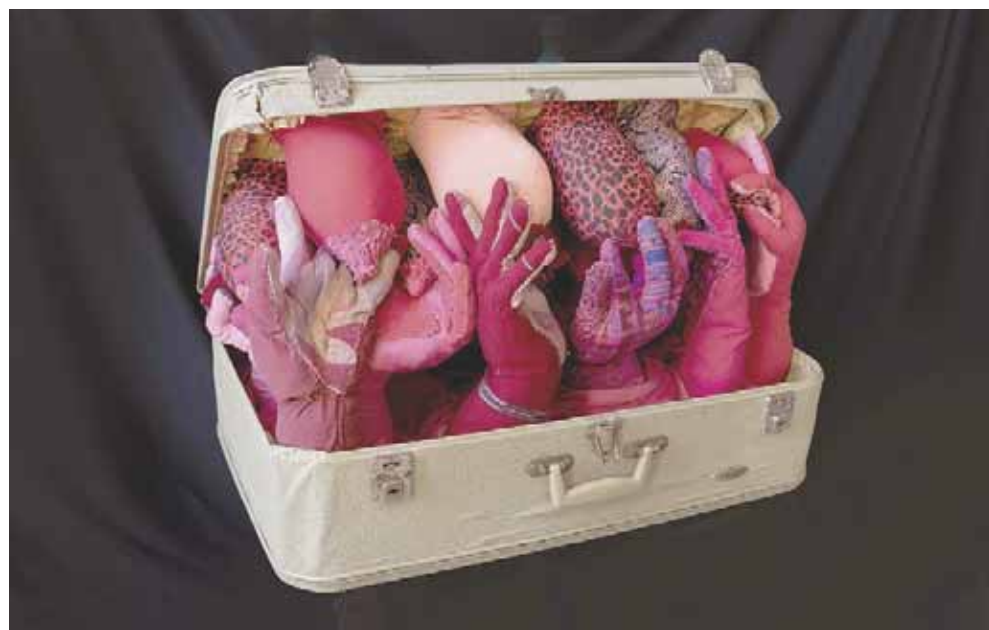
■ Siguiendo la chichi, de Pita Wild C.

El resultado de sus reflexiones, así como la constante en sus obras, serán compartidos en la exposición “El principio para la revolución celeste: solve et coagula”, en el MACO