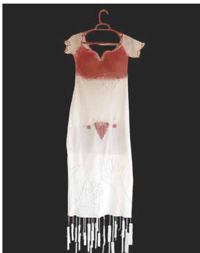
■ Il vestito di tutti i giorni, de Paola Capon.