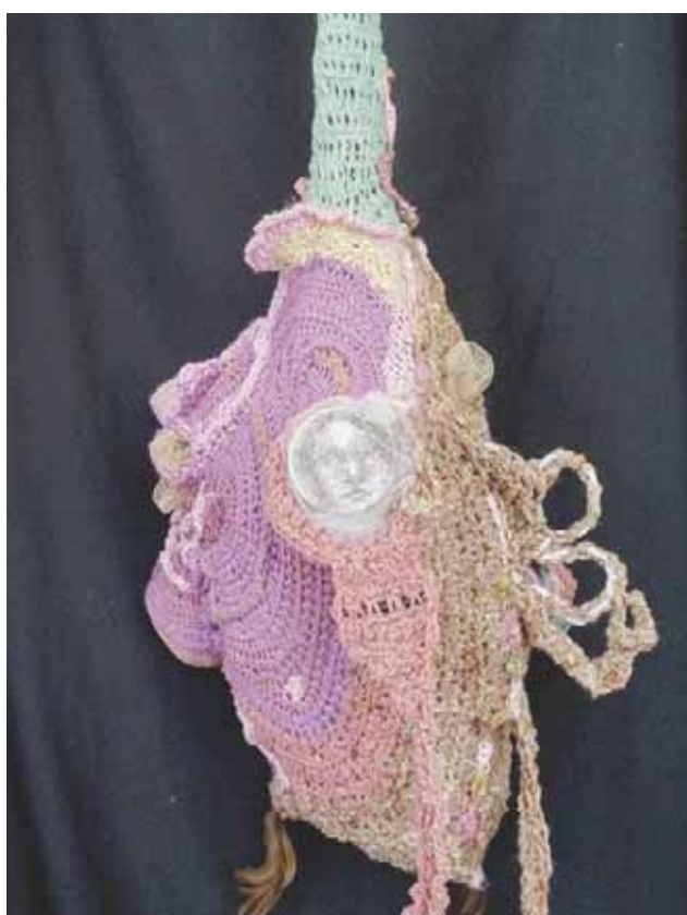
■ Lied (dedicado a mi madre), de Siegrid Wiese.