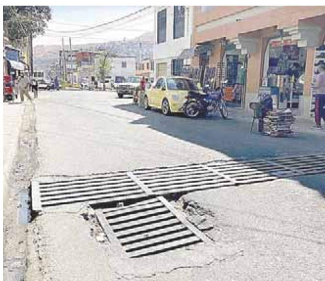
Las alcantarillas empiezan a hundirse.

La Jurisdicción Sanitaria 05 Mixteca ha informado que el 66 % de las defunciones corresponde a hombres y el 34 % a mujeres INFORMACIÓN 3B