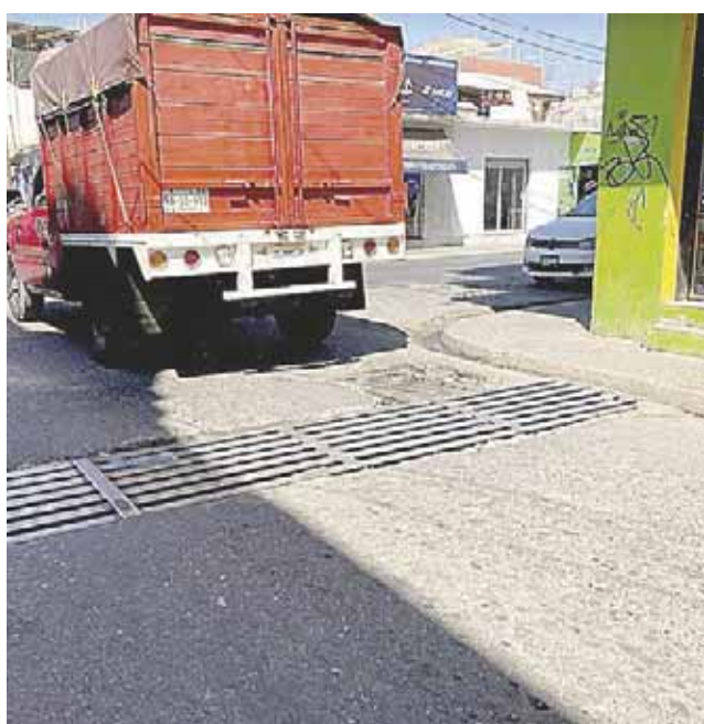
El paso de vehículos pesados ha empeorado la situación.

Finalmente, exhortaron al municipio para que atienda esta problemática, ya que durante la época de lluvia estas se tapan y empiezan a brotar las aguas negras.