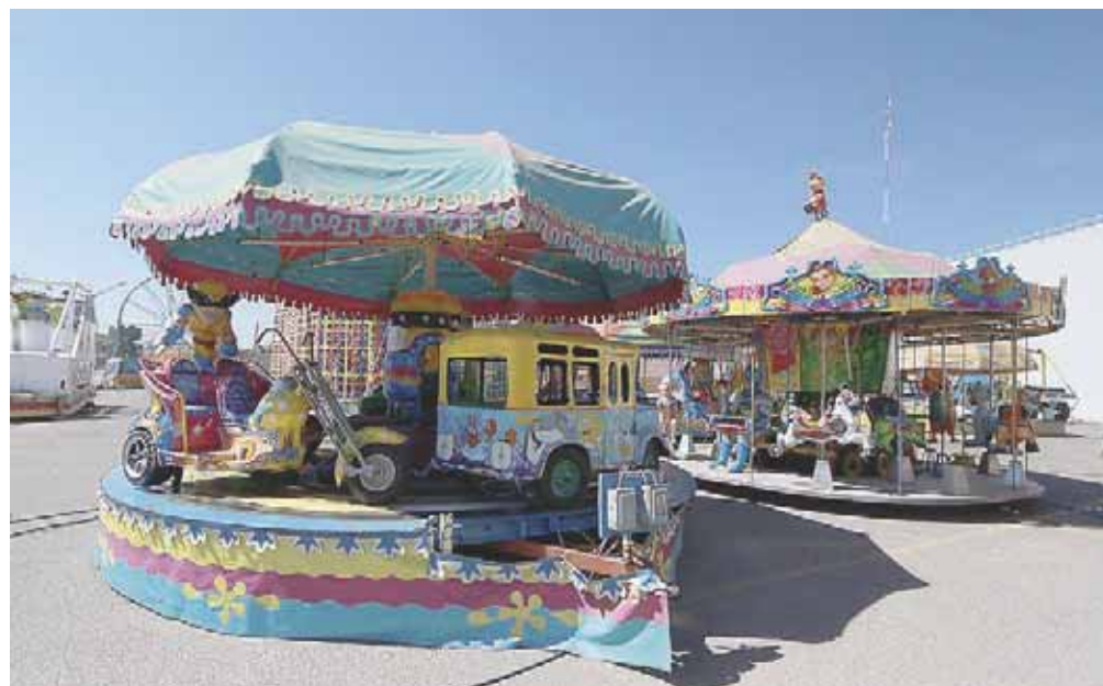
Fueron ubicados en una parte del estacionamiento de Plaza Oaxaca.

Familias dedicadas al negocio de los juegos mecánicos han tenido que vender sus vehículos y dedicarse a otros negocios emergentes; la falta de ingresos también ha mermado a la plantilla laboral