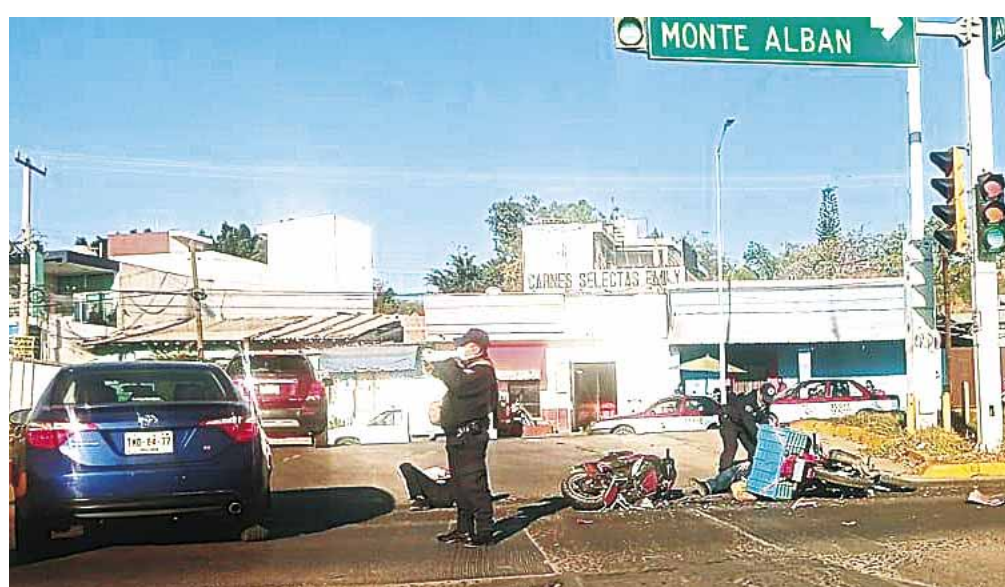
Los motociclistas quedaron derribados en la carpeta asfáltica tras la fuerte colisión.

Al lugar también arribaron elementos de la Policía Vial de Santa Cruz Xoxocotlán para tomar conocimiento en el caso y llevar a cabo las diligencias corres-