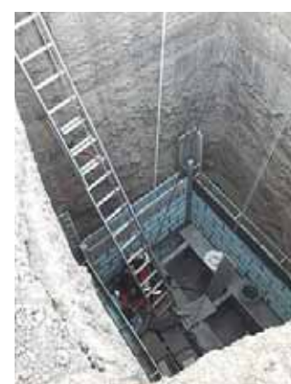
El pozo se ubica en la agencia La Junta, perteneciente a Huajuapan.