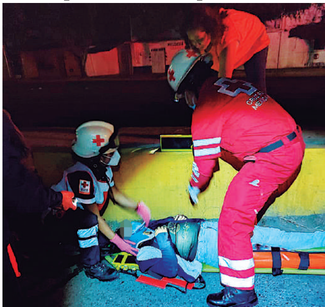
Uno de los repartidores resultó con severas lesiones, tuvo que ser operado de emergencia.

Según fuentes oficiales de la Fiscalía General del Estado de Oaxaca, emitieron un informe sobre el caso de dos motociclistas atropellados por elementos de una patrulla de vialidad, en el que se manifestaba que el caso había culminado con un acuerdo