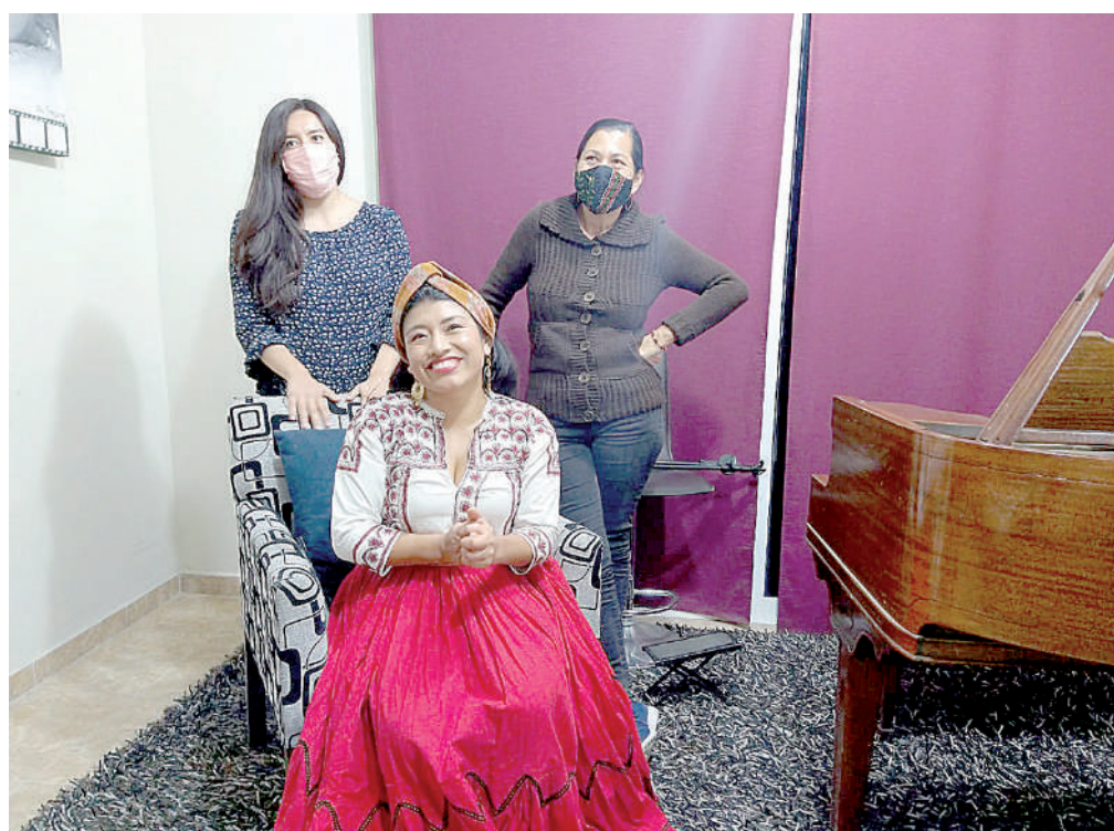
▪ Su serie "Canto a la raíz" se enfoca en la difusión de las 68 lenguas originarias.