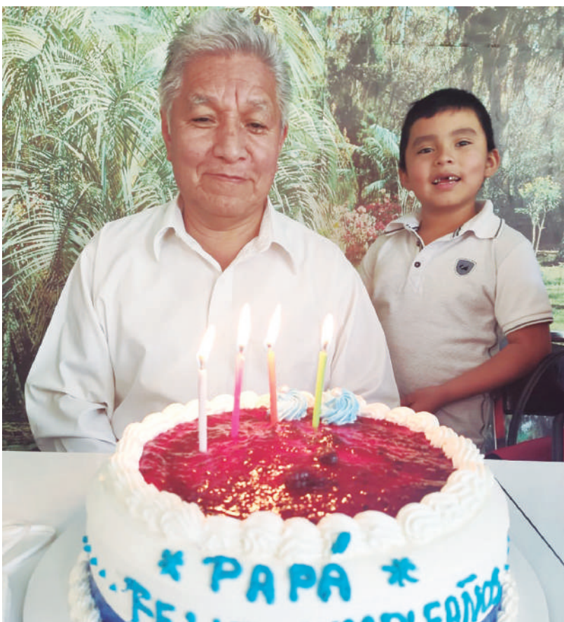
El festejado disfrutó de un día lleno de amor familiar.

En esta celebración no pudieron faltar las felicitaciones y buenos deseos de parte de sus seres queridos, quienes le desearon lo mejor en los años venideros. ¡Felicitaciones!