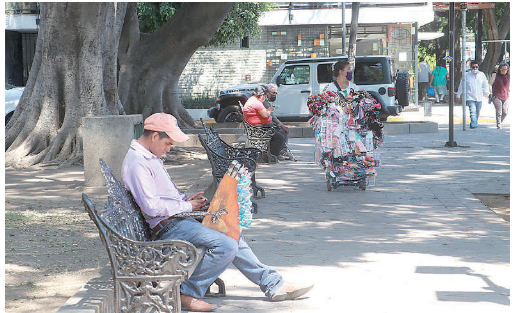
El comercio informal también se ha hecho presente en el jardín.

Asimismo, dijo que en enero se colocaron 50