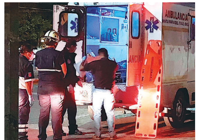
Las diligencias fueron por parte de la FGEO.

Fue a la altura de la Macro Plaza, en donde los