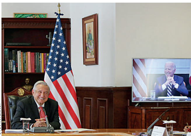
Los presidentes, Andrés Manuel López Obrador y Joe Biden, en la primera reunión virtual.

López Obrador le agradeció el confesar su devoción, pues, dijo, los mexicanos admiran dos símbolos: el de la Virgen y el de Benito Juárez. INFORMACIÓN 12A