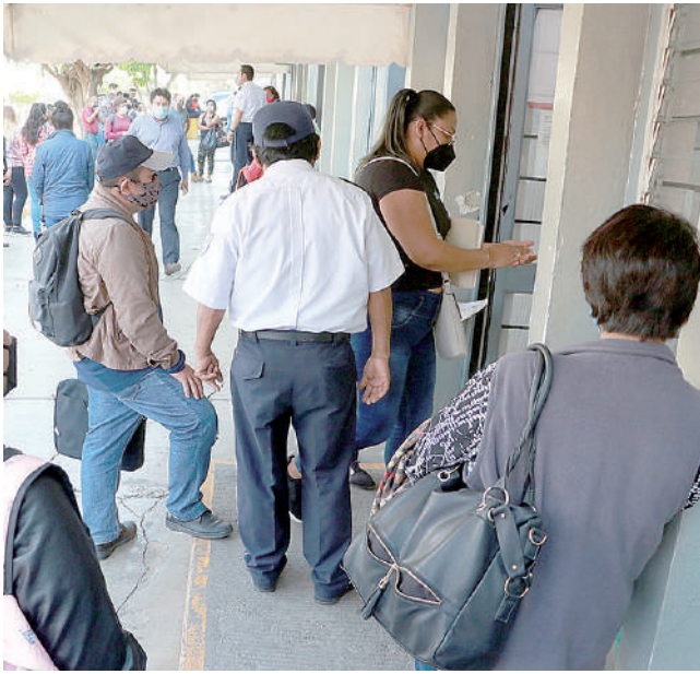
El inicio de atención era a las 08 horas, pero atendieron hasta las 11.