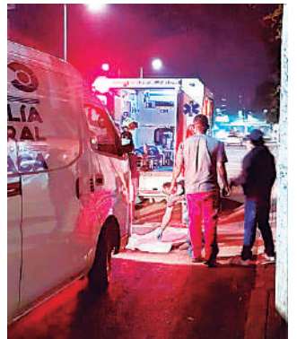
Las investigaciones en el caso continúan

190 la carretera en donde falleció la víctima