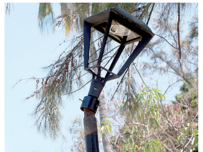
Algunas luminarias ya están fracturadas.

El pasado 23 de enero, un grupo de vecinos impidió la instalación del Tianguis Autogestivo, Feminista y Disidente en este jardín, durante una jornada en la