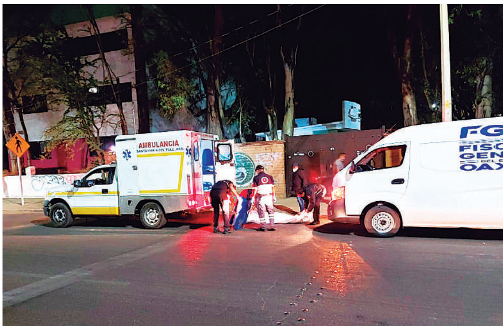
La víctima fue levantada en la Macro Plaza.

los primeros auxilios de los Técnicos en Urgencias Médicas (TUM), lo trasladaron a bordo de su ambu-