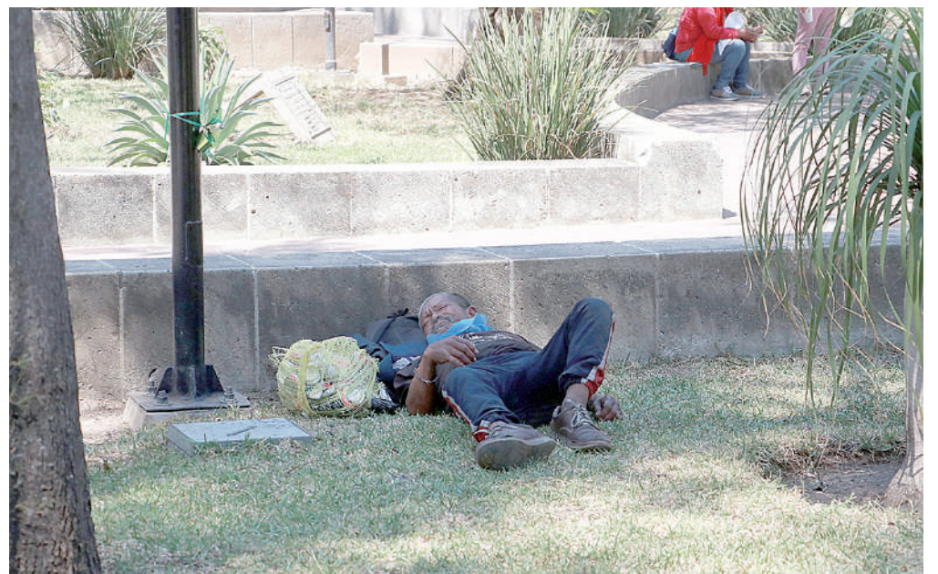
Las personas no cuidan las jardineras ni el pasto de las mismas.

metros cuadrados de pasto. Sin embargo, diversas áreas del jardín lucen sin pasto o con árboles secos y luminarias fracturadas. Un estado similar se observa en la fuente y el monumento dedicado a Cassiano Conzatti, donde la cantera está rota y sucia.