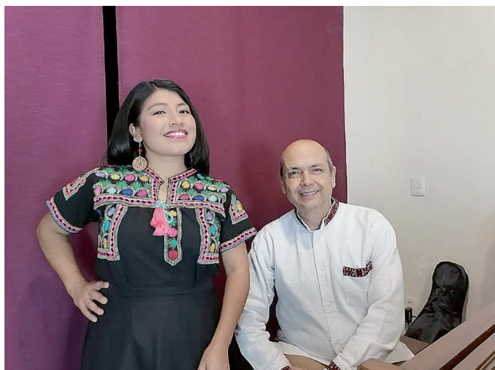
▪ Se ha apoyado en personas que ha conocido a lo largo de su trayectoria.