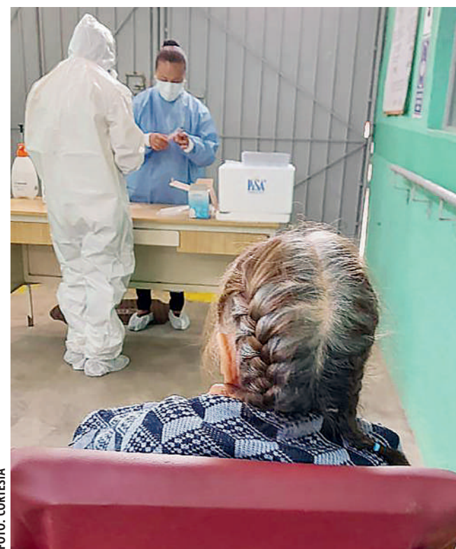
Una brigada de la Unidad de Inteligencia para Emergencias en Salud (UIES) de SSO atiende a los residentes de la Casa Hogar para Adultos Mayores "Santa María".