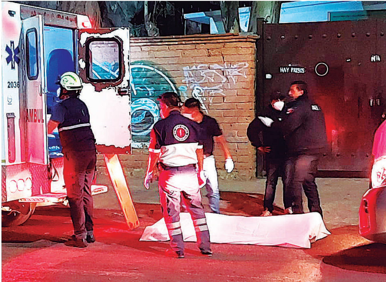
El hombre murió cuando era llevado grave al Hospital Civil.