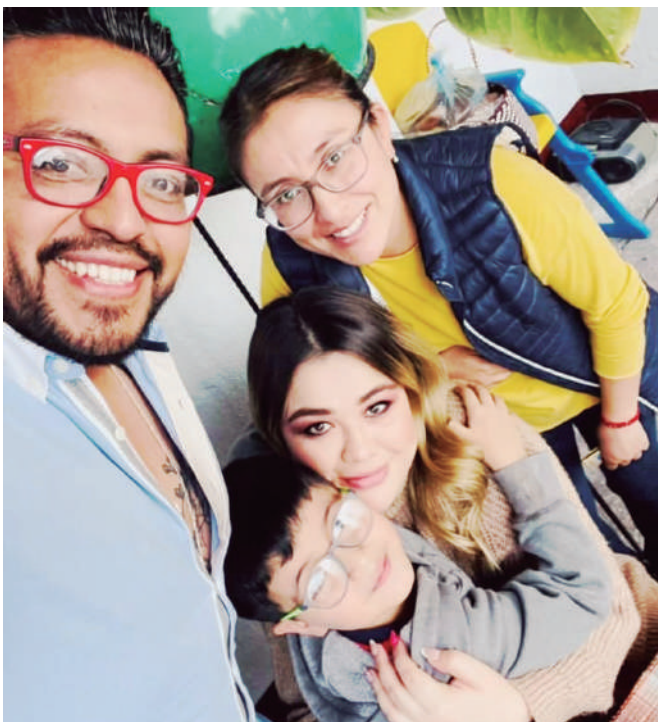
Familiares y amigos de la festejada la rodearon de amor este día.