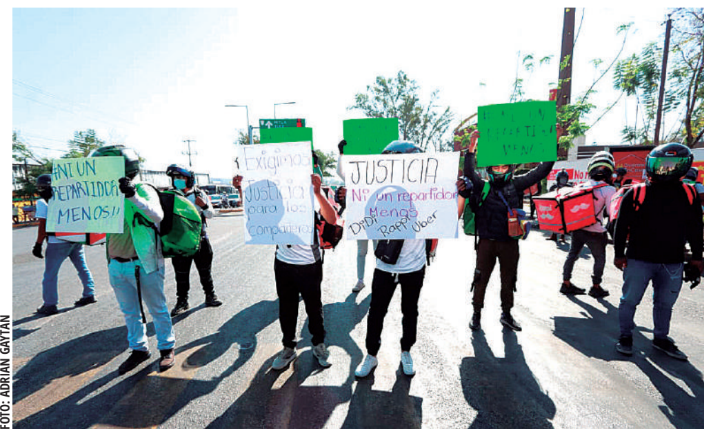
Compañeros de las víctimas se manifestaron cerca del estadio de beisbol.

Además, la institución, destacó que las víctimas fueron atendidas, brindándoles la atención médica necesaria