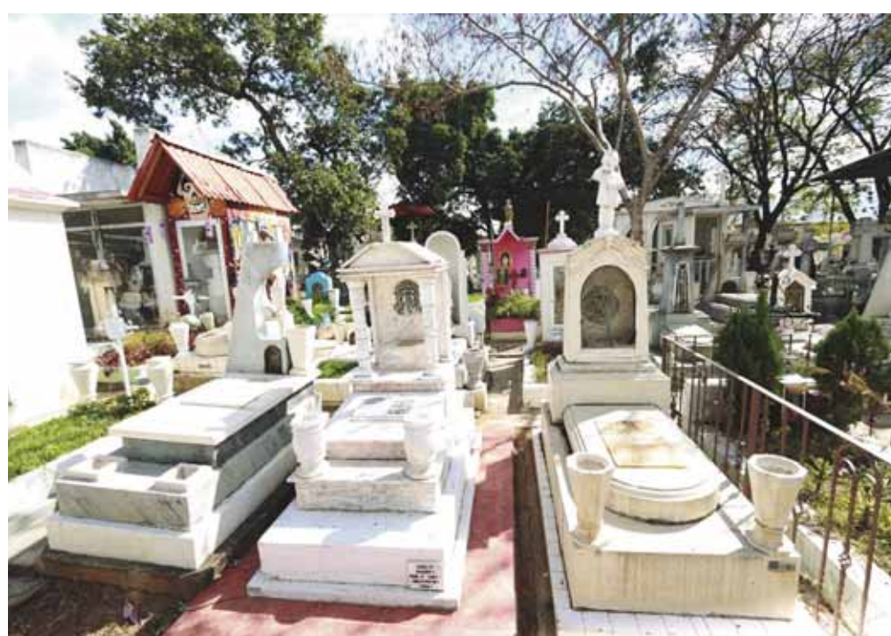
Los cementerios de Oaxaca de Juárez están a su máxima capacidad.