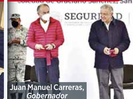
Juan Manuel Carreras, Gobernador

"El escudo protector es como el detente (...) El escudo protector es la honestidad, eso es lo que protege, el no permitir la corrupción (...) detente, enemigo, que el corazón de Jesús está conmigo", dijo el presidente Andrés Manuel López Obrador durante la conferencia matutina del 18 de marzo de 2020.