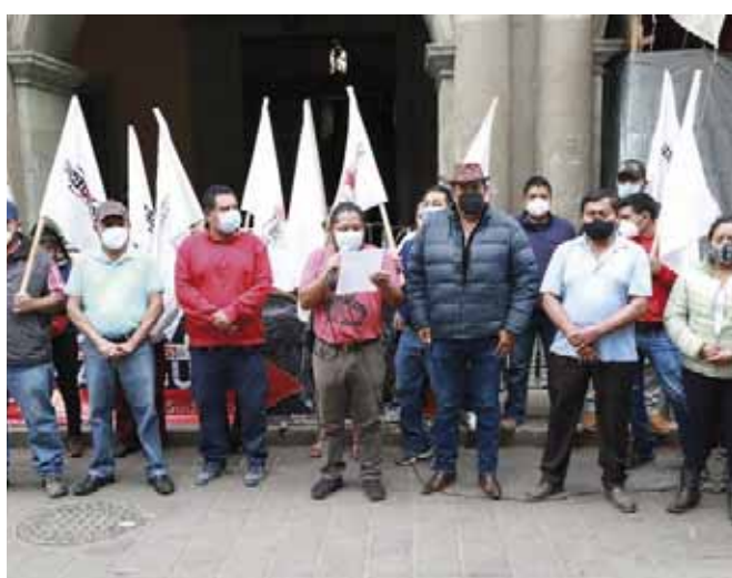
Exigen justicia para las víctimas.