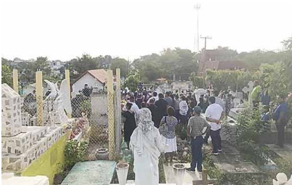
La Fiscalía General investiga con exhaustividad todo hecho violento que atente contra la paz de las familias oaxaqueñas.

El pasado 18 de enero, corporaciones policiacas reportaron el hallazgo de