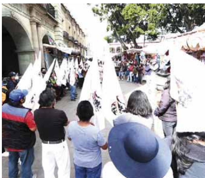
Se cumplieron cinco meses del asesinato del dirigente del FPR.

“La petición de estos vecinos es que el Panteón General, el Jardín, se encuentran a su máxima capacidad. Hay otros panteones que están en las agencias municipales, pero que por usos y costumbres únicamente permiten que se entierren a personas originarias de esas agencias municipales”, explicó.