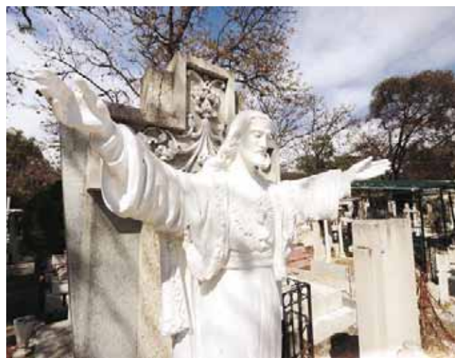
Plantean la posibilidad de construir un nuevo panteón.