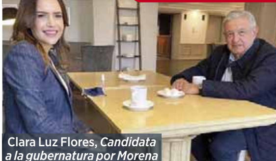
Clara Luz Flores, Candidata a la gubernatura por Morena