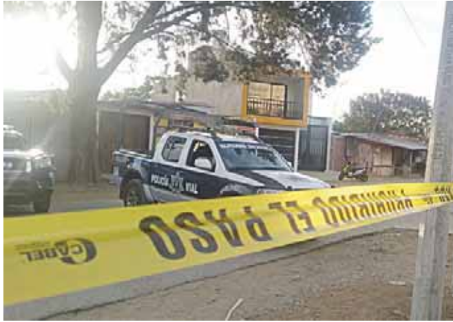
Acordonaron el área al confirmar el fallecimiento del conductor.

tos de haber fallecido a consecuencia de un fuerte golpe en la cabeza.