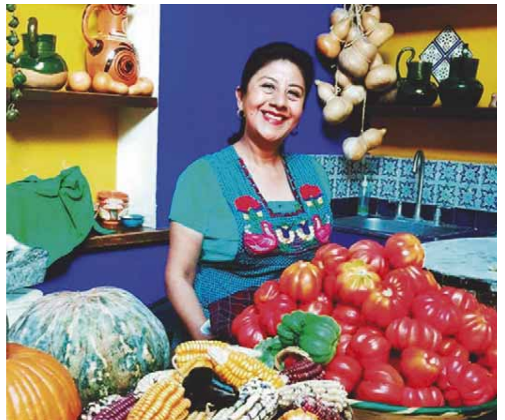
■ Su restaurante Las Quince Letras fue galardonado.