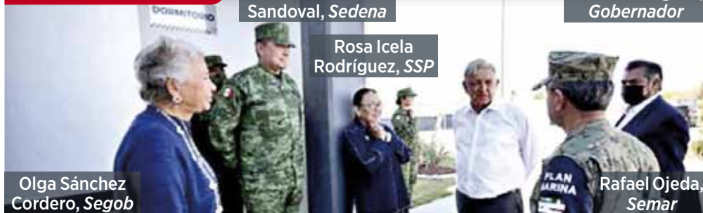
Olga Sánchez Cordero, Segob