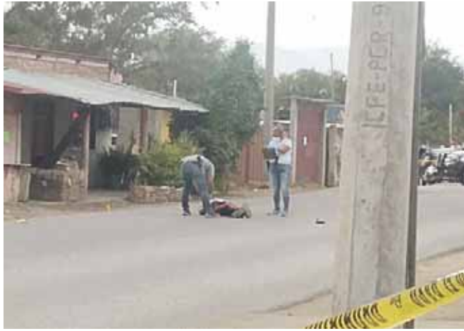
La acompañante del motociclista fue retirada del sitio por su familia.

Cuando los paramédicos revisaron al motociclista éste ya no tenía signos vitales y tenía unos minu-