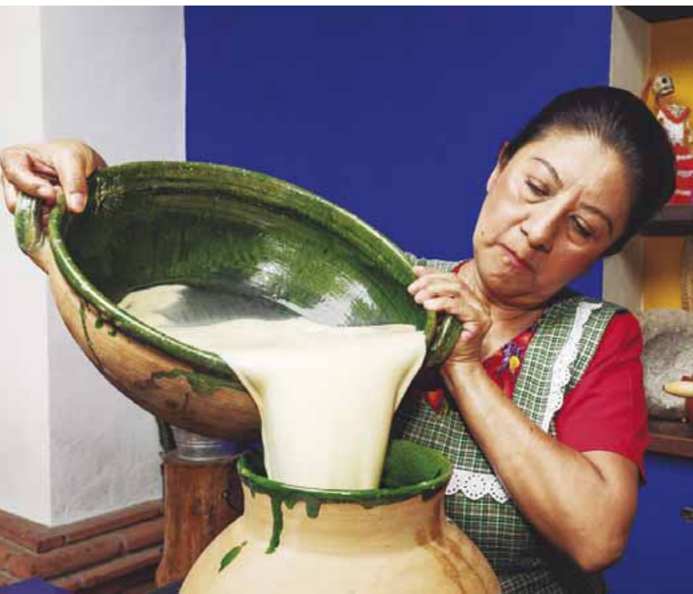
■ El reconocimiento a la cocina artesanal permite volver a las tradiciones y que no se pierdan.