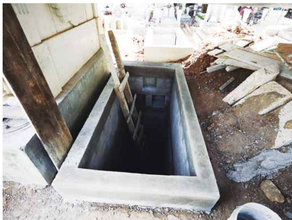
El Ayuntamiento de la ciudad aprobó recuperar fosas en sus cuatro cementerios.