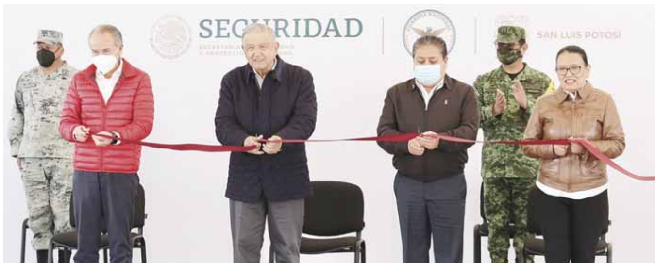
En su gira de trabajo por Nuevo León y San Luis Potosí, el presidente Andrés Manuel López Obrador no usó cubrebocas.

Suspenden el "Encuentro Nudista 2021" en Zipolite