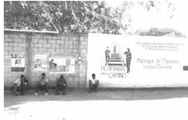
► Se cuenta con espacios aislados en caso de contagios.

De acuerdo con datos del albergue de migrantes "Hermanos en el Camino" que fundó el sacerdote Ale-