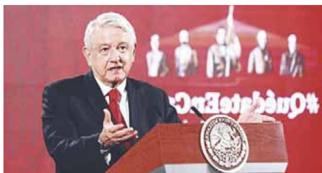
► El mandatario nacional expuso que ya se coincide en la agenda presentada de Biden.

El Presidente aseguró que entre ambos países no habrá enfrentamientos a pesar de que algunas personas “estén apostando” a que esto ocurra, pero dijo que “se van a quedar con las ganas”, apuntó.