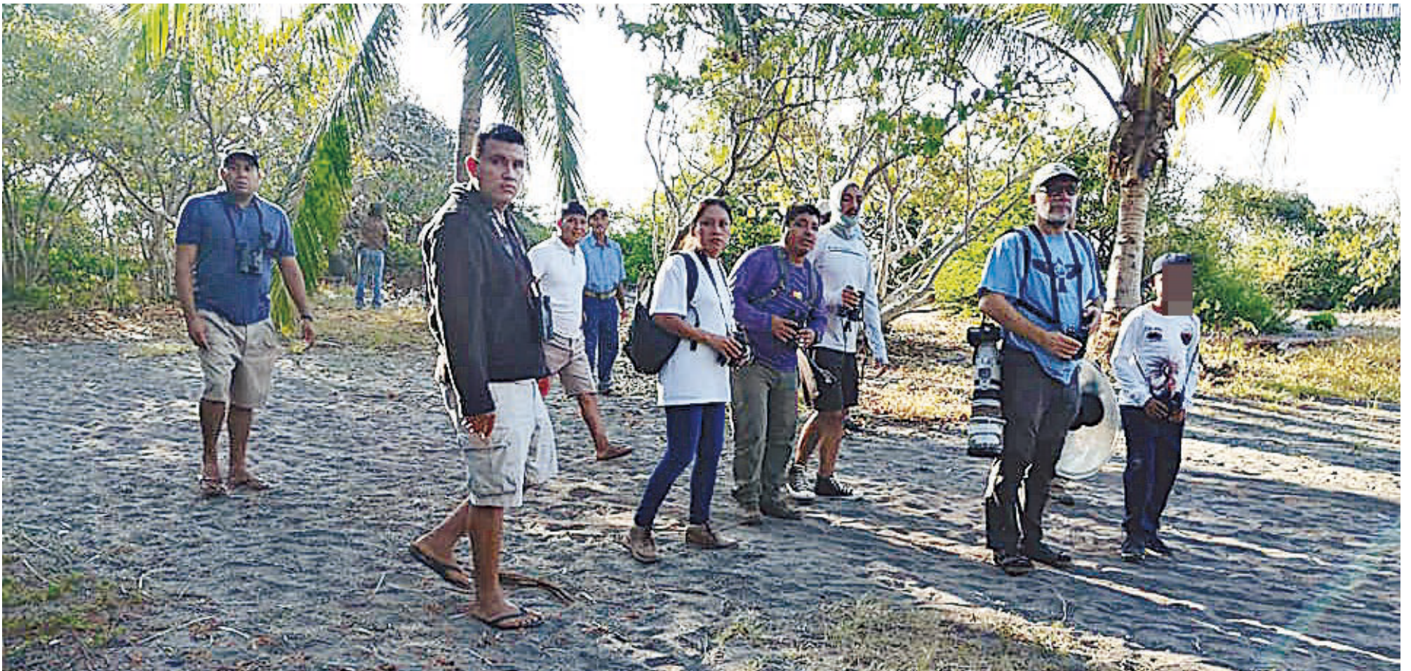
► Se realizan recorridos en donde se explica la importancia de los manglares.

tividad de especies que cruzan o habitan en La Ventanilla, para lo cual se instalarán estaciones de observación, estación de anidamiento e identificar rutas desde el punto de conteo para conocer —a partir del anillamiento— los alcances en el trayecto de las aves, que pueden llegar, entre otros lugares a diversos sitios de Estados Unidos y Canadá.