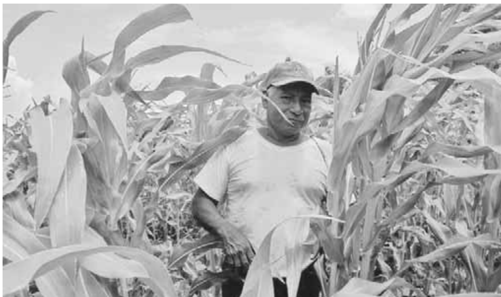
► Se debe fortalecer a los pequeños productores.