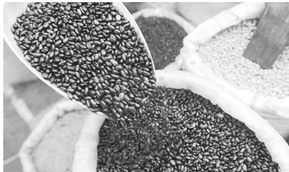
► Subió la producción de granos básicos.

No obstante, no se logra superar el déficit que demanda el mercado interno