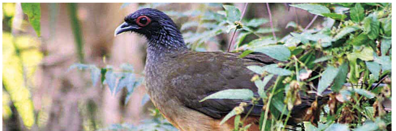
► El aviturismo volverá aún más atractiva la experiencia de visitantes.