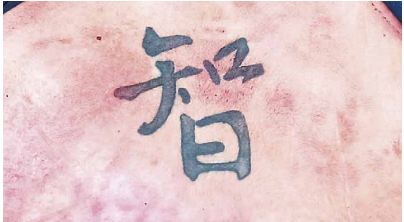
► El cuerpo se encuentra en calidad de desconocido.

Asimismo, las autoridades correspondientes dieron a conocer que esta persona se desempeñaba hasta el momento de su captura como guarura o guardia de seguridad del presidente municipal de Santa María Xadani.