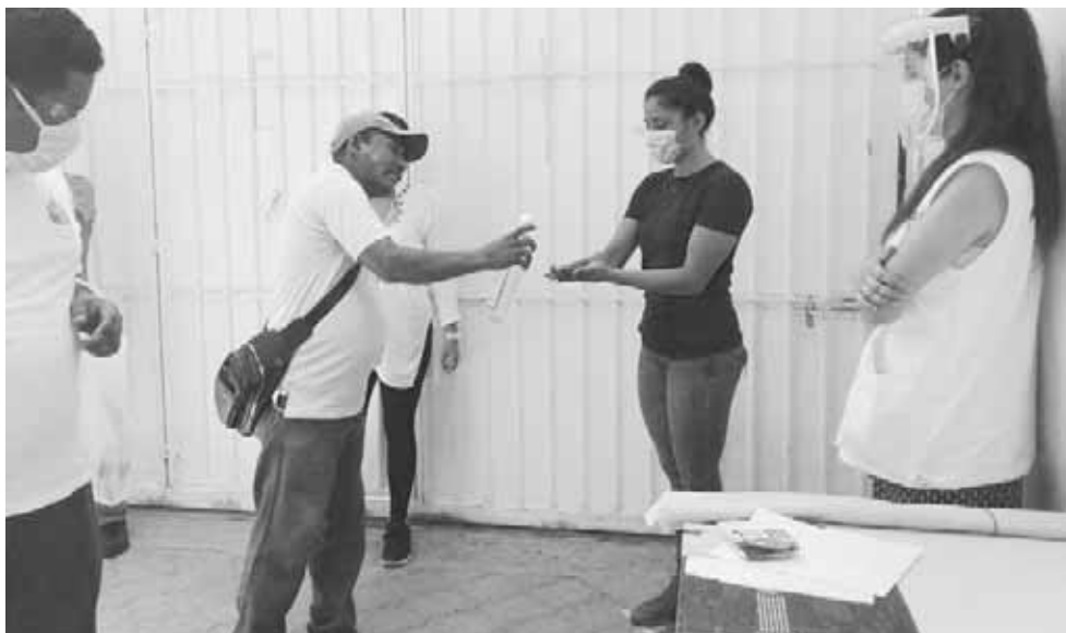
► Antes del ingreso, se lavan las manos y se les toma la temperatura.

La finalidad es que los migrantes convivan en espacios dignos en lo que deciden permanecer refugiados o continuar con su camino hacia el norte, toda vez que la mayoría tiene como destino los Estados Unidos.