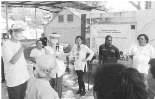
► Los responsables se mantienen en alerta.

canos fueron valorados por un médico del Instituto Nacional de Migración (INM) y los resultados fueron negativos.