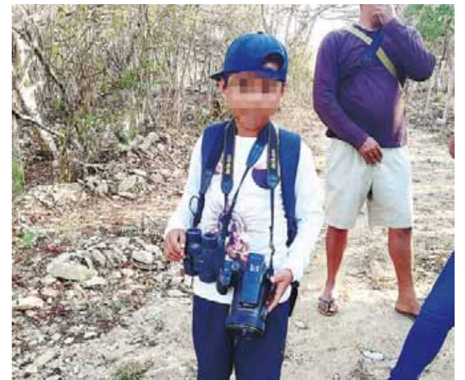
► La cooperativa “Lagarto Real”, impulsa el monitoreo de aves.