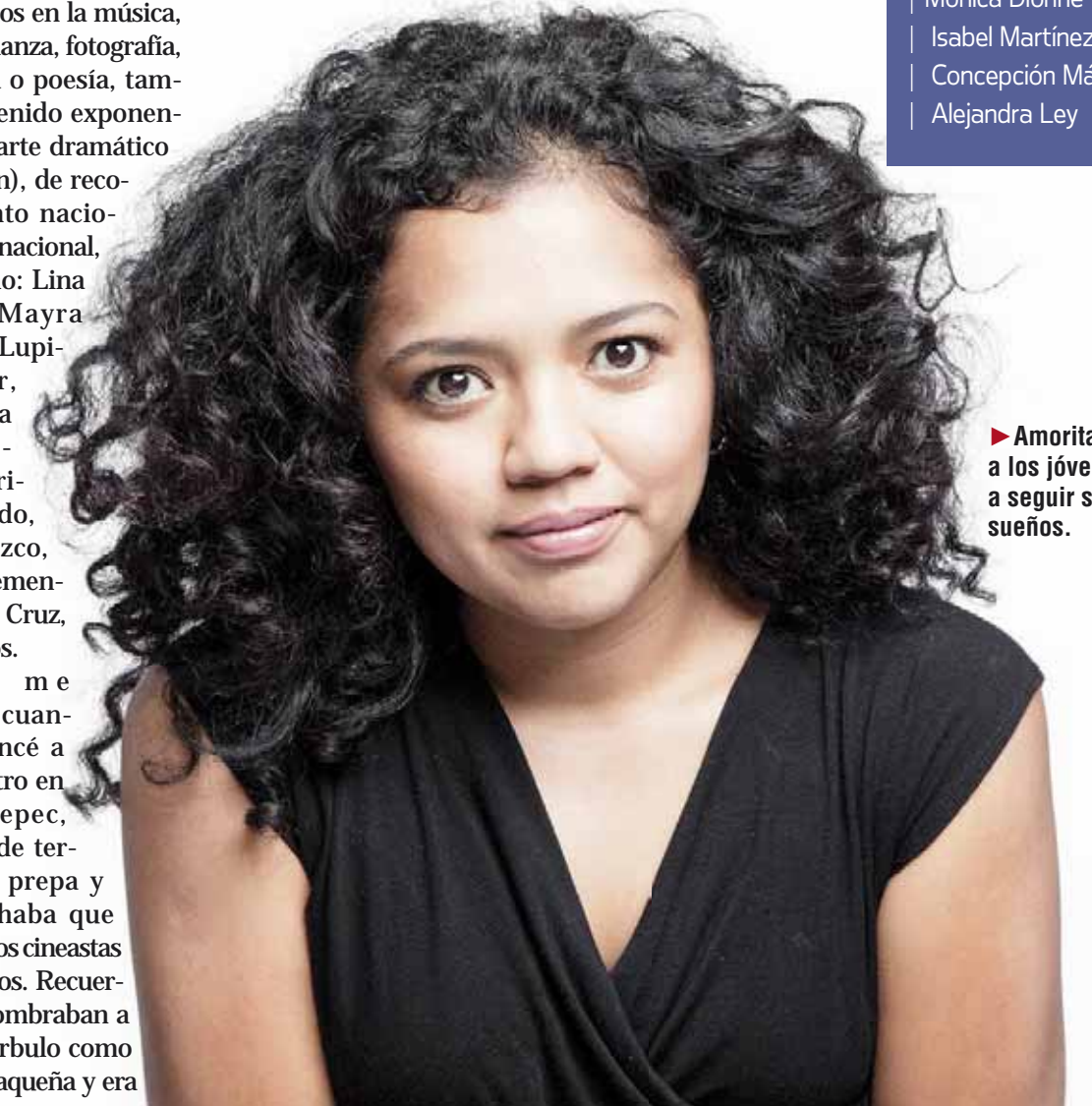
► Amorita invita a los jóvenes a seguir sus sueños.

Destacó que como en todo no ha sido nada fácil, "ha sido difícil porque de repente tú no tienes una guía que te diga esto va a funcionar, que te digan tú