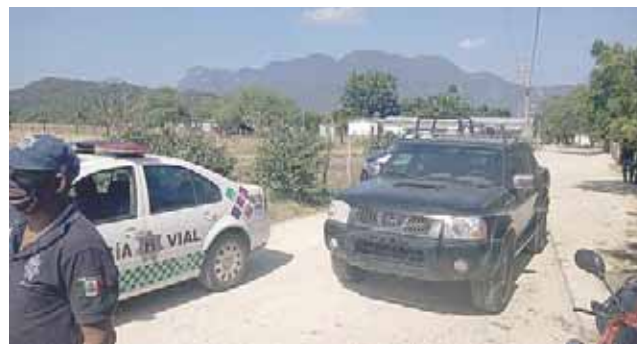
► Fuerzas policíacas arribaron al lugar.

lar debido a la gravedad de sus lesiones.