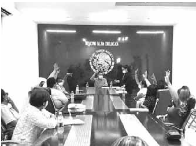
► Dimes y diretes entre funcionarios.