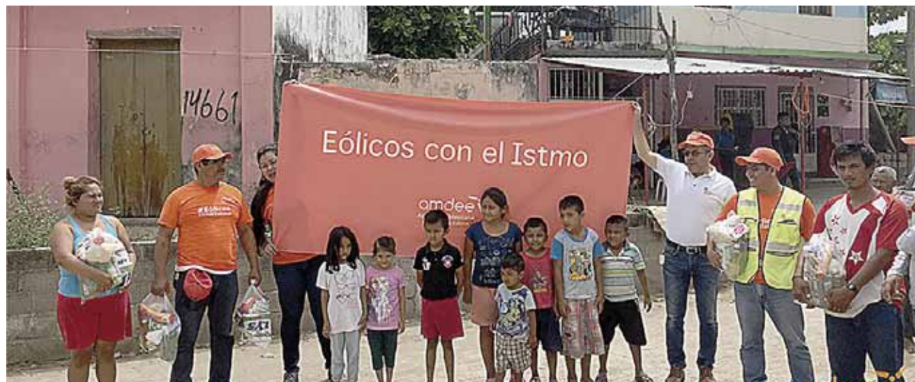
► La AMDEE se suma a la labor social.

Destacó que esto ha tenido un beneficio directo para 130 mil familias de todo el país y ha tenido un alcance en 25 estados.