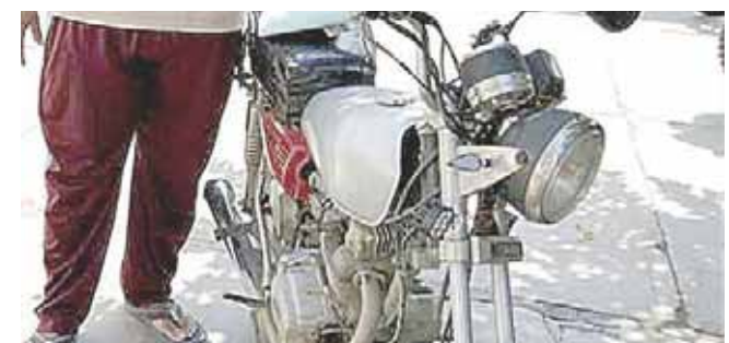
► Fue asegurada.

La unidad de motor es de la marca Italika, modelo 125, de color gris, y tras ser asegurada, quedó a disposición de la autoridad correspondiente.