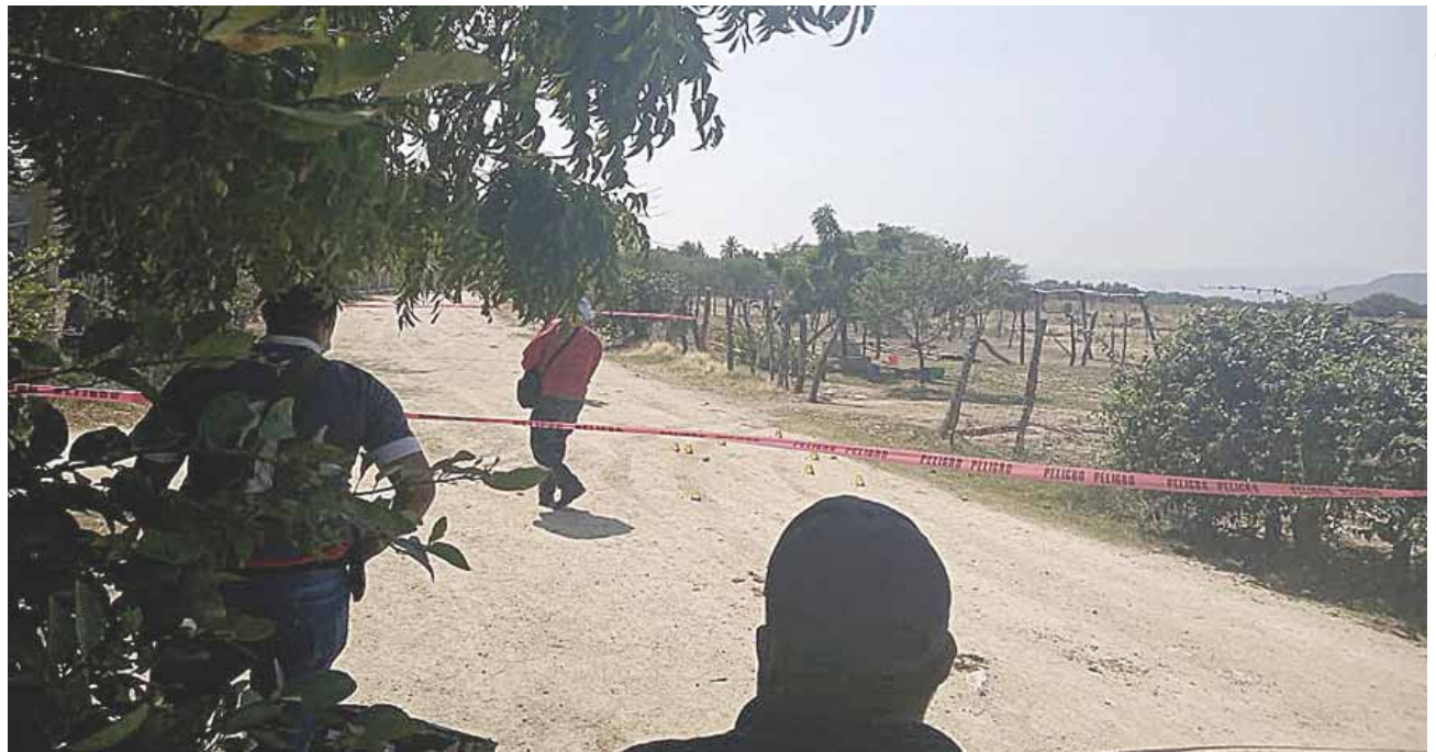
► Por este ataque, elementos de la AEI abrieron una carpeta de investigación.

Debido a la gravedad, el lesionado fue trasladado a un hospital para su valoración médica