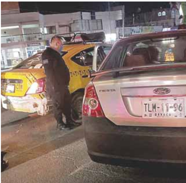
► La unidad particular se impactó en la parte trasera del taxi.

En tanto, será la autoridad correspondiente la encargada de deslindar responsabilidades de este aparatoso accidente, en el que por fortuna no se reportaron personas lesionadas, solo daños materiales cuyo valor se desconoce.