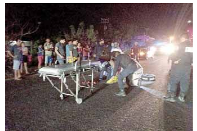
► Paramédicos arribaron al lugar.