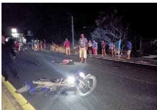
► La motocicleta en la que viajaban.