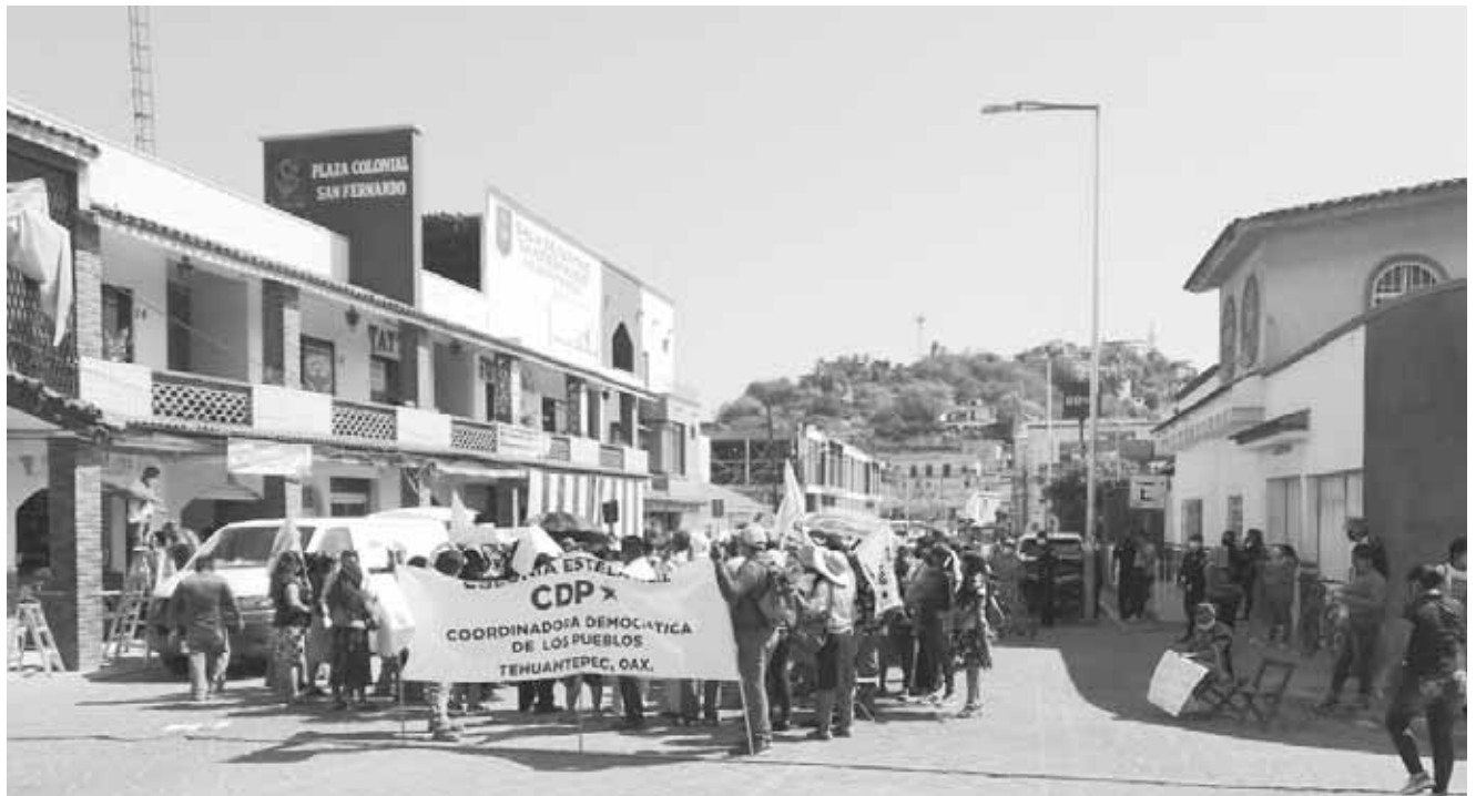
► Denunciaron a la alcaldesa de realizar proselitismo.

Integrantes de la CDP también reclamaron la falta de reconstrucción de sus viviendas