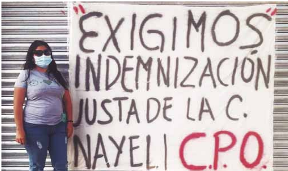
► La afectada buscó apoyo de una organización.