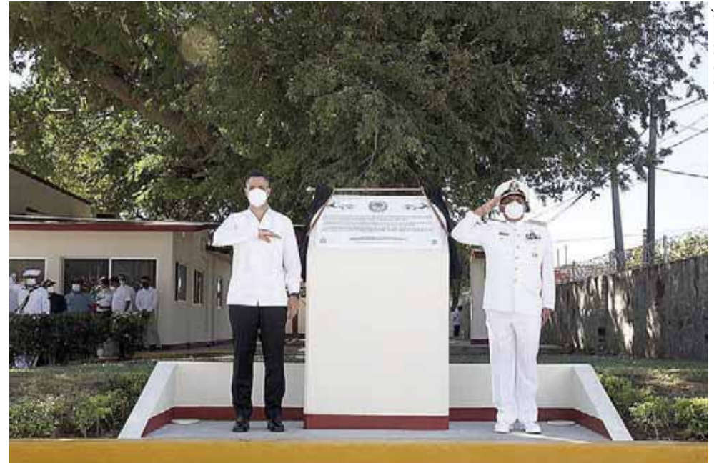
► Se montó una guardia honor a las víctimas que han fallecido por la pandemia.