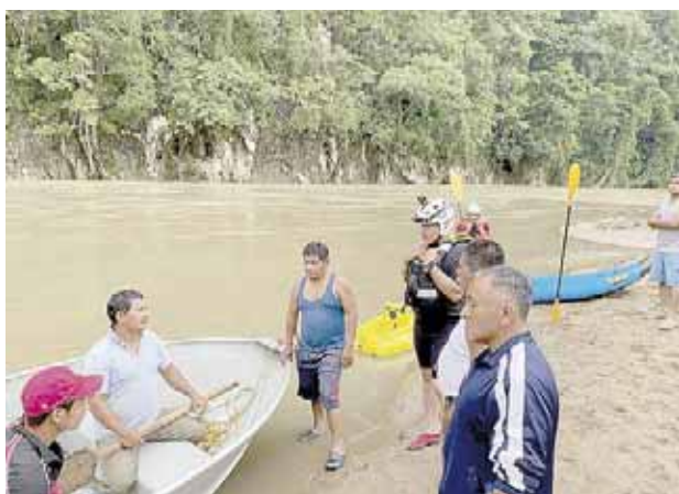
► El accidente ocurrió el sábado pasado.