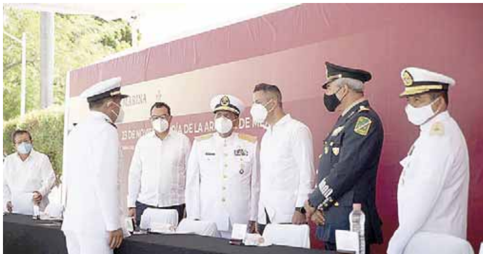
► El mandatario estatal reconoció al personal de salud de esta gran institución que ha dado su vida en esta batalla.