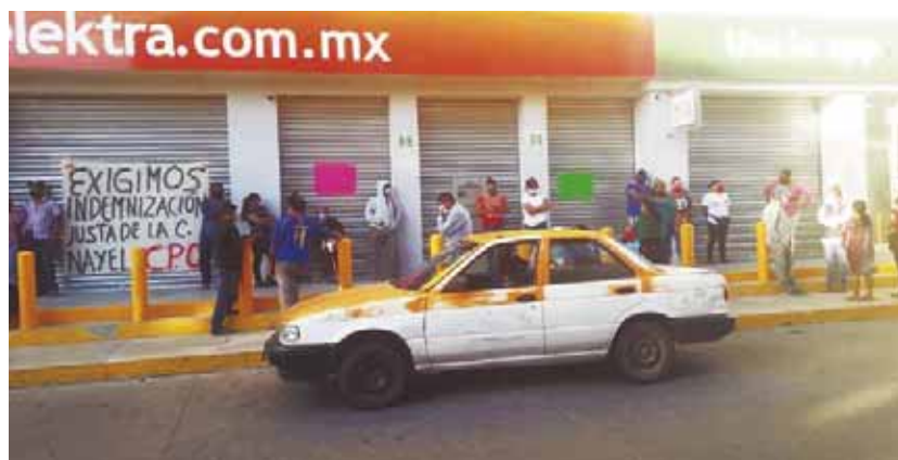
► Aseguran que la manifestación será reiterativa.