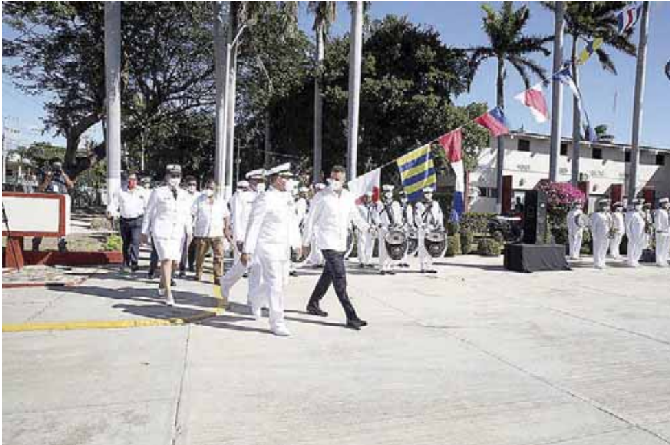
► La ceremonia se realizó en la Explanada Principal del Hospital Naval de Salina Cruz.