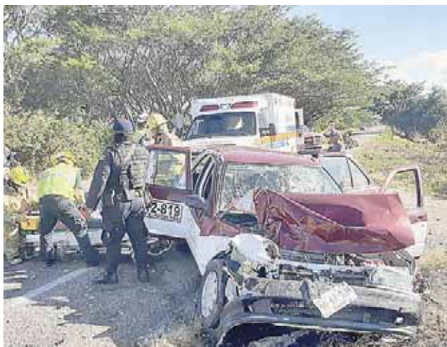
► El percance ocurrió sobre la Carretera Federal 185, tramo Juchitán-Tehuantepec.