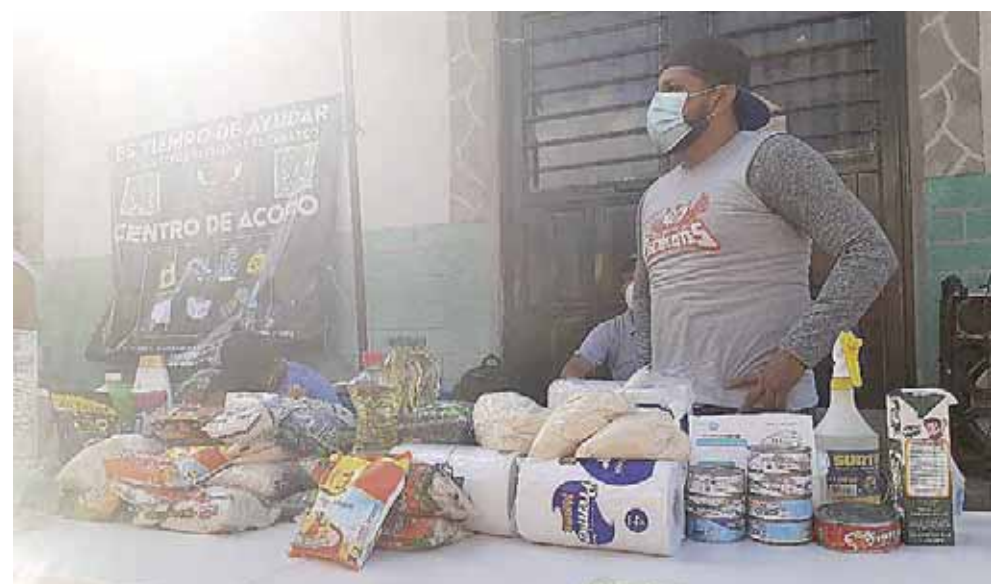
► En Tabasco, las intensas lluvias han inundado una gran zona.