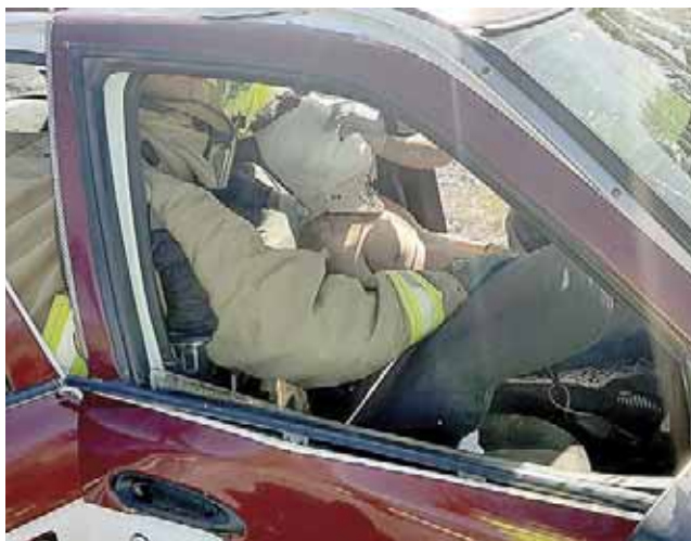
► Se reporta que las unidades chocaron mientras una trataba de ingresar a un camino de terracería.