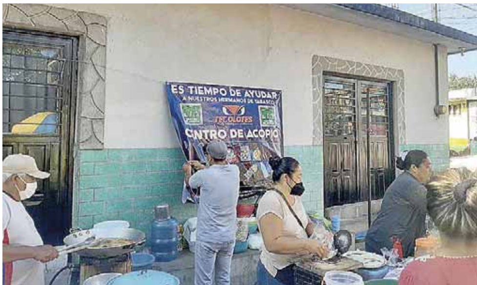
► Lo que se recaude será llevado de manera personal hasta Tabasco.