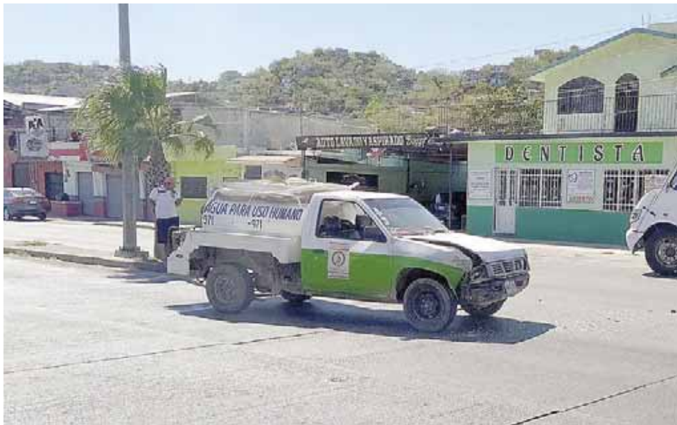
► Una camioneta acondicionada como pipa se impactó con un vehículo Vento.