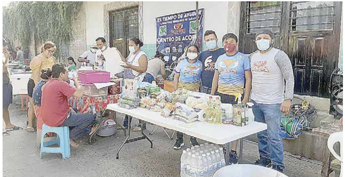
► Cuando los istmeños sufrieron el terremoto del 7 de septiembre de 2017, los tabasqueños se solidarizaron con los juchitecos.

“Lo que nosotros estamos realizando solo es corresponder a esa ayuda y demostrar que los oaxaqueños, los istme-