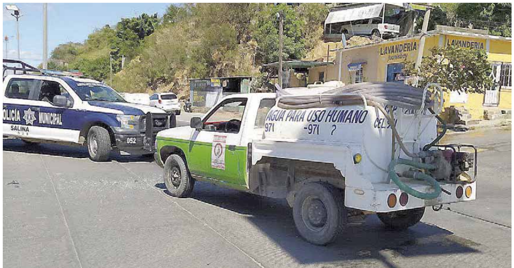
► Los dos vehículos quedaron atravesados invadiendo los dos carriles del bulevar.

Una camioneta acondicionada como pipa de agua con placas de circulación RW-80-317 del estado se impactó con un vehículo modelo Vento de la Volkswagen en color rojo con