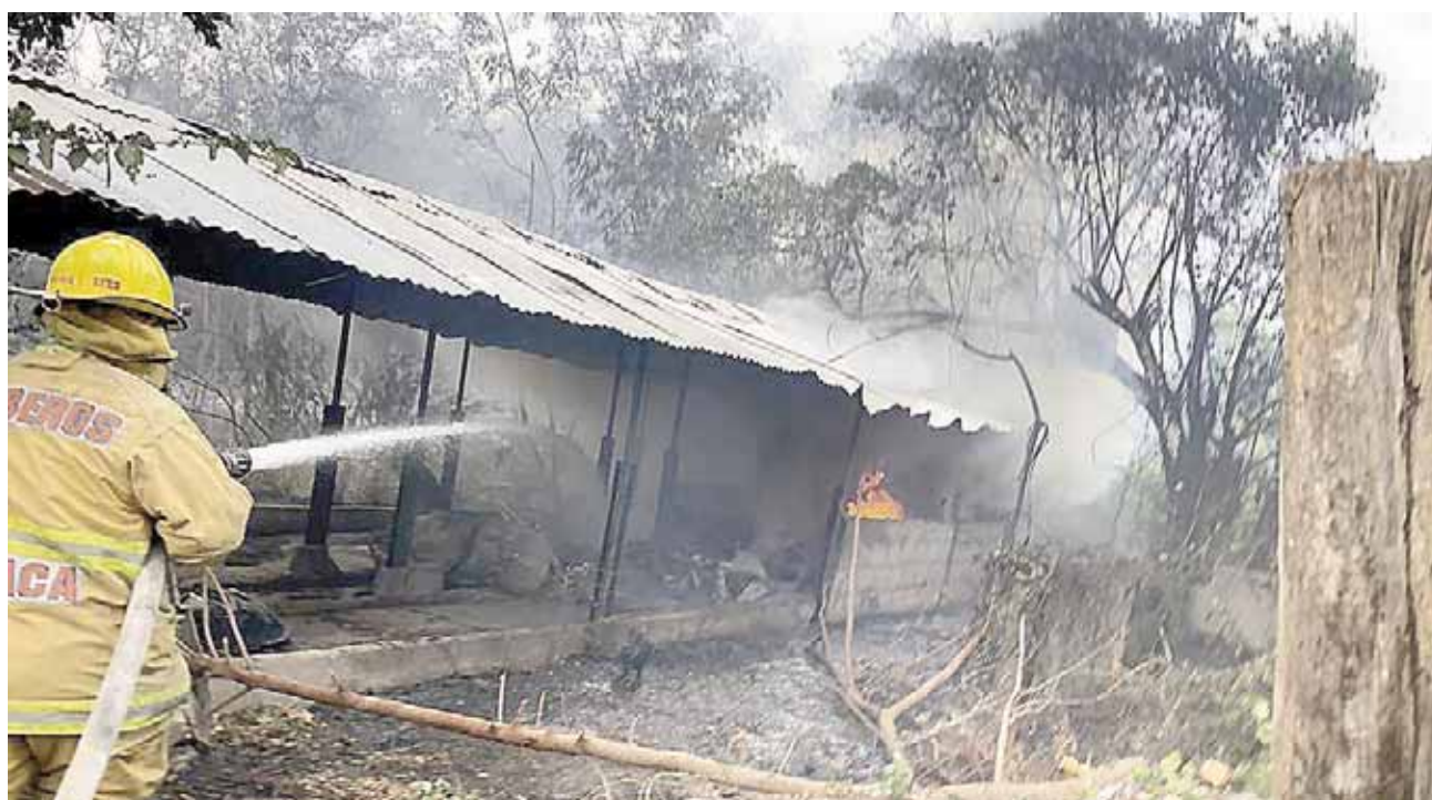
► Las llamas alcanzaron a consumir una galera llena de postes.

Habitantes de la unidad habitacional Las Palmas reportaron el incendio de un terreno baldío que crecía fuera de control