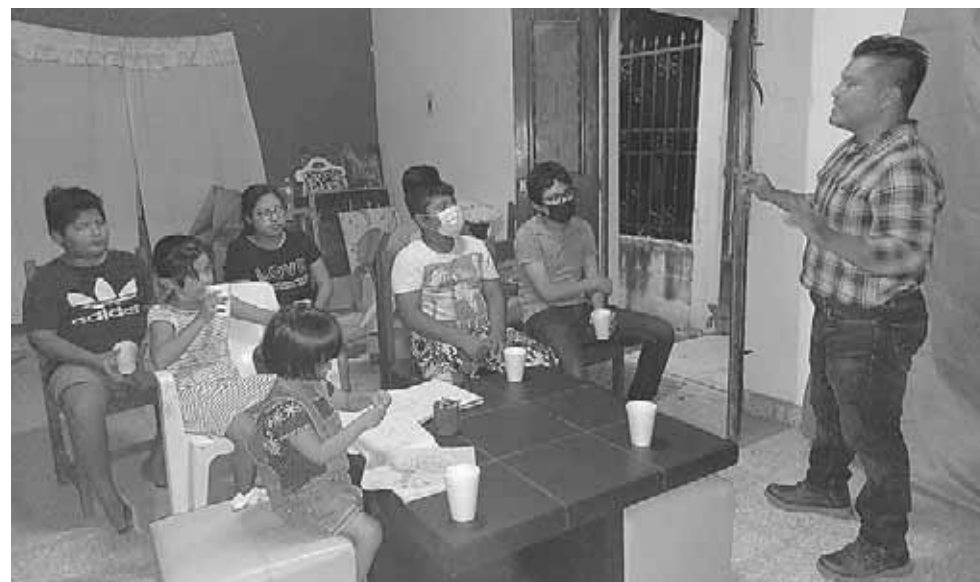
► Desde hace varios años han venido trabajando en el apoyo legal, jurídico y contable a la población.

están realizando algunas brigadas médicas para poder ayudar a la ciudadanía en este tema de salud, sobre todo en esta época en que se requiere por la cri-