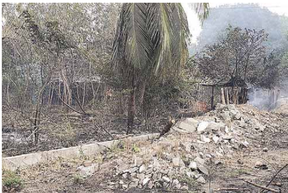
► El Cuerpo de Bomberos logró controlar el incendio.

pipa, en ese momento el fuego ya había logrado alcanzar unos postes que se encontraban en el interior de una galera la cual también ardía en llamas.