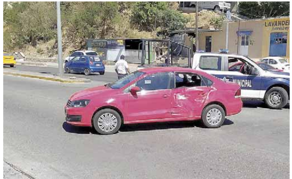
► Al lugar arribaron policías municipales quienes abanderaron el área.