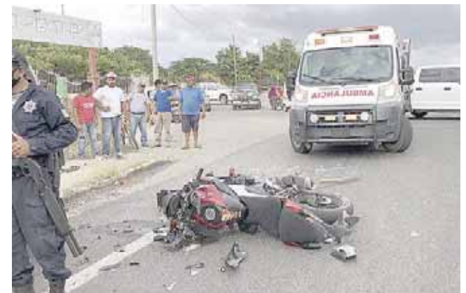
► El pasajero del mototaxi murió cuando recibía atención en el hospital Macedonio Benítez.

Por esta situación, el caso se ha turnado ante el Ministerio Público de esta ciudad por el delito de homicidio por tránsito de vehículo en contra de quién o quienes resulten responsables.