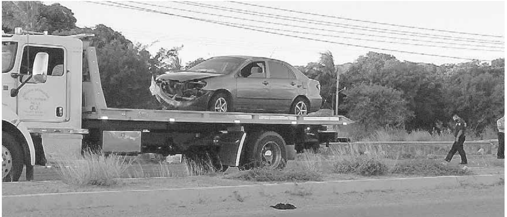
► A pesar de lo aparatoso del accidente no se reportaron personas lesionadas, solo cuantiosos daños materiales.

elementos de la Guardia Nacional, cuadrante caminos, quienes tomaron datos de lo sucedido ordenando que el automóvil fuera retirado del lugar con una grúa quedando a disposición de la autoridad correspondiente quién será la encargada de deslindar responsabilidades de este aparatoso choque.