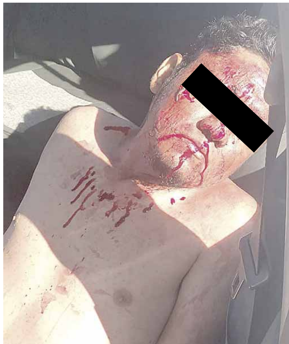
► El Heroico Cuerpo de Bomberos realizó la extracción del taxista para llevarlo al hospital más cercano.