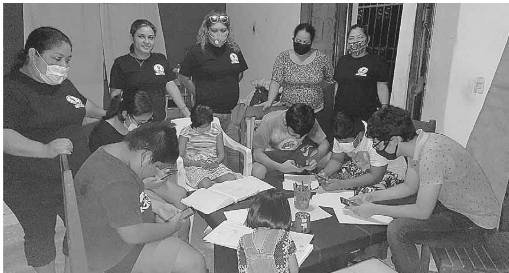
► Pusieron el servicio de Internet a disposición de los infantes que requieren tomar clases virtuales.

“Hemos contratado el servicio de internet en nuestras oficinas que se encuentran sobre la calle Ferrocarril entre Morelos y Álvaro Obregón, de Juchitán, en donde los niños pueden llegar les damos el acceso al servicio de internet para que reciban sus clases, además vamos a comprar una impresora para poder apoyarles ya que nos hemos dado cuenta que también les piden