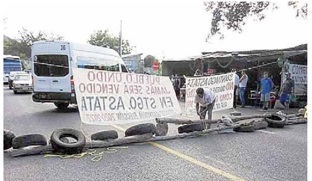
► Estos dos presidentes municipales dirigen comunidades de la zona Chontal.

Estos dos presidentes municipales dirigen comunidades de la zona Chontal en donde sus habitantes los han cuestionado por mala administración de los recursos públicos para aplicarlos en obras sociales.