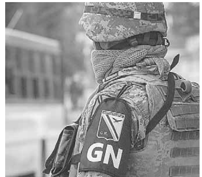
► Elementos de la Guardia Nacional tomaron datos de lo sucedido.