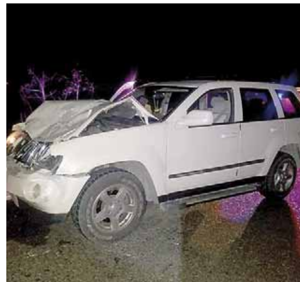
► Solo hubo daños materiales.

También fueron notificados elementos de la Guardia Nacional para que tomaran conocimiento y se hicieran cargo de este accidente ocurrido sobre la Carretera Federal 185.