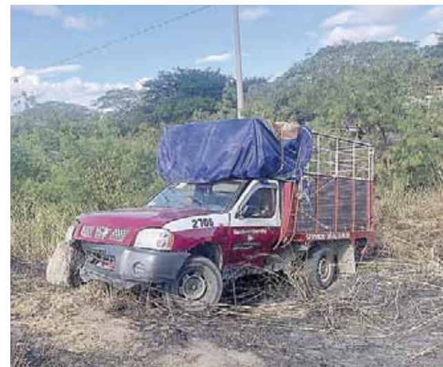
► La camioneta de alquiler quedó fuera del camino.

Un taxi y una camioneta protagonizaron un terrible accidente cerca del paraje Pepe y Lolita sobre la vía Juchitán-Tehuantepec