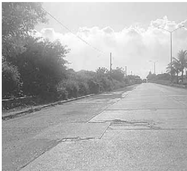
► El choque ocurrió sobre la calzada a la Refinería en Salina Cruz.

Cabe resaltar que a pesar de lo aparatoso del accidente no se reportaron personas lesionadas solo cuantiosos daños materiales cuyo valor se desconoce.