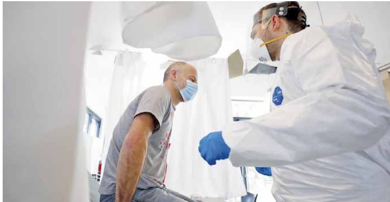
► Alertan sobre aumento en hospitalizaciones.

A pesar de los diez meses transcurridos des-