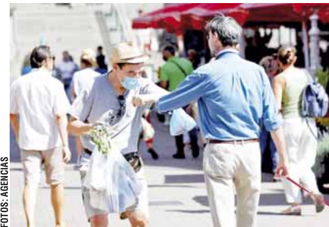
► Exhortan a acatar las recomendaciones.

A los responsables de la Sanidad, el representante de la OMS les dijo también que si en marzo pasado la preocupación se centraba en la disponibilidad de las unidades de cuida-