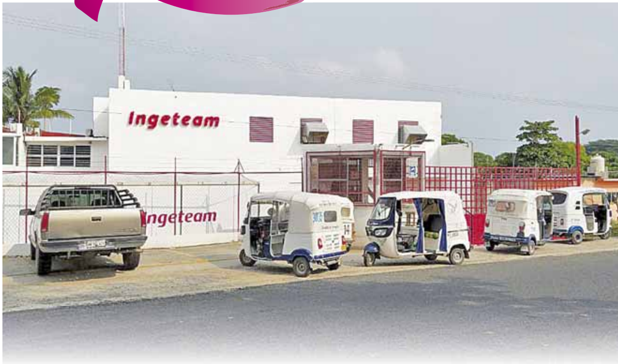
EXHIBEN A EMPRESA INGETEAM