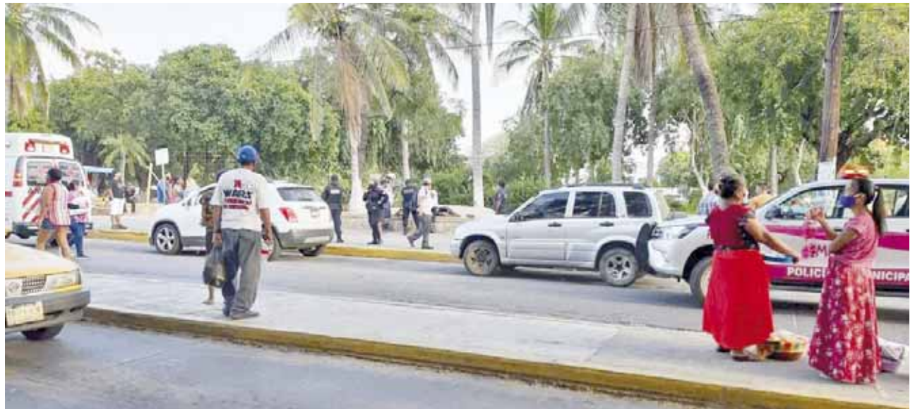
► De inmediato, transeúntes dieron aviso al 911.