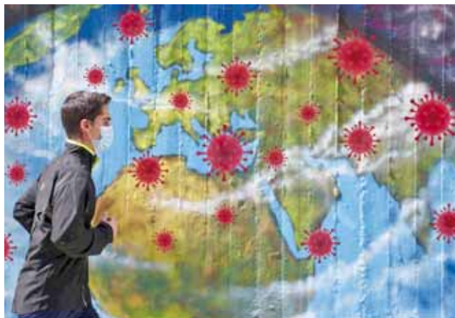
► El virus vuelve con más fuerza.

de que se detectó el coronavirus, el director de la OMS para Europa dijo que los sistemas de diagnóstico no están siendo capaces de seguir el paso en un contexto de transmisión del coronavirus a gran velocidad.