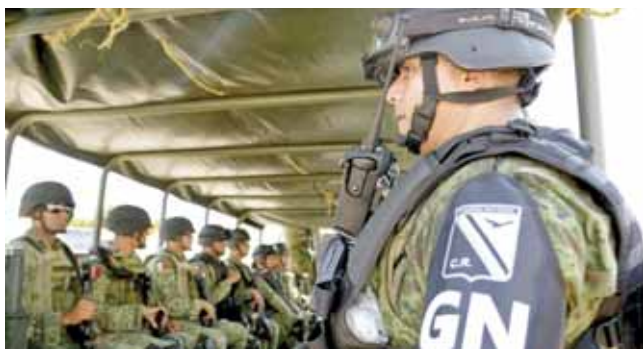
► La Guardia Nacional participó en la detención.

Cerca de las 14:00 horas, los uniformados se dirigieron a varios domicilios con la respectiva orden de cateo en donde detuvieron a un hombre y una mujer, mismos que fueron trasladados al penal de alta seguridad de Taniwet, Tlacolula de Matamoros custodiados por patrullas, acción que causó gran consternación en los pobladores.