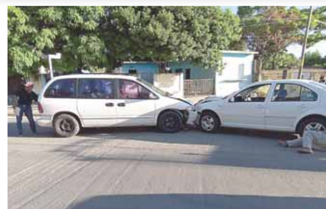
► Cuantiosos daños materiales.