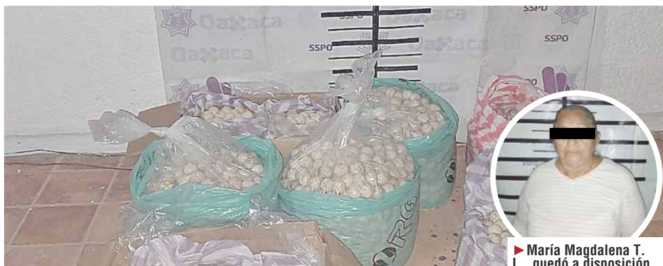
► La mercancía fue asegurada.