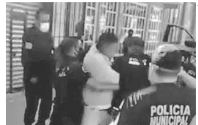
► Este hecho desató críticas.

En abril de este año, luego de que el gobierno de Oaxaca emitiera un decreto sobre el uso obligatorio del cubrebocas en espacios públicos, el Juzgado Decimoprimer de Oaxaca suspendió el decreto por el que se imponían multas y cárcel a quienes no siguieran la medida. Esto, a raíz del juicio de amparo interpuesto por el Comité de Defensa Inte-