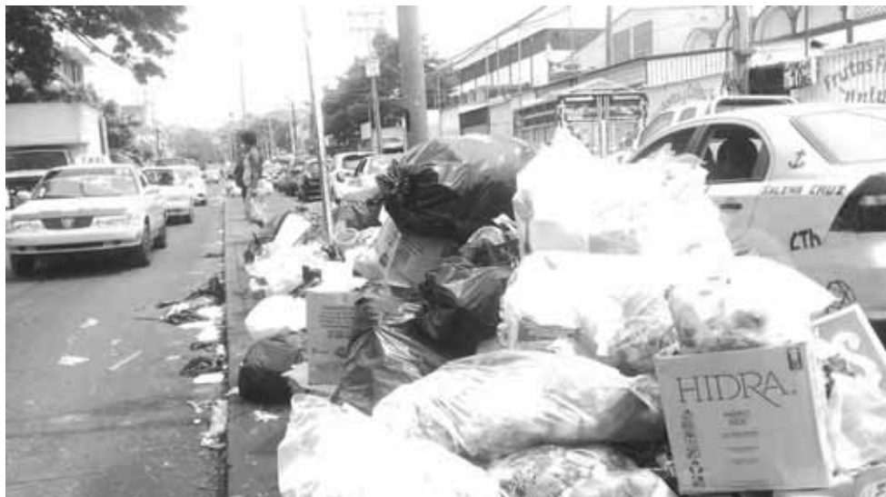
► Los camellones convertidos en basureros.