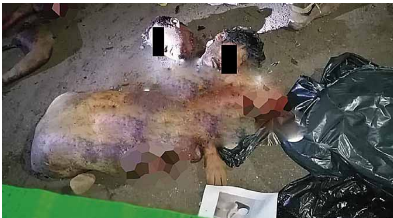
► Hasta el momento, los cuerpos no han sido identificados de manera oficial.