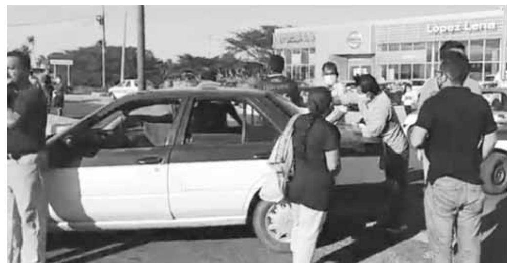
► La protesta se realizó frente a una agencia de autos.