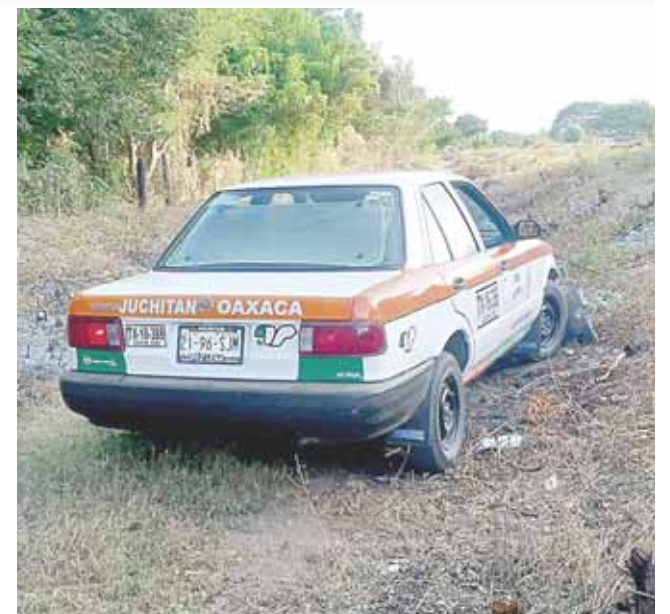
► El taxi fue abandonado.

Hasta el momento se desconoce el motivo de la desaparición de este ruletero, por lo que familiares teme por su vida.