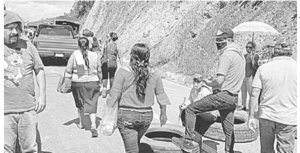
► La CANACO exige atención del gobierno estatal y federal.

te Ramírez, vocera de los inconformes, el bloqueo se levantó cerca de las 17:30 horas, luego de que comisionados en la ciudad de Oaxaca, padres de familia e integrantes de la Sección de Trabajadores de la Edu-