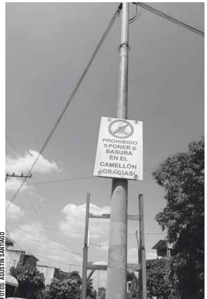
► Los mensajes se colocaron en diversos puntos.

"Primero colocamos los letreros y después dialogamos con cada uno de nuestros vecinos para que también contribuyan y sean