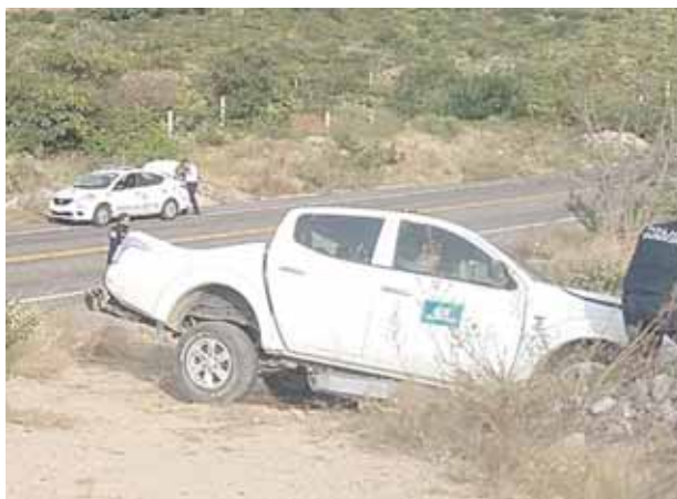
► En el tramo Salina Cruz-Salinas del Marqués.

Elementos de vialidad tomaron conocimiento de lo sucedido y ordenaron que la unidad de motor fuera retirada del lugar con una grúa y llevada al encierro oficial en donde quedó a disposición de la autoridad correspondiente quien será la encargada de deslindar responsabilidades.