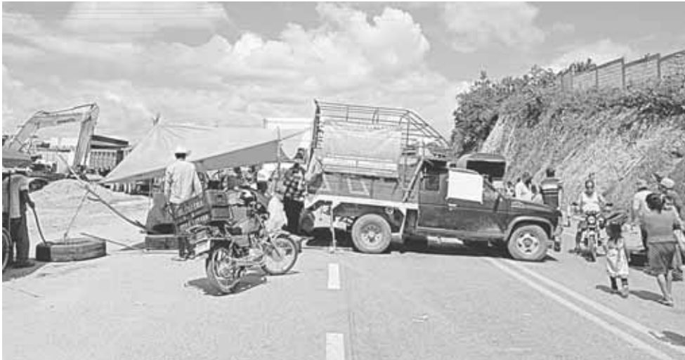
► De no cumplirse los acuerdos, las manifestaciones se intensificarían.

Personal de la SEGEGO arribó para dialogar con los inconformes que por el momento aceptaron retirarse