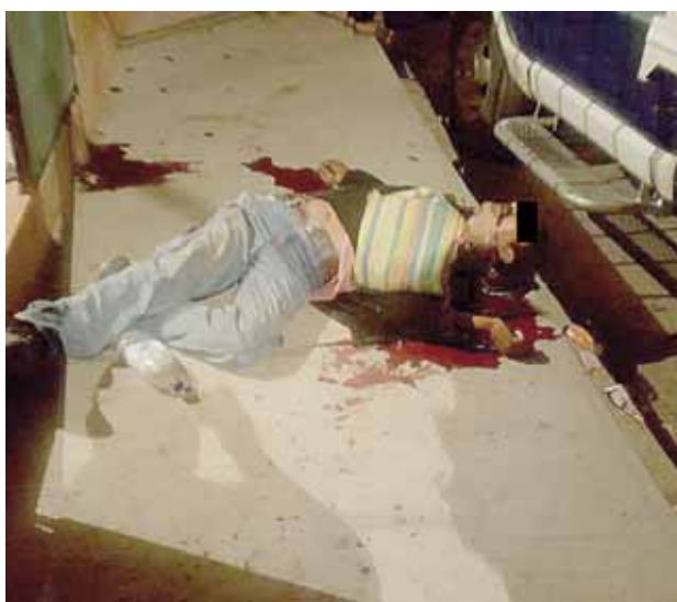
► Una de las víctimas.

Por el caso, la vicefiscalía regional abrió la carpeta de investigación correspondiente al delito de homicidio en contra de quienes resulten responsables.