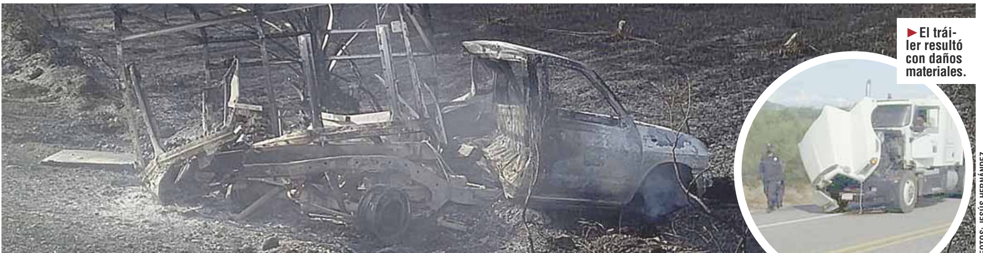
► El tráiler resultó con daños materiales.