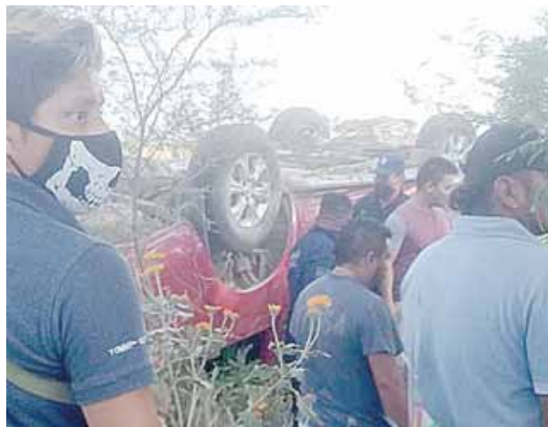
► Automovilistas dieron aviso de los hechos.