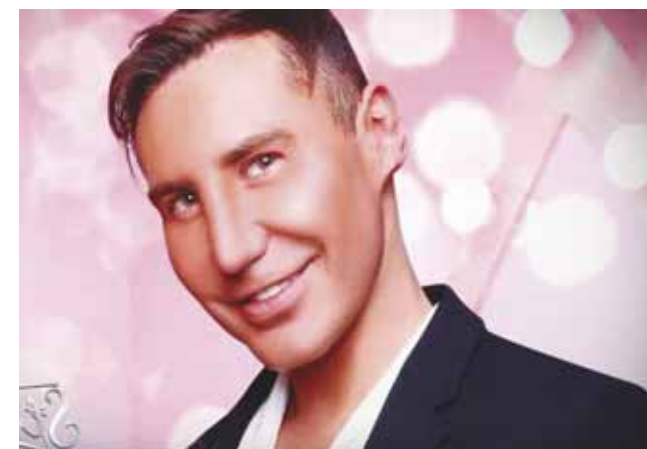
► El también influencer sufría de depresión.

Enseguida pidió ayuda a elementos de la Secretaría de Seguridad Ciudadana, el mismo hombre señaló que su jefe tomaba antidepresivos por lo que no se descartaba que la causa de su muerte haya sido un suicidio.