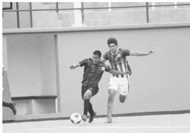
► Ambos equipos durante el partido de preparación.