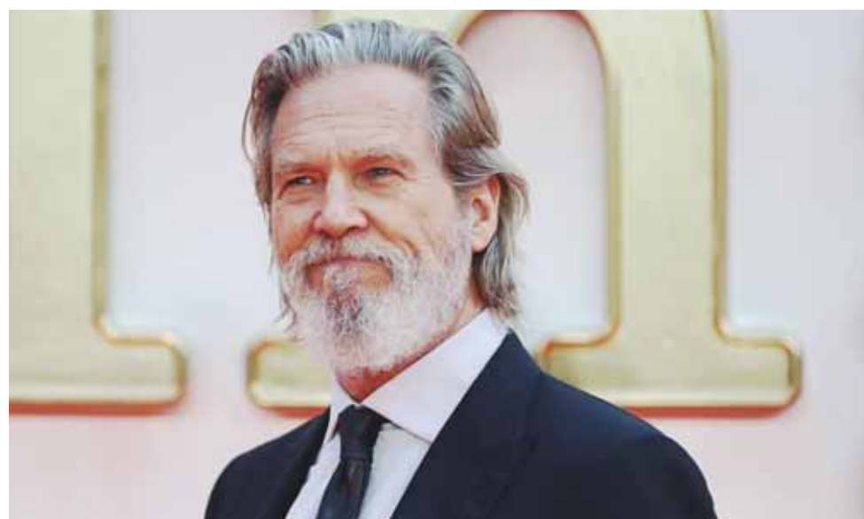
► Bridges es considerado realeza de Hollywood. Es hijo de los actores Lloyd y Dorothy Bridges, ambos fallecidos en 1998.

El linfoma es un tipo de cáncer que afecta al sistema inmunitario encargado de combatir los agen-