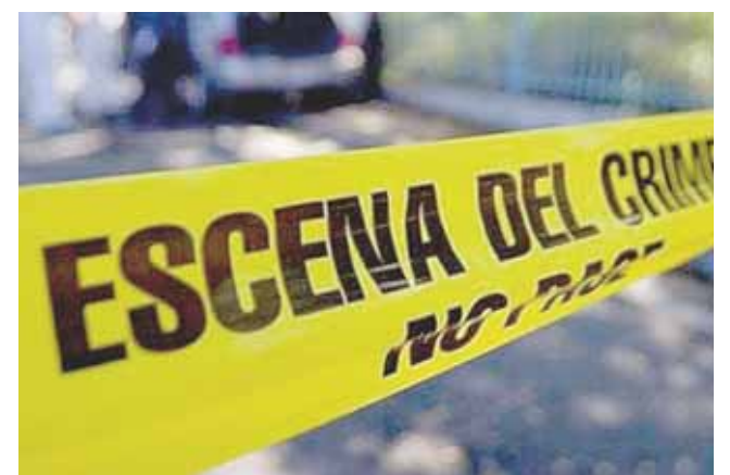
► El área fue acordonada.

También acudieron al sitio elementos de la Guardia Nacional, Naval y Servicios Periciales para las diligencias correspondientes.