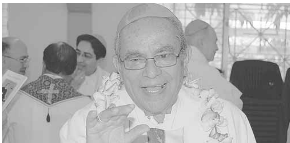
► El obispo Arturo Lona Reyes es originario de Aguascalientes.

sumamente grave. Lo tienen en el Hospital de Lagunas y me dice que está en la zona de Covid-19", indicó.