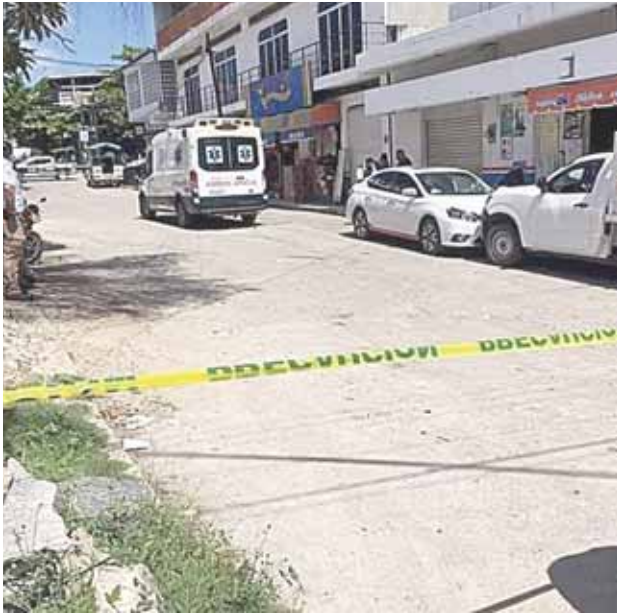
► El lugar fue resguardado por los policías.