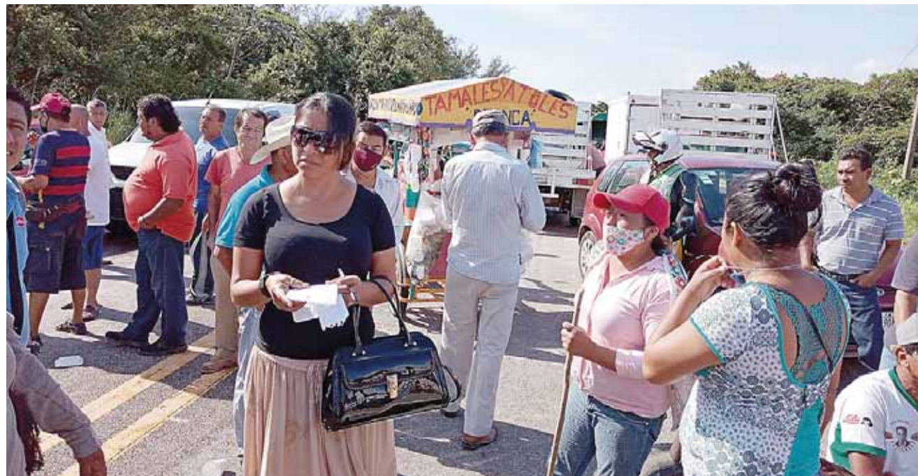
► Las afectaciones alcanzan al sector empresarial y de transporte.

Denuncian que tras realizarse el censo por los daños que dejó el sismo que azotó la región del Istmo de Tehuantepec en septiembre de 2017, en la primera etapa los apoyos serían entregados a 80 familias, pero ante la inconformidad de un grupo minoritario, el proceso