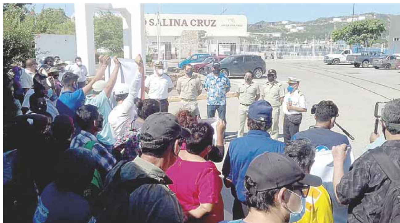
► Rechazan la militarización del comercio marítimo.

Recalcó que en el Istmo se cuenta con una autopista pero que por no estar conectado con otros estados de manera directa, no se puede transitar para trasladar la mercancía y converge en los puntos donde siempre se registran los bloqueos carreteros.