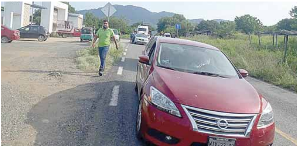
► Cientos de automovilistas se vieron afectados.