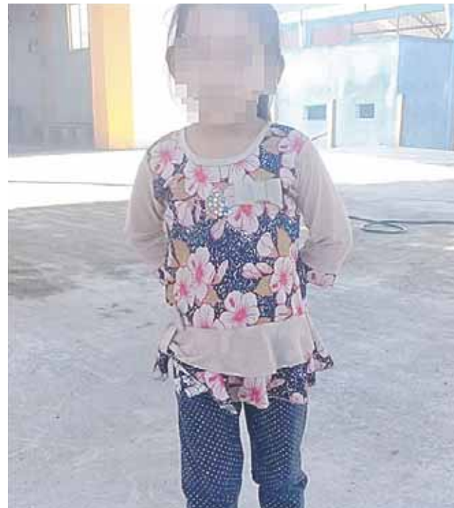
► La menor era de origen guatemalteco.

ron que el cuerpo de la menor fue hallado en esa comunidad ubicada al norte de parque nacional Lagos de Montebello, sin que se conozca los motivos que provocaron su deceso.