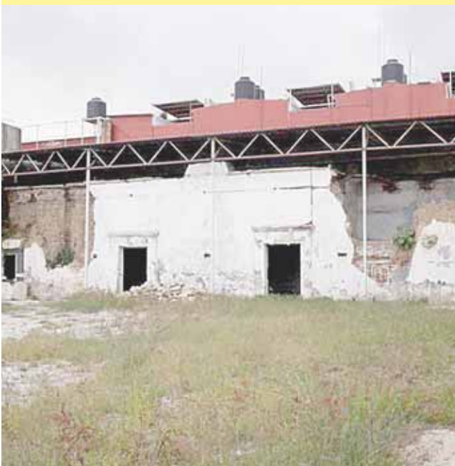
► Edificio de la Real Alhóndiga en la actualidad.

En próximas fechas, Camerata Oaxaca participará en el Séptimo Festival Internacional “Por eso cantamos juntos” que se realiza en Colombia, y que este año por la pandemia del Covid-19 será virtual.