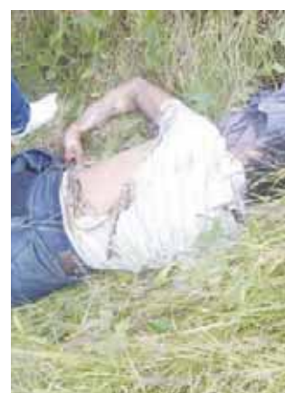
► La víctima fue llevada de urgencia a un nosocomio.

lesiones del joven eran de gravedad, fue trasladado de emergencia al Hospital Civil, en donde quedó internado y su estado de salud se reporta como delicado.