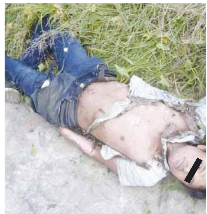
► El joven resultó con quemaduras de segundo y tercer grado.