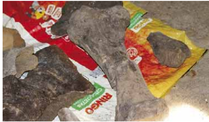
► El descubrimiento podría presagiar hallazgos similares en la región.