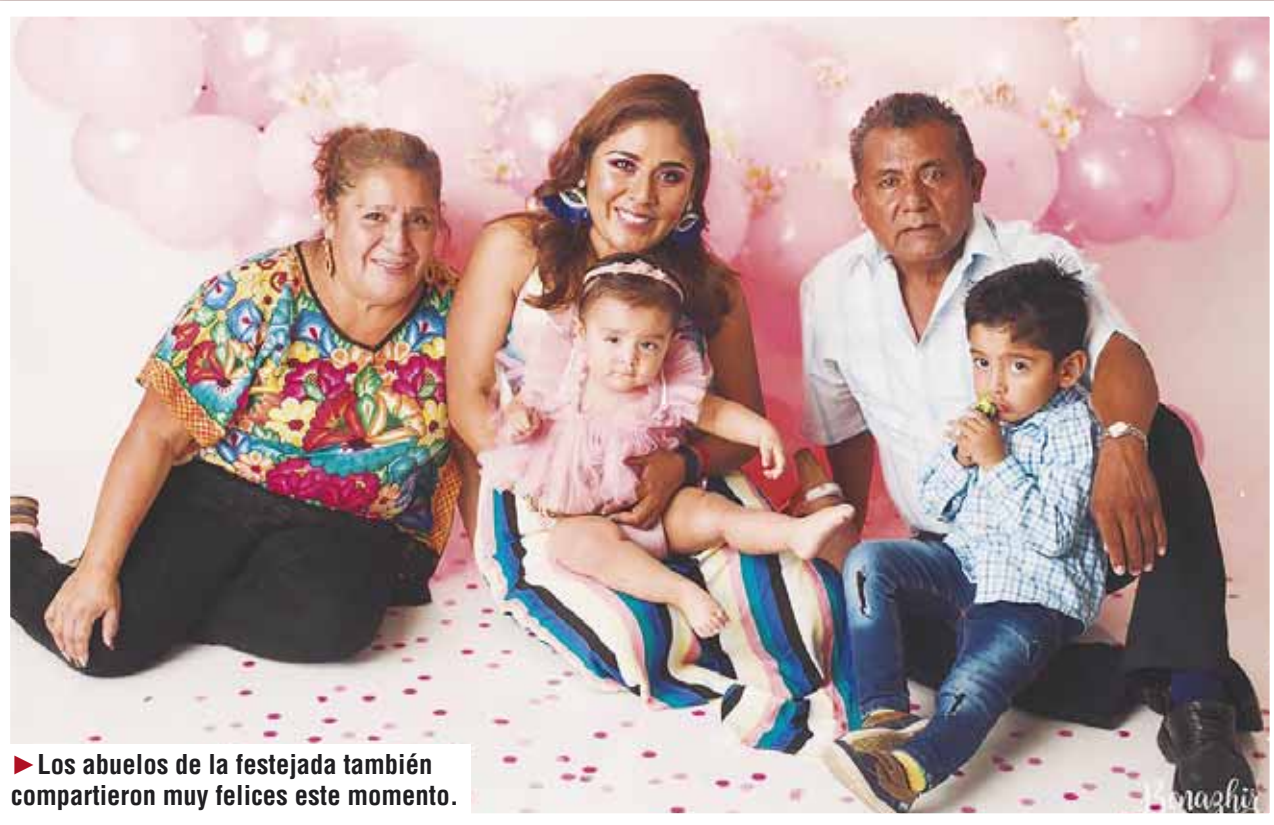
► Los abuelos de la festejada también compartieron muy felices este momento.