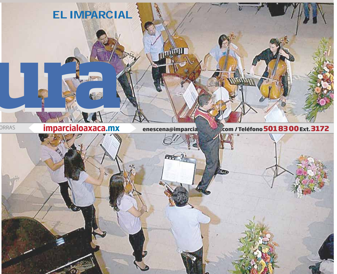
► Camerata Oaxaca está integrado por 15 músicos jóvenes oaxaqueños.