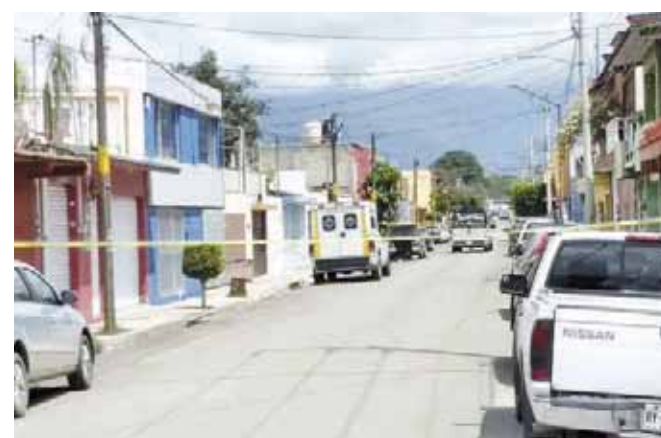
► El uniformado murió en una ambulancia sobre la calle de Xicoténcatl cuando lo llevaban al nosocomio.