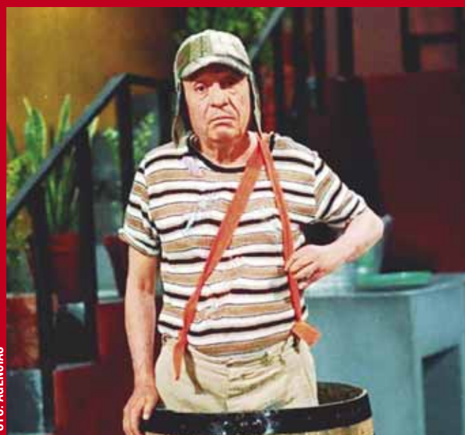
► Roberto Gómez Bolaños falleció en 2014 dejando un gran legado en la comedia.

La nostalgia es mayor porque ayer se cumplían 25 años del término de transmisiones de Chespirito y el mes próximo cumpli-