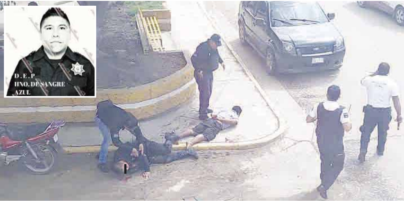
► El policía fue atacado con un cuchillo y quedó malherido en el Parque Del Sol, en Xoxocotlán.

policiaca@imparcialenlinea.com / Teléfono 501 83 00 Ext. 3176