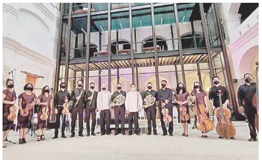
► Sus integrantes están constituidos como una asociación civil.