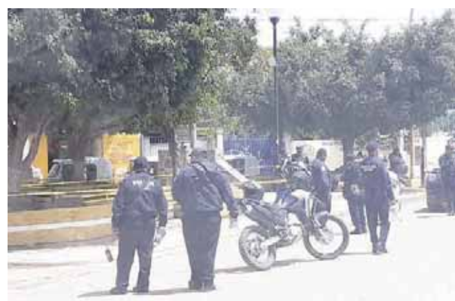
► Elementos policiacos arribaron como refuerzo al lugar de la agresión.