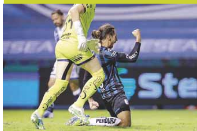
► Fue uno de los encuentros más espectaculares en lo que va del Guardianes 2020.

Puebla se ubica en el noveno sitio con 14 unidades, mientras que Querétaro se posicionó en el lugar 12, con el mismo número de puntos.