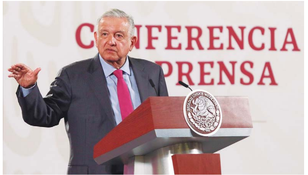
► Las constantes descalificaciones a diarios y periodistas, se han querido subsanar con un exhibicionismo vanidoso de aparecer diario en los medios

Dentro de los problemas que afronta el Gobierno Federal, entre los que se encuentra la Presa de la Boquilla en Chihuahua, el bloqueo de vías férreas en Michoacán, la Toma de la oficina central de la CNDH, la renuncia con denuncia de Jaime Cárdenas, la promesa de "aclarar" el tema de los 43 desaparecidos de Iguala, entre otros como la Pandemia, el desempleo, la crisis económica y algunos más, surge un movimiento de oposición denominado Frenaa, que quiere decir algo así como Frente Nacional Anti AMLO. Este grupo desde la semana pasada instaló cosa de quinientas tiendas de campaña en la Avenida Juárez de la Ciudad de México y han pretendido llegar al Zócalo capitalino. Su finalidad según lo