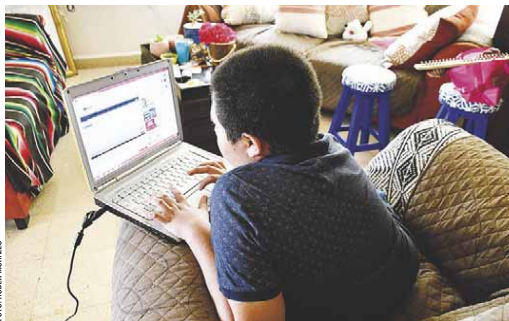
En Oaxaca, pocos hogares disponen de televisión o una computadora para internet.

La televisión digital es el aparato electrónico que más hay en los hogares oaxaqueños, y según este estudio, solo se cuenta en 6 de cada 10 casas, esto significa que 436 mil 322 casas no tienen acceso a un televisor.