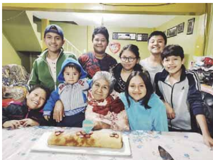
► Sus nietos compartieron su cariño con la cumpleañera.