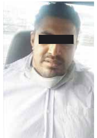
► Los detenidos se presentaron como cobradores.