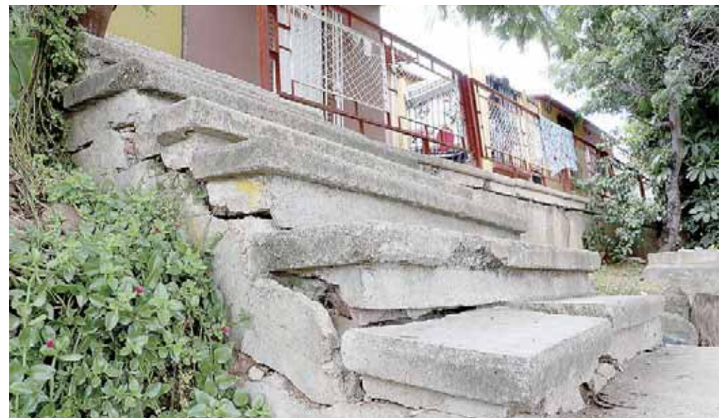
► Los habitantes llevan más de tres décadas sin obra pública.