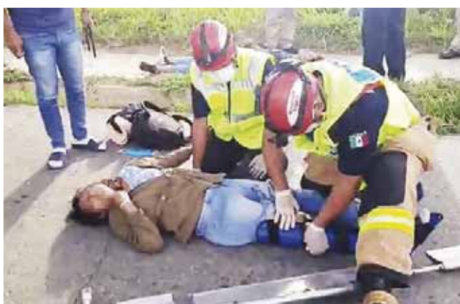
► La joven que viajaba en la moto sufrió una fractura.