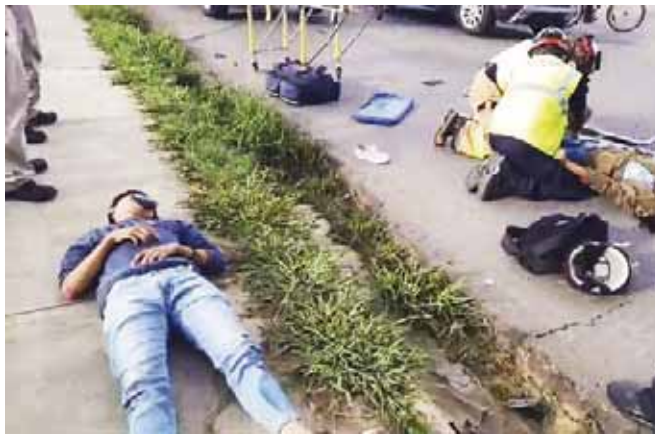
► El joven motociclista sufrió diversos golpes.