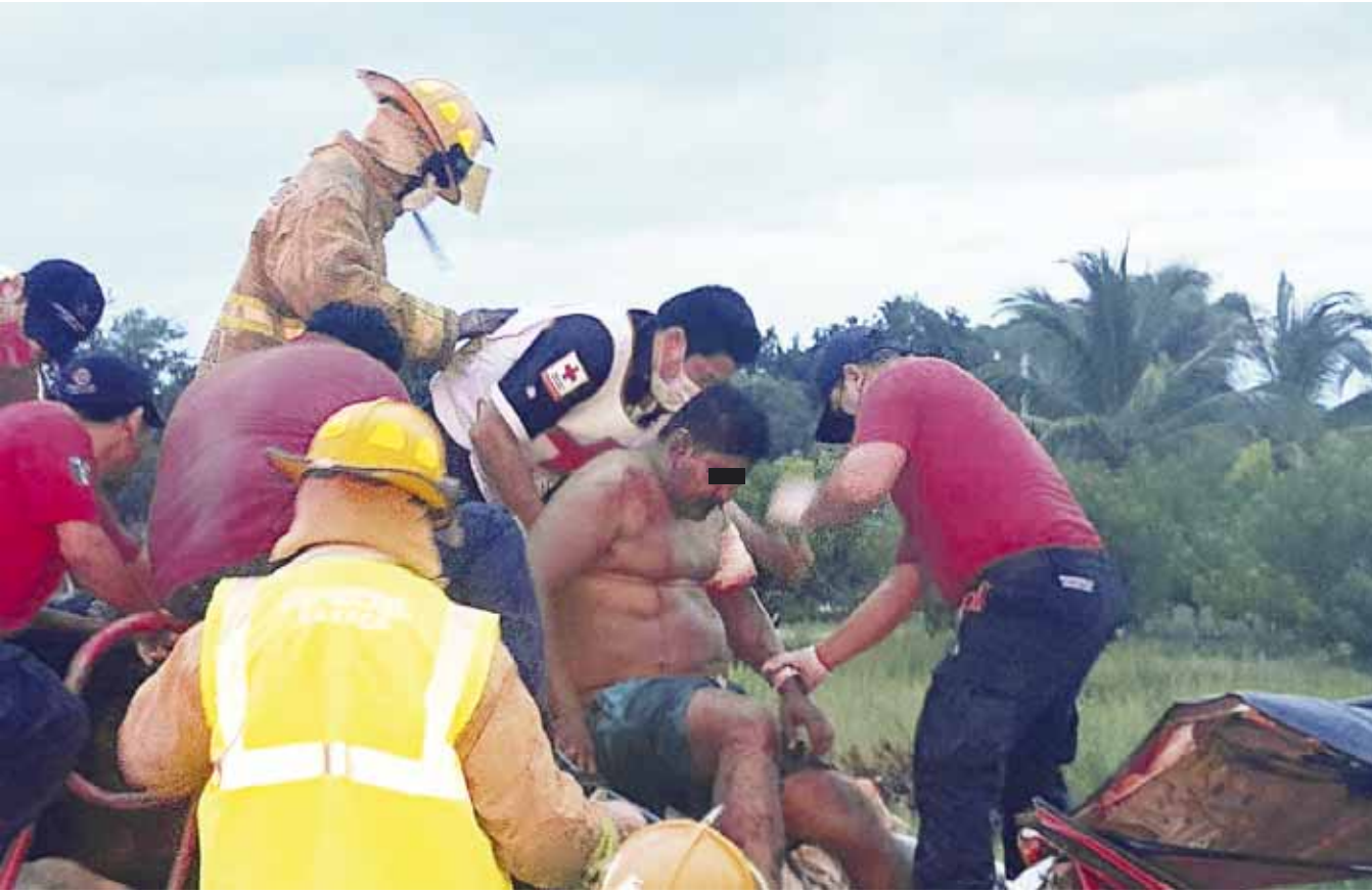
► El hombre fue rescatado de entre los fierros con las piernas rotas.

policiaca@imparcialenlinea.com / Teléfono 501 83 00 Ext. 3176