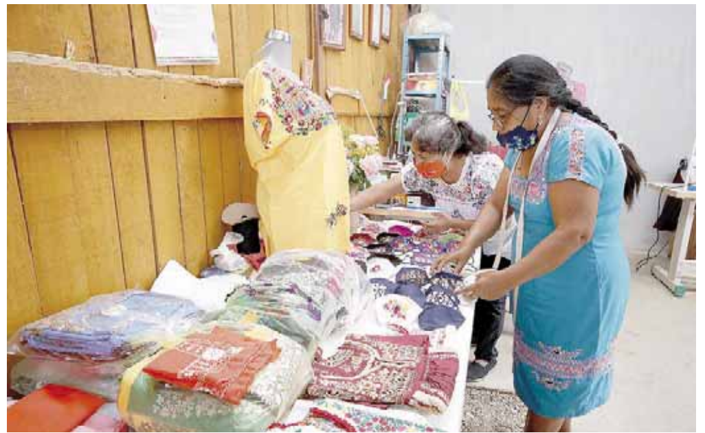
► Es una forma de generar ingresos en esta dura crisis económica.