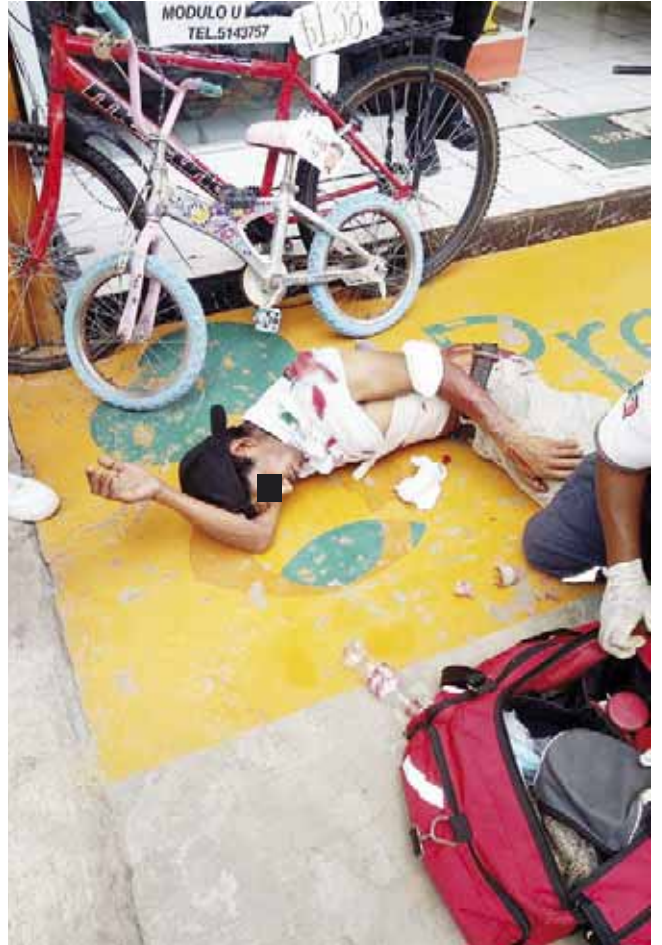
► La víctima recibió un navajazo en el brazo y otro en la pierna.

Ante la herida este fue auxiliado por los paramédicos del grupo Halcones quienes lo canalizaron a la sala de urgencias del Hospital General Dr. Aurelio Valdivieso en donde su estado de salud es reportado como delicado.