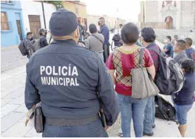
► El pasado martes, elementos policiales dieron a conocer las irregularidades de la corporación.