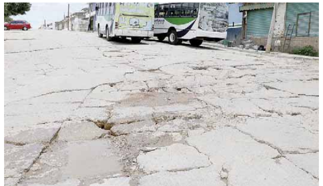
► Lo que más urge son obras de repavimentación y de atención a vías.