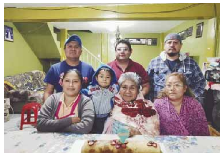
► Los hijos de la festejada se reunieron para expresar su afecto a su madre.