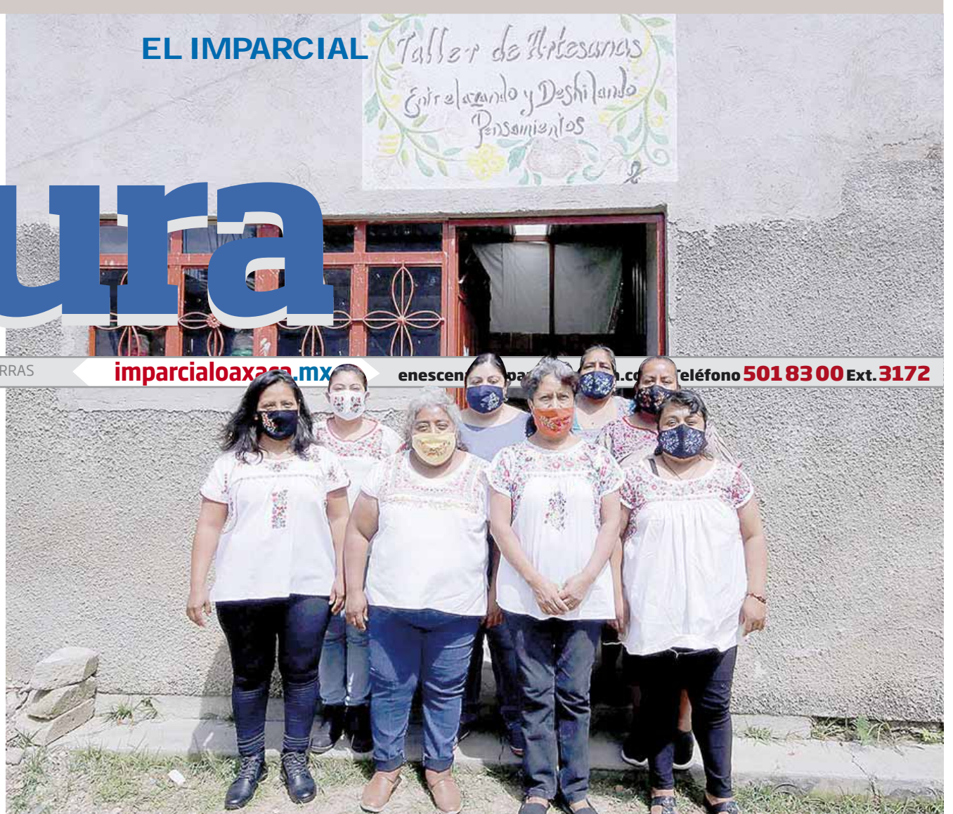
► El Colectivo Entretejiendo y Deshilando Pensamientos se conforma por 10 mujeres artesanas.