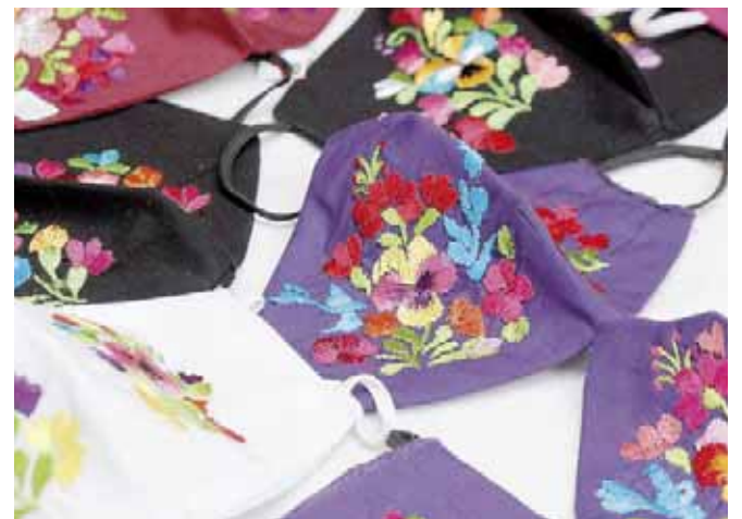
► Bordan las tradicionales flores que distinguen a su comunidad.

Los cortes de tela se realizan conforme a las medidas generales para adulto; aparte se confecciona para niños. Ambos llevan el distintivo de la comunidad, que son las flores con pensamiento bordadas a mano, en tonos coloridos para que resalten en cualquier material. Las artesanas del colectivo agregaron que las personas que los adquieran estarán muy protegidos y con un bonito y típico diseño.