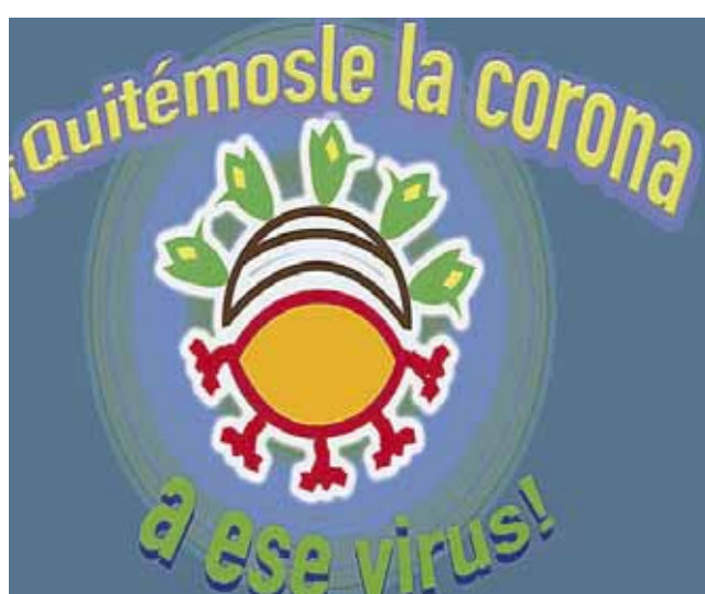
► La serie radiofónica está disponible en la página web de la productora.