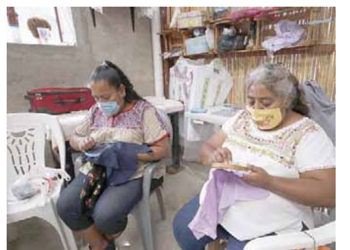
► Los precios van de 30 a 80 pesos, máximo.