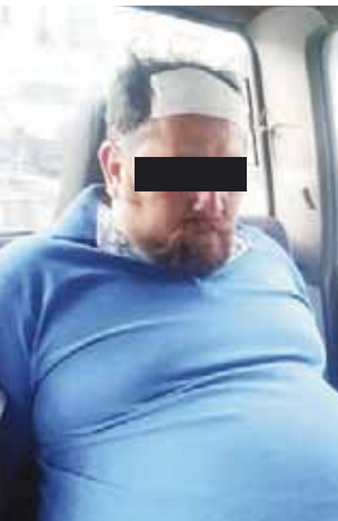
► Una mujer los acusó de haberle robado.