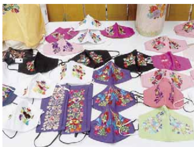
► Utilizan colores vivos y llamativos para esta prenda.

Los precios van de 30 a 60 pesos, con un máximo de 80 pesos, según el pedido especial, pero no aumenta mucho. Es mucho trabajo y poco el pago—reconocen las artesanas— las personas en ocasiones no ven las horas que invertimos en los detalles, pero a pesar de eso no pueden aumentarles el precio porque la competencia las obliga a equilibrarlo. Este colectivo se encuentra en Hidalgo número 49 o al teléfono 951 420 60 05.