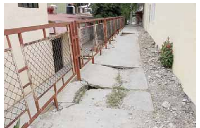
► Se han detectado varias fracturas en banquetas, escaleras y barandales.