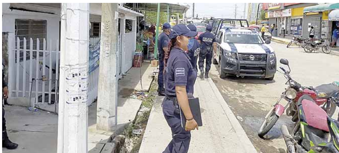
► Los hechos se registraron en sobre la calle Morín del Barrio Santa María.

En el lugar sólo se pudo observar patrullas de la policía municipal y estatal quienes solo tomaron conocimiento de lo sucedido y luego de unos minutos implementaron un operativo a los alrededores sin tener resultados positivos.