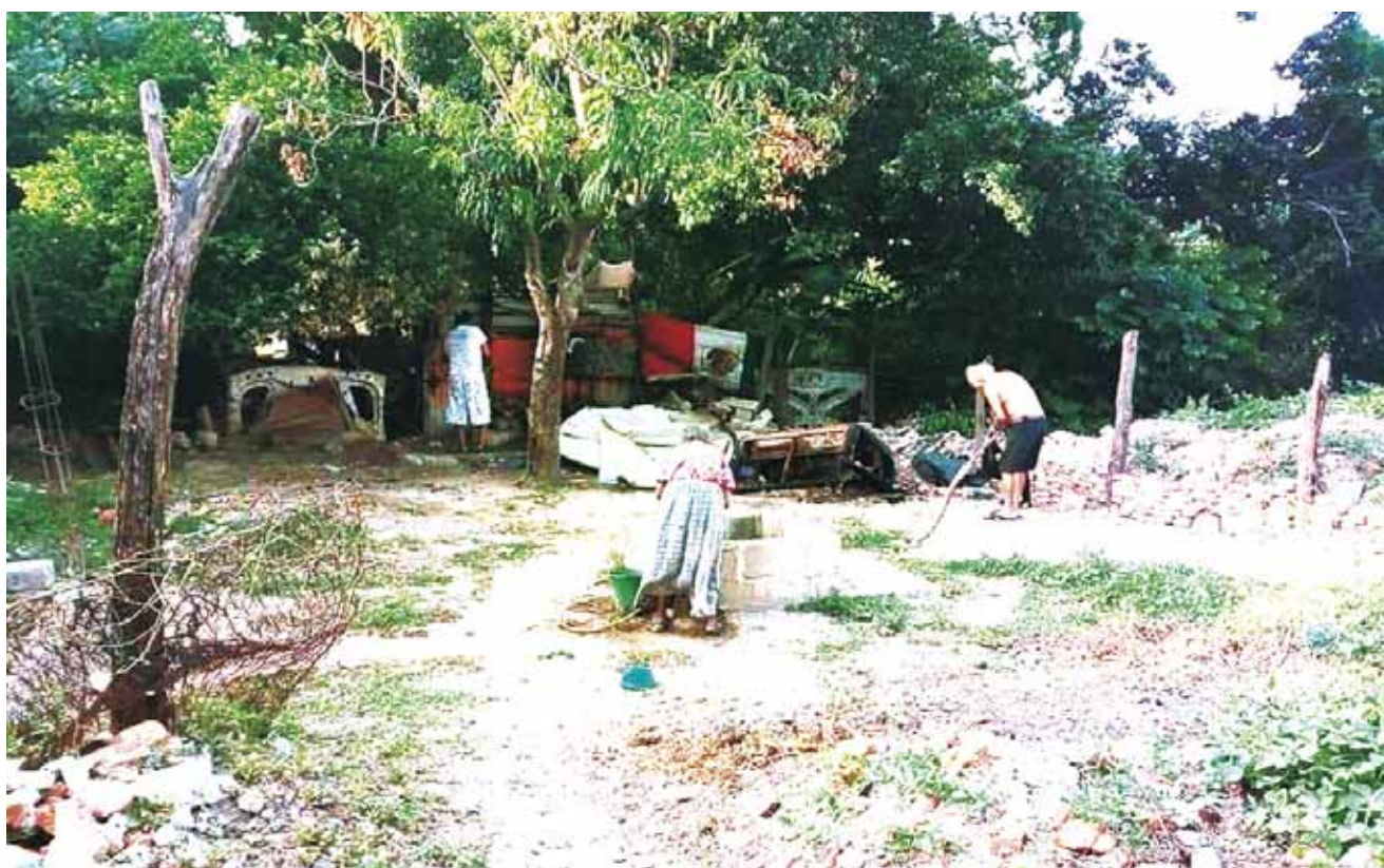
► Dos adultos mayores resultaron ilesos.

En entrevista vía telefónica Ricárdez Medina explicó "Desde inicio de administración, estas personas buscan no solo desestabilizar el ayuntamiento, sino también pretenden negociar para que sean incluidos en la nómina, y así sigan viviendo del presupuesto como están acostumbrados desde hace varios años. Pero con nosotros no han podido y por eso esos ataques sin fundamento jurídico".