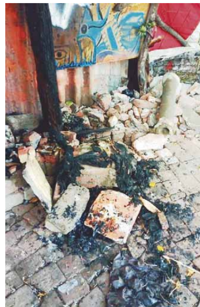
► La vivienda estaba construida con palma, carrizo y trozos de cartón.

Ante esta situación, Protección Civil exhortó a las personas que acostumbran a guisar sus alimentos en su fogón para que tengan cuidado, ya que una chispa pueda provocar un incendio que seade fatales consecuencias.