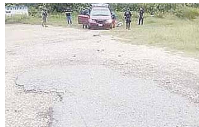
► Por este hallazgo se abrió una carpeta de investigación.

Cabe destacar que hasta el cierre de la edición los cuerpos no habían sido identificados.