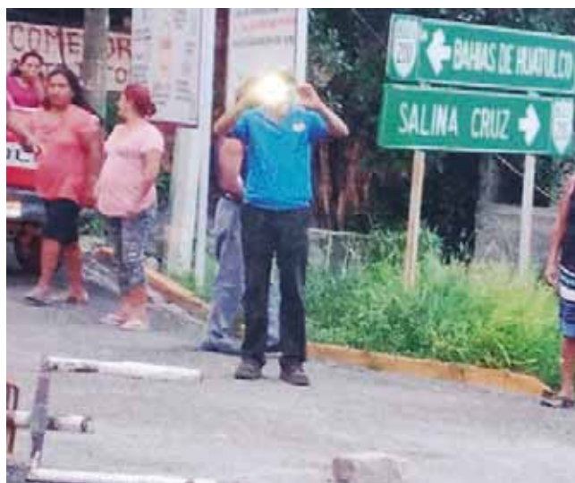
► Un grupo contrario bloqueó para impedir que el edil recibiera este apoyo.