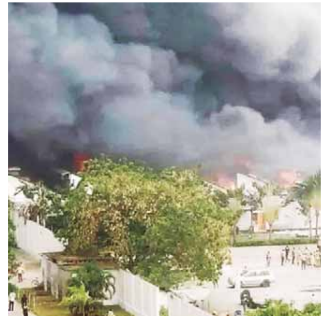
► En el lugar se almacenaban varias toneladas de medicamentos para combatir el Ébola y Covid.

Decenas de ambulancias acudieron de urgencia al sitio del accidente, según los reportes. Air India Express precisó en un comunicado que “no se había informado de ningún incendio en el momento del aterrizaje” del avión, que transportaba 174 pasajeros, diez niños pequeños, dos pilotos y cinco miembros de tripulación de cabina.