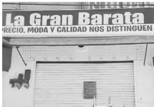
► Los negocios permanecen cerrados.

Una veintena de comercios ubicados principalmente en el primer cuadro de la ciudad, se han declara-