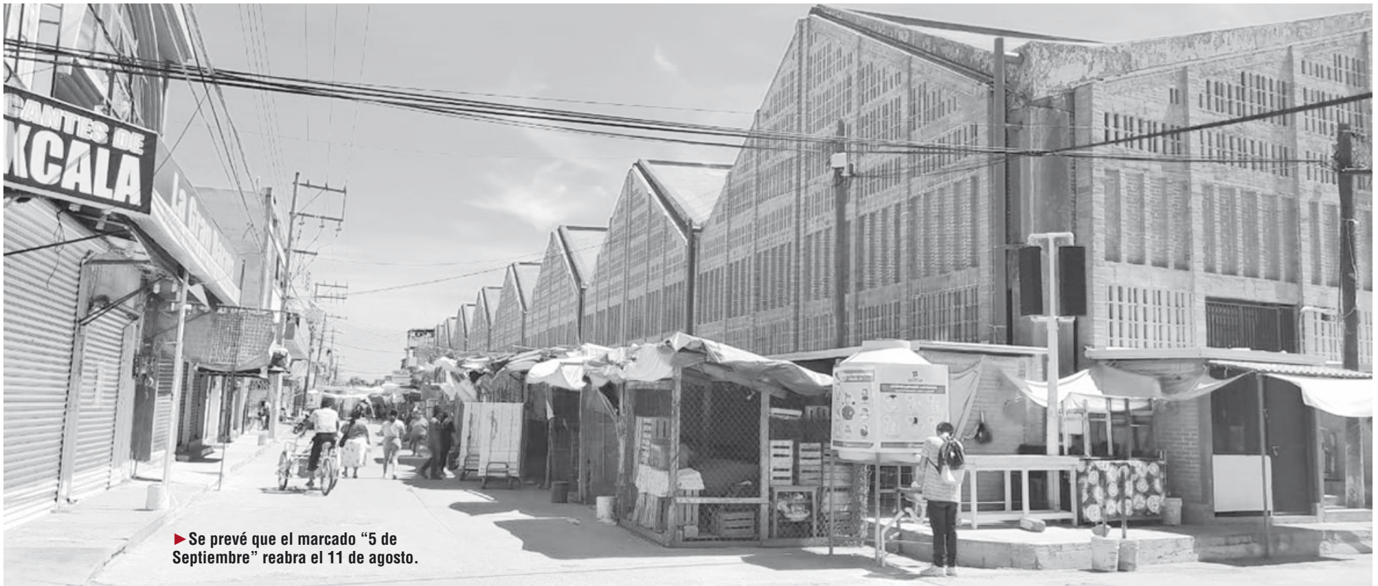
► Se prevé que el mercado "5 de Septiembre" reabra el 11 de agosto.