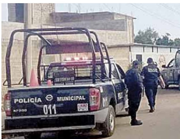
► La policía realizó un operativo.