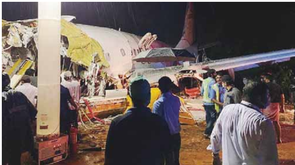
► Personal de los servicios de rescate trabajaron en la oscuridad para rescatar a los pasajeros.

El accidente del avión de Air India Express ocurrió en