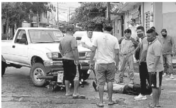
► Un joven motociclista resultó lesionado.

Más tarde hasta el lugar llegó el personal de la Agencia Estatal de Investigaciones con la finalidad de procesar el área del hallazgo ya una vez terminada la diligencia, se ordenó el levantamiento del cuerpo para que fuera trasladado al descanso municipal donde se le realizaría la necropsia de ley para así saber con certeza las verdaderas causas de su muerte para después ser entregado a sus familiares.