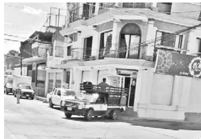
► Falta de liquidez y deudas.

Las autoridades municipales acataron la orden, y con el apoyo de elementos de la Policía Vial local establecieron un cerco sanitario en la zona referida evitando con esto la circulación de vehículos, y obliga-