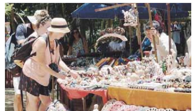
► Ubica a nuestro país en el máximo nivel de alerta por pandemia.

En el nivel 3, que significa “reconsiderar viajar”, están la mayoría de países, incluyendo Alemania, Francia, Corea del Sur, Japón, Australia y Uruguay, única nación latinoamericana incluida en la lista que la Unión Euro-