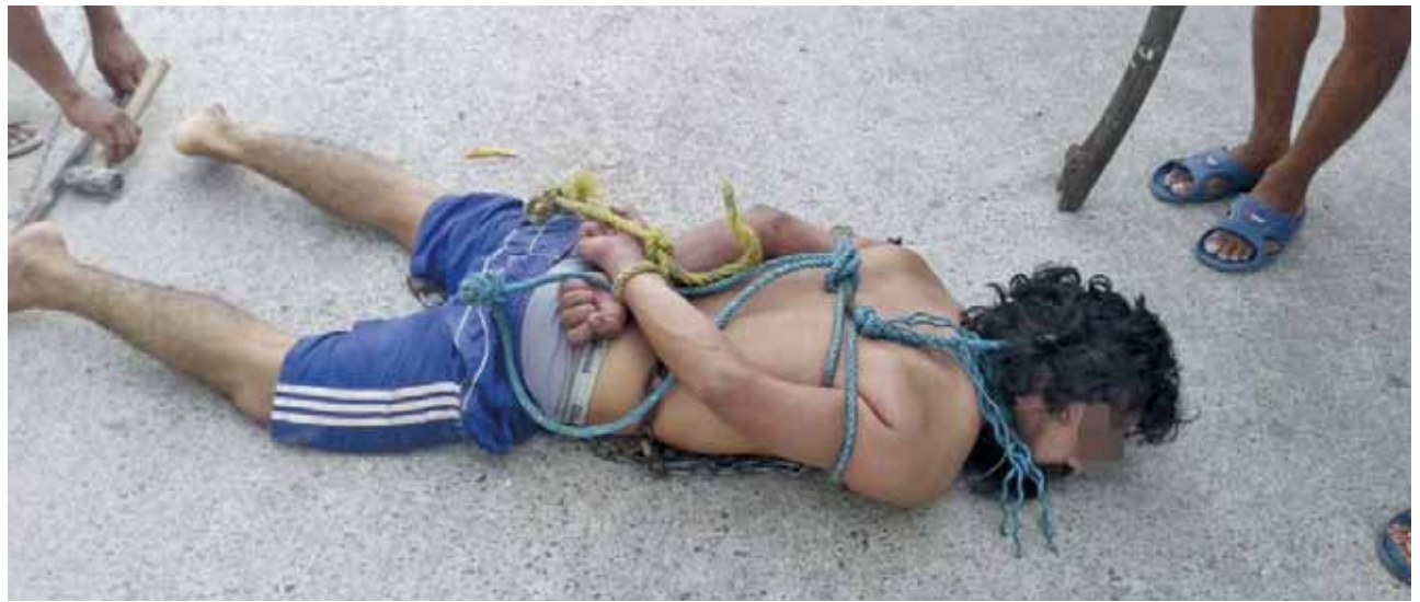
► Entre todos lograron someterlo.