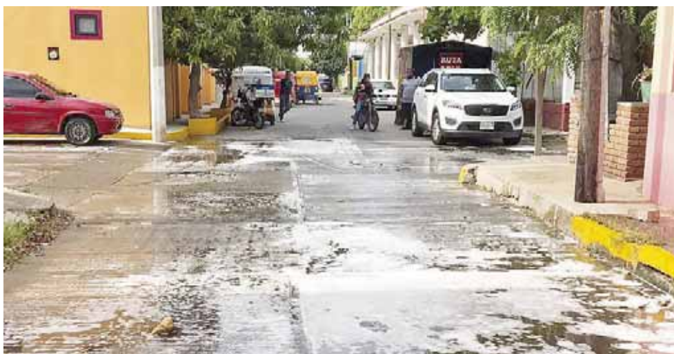
► La mezcla tiene efecto prolongado.

Finalmente mencionó que seguirán con esta actividad en la medida que la gente se comunique al número de la Subestación que es 9717112434 para que se programen los servicios, actualmente aún hay por lo menos 10 colonias en espera del apoyo.