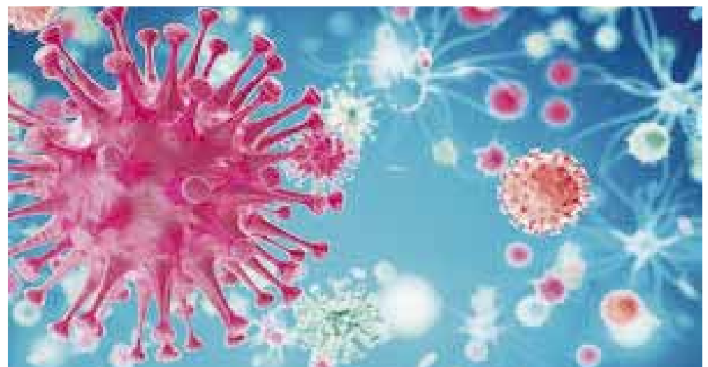
► La propagación del virus continúa.

El país más afectado por la pandemia registra hasta este jueves 159 mil 990 muertos por el virus.