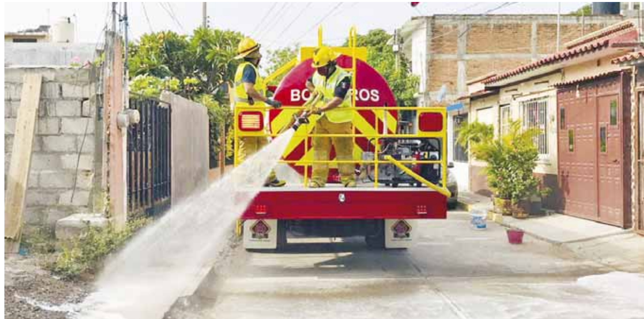
► La ciudadanía llama para que saniticen sus calles.

Ahora solo los Bomberos continúan con esta tarea, toda vez que la gen-