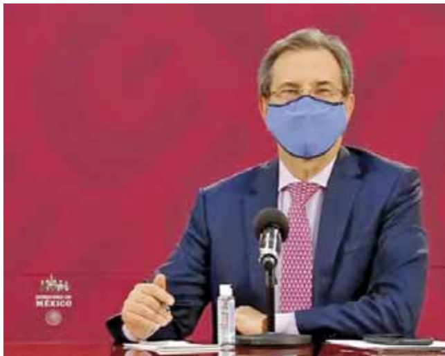
► Esteban Moctezuma, titular de la SEP, durante conferencia de prensa.