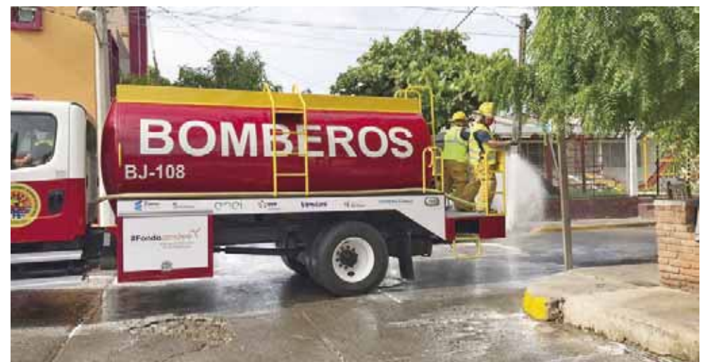
► Los bomberos no descuidan otras actividades.