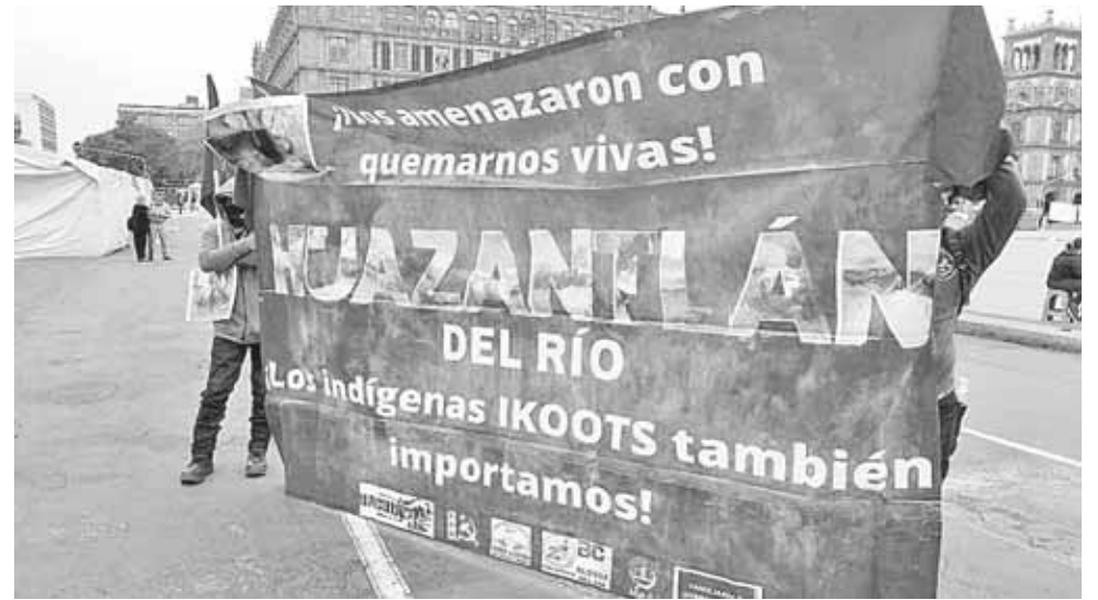
► Piden que el atroz hecho no quede impune.