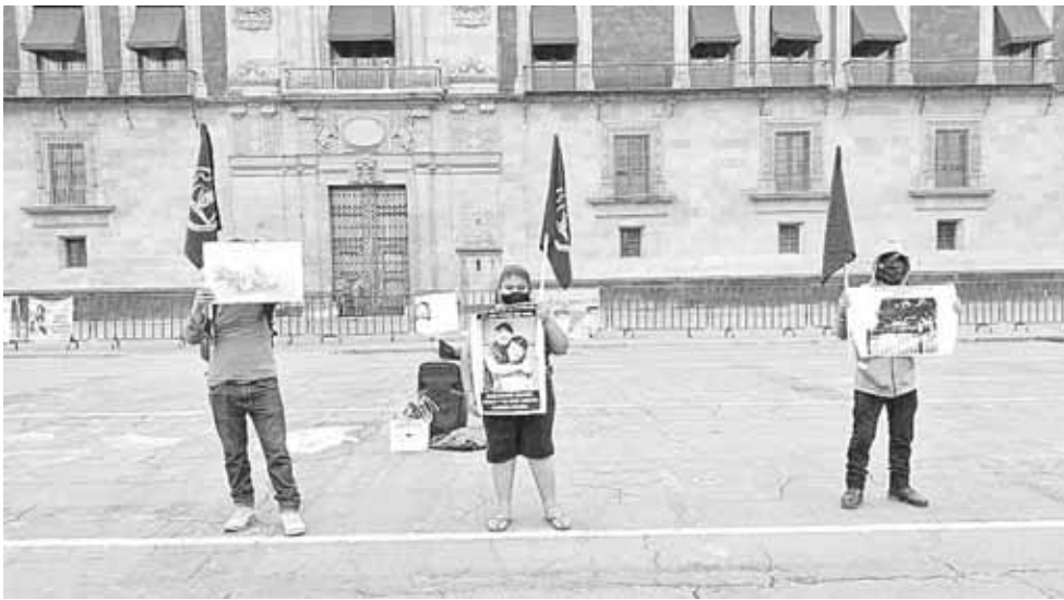
► Los manifestantes bloquearon diversas oficinas de gobierno.