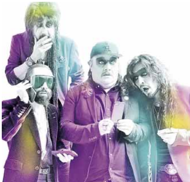
► La agrupación debutará con esta nueva modalidad en el Foro Pegaso.

Se espera la colaboración de una estación de radio, además se podrá ver por Cinépolis Klic