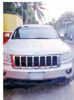
► También fueron decomisados varios vehículos de modelos recientes.