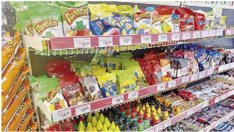
► Quienes infrinjan esta reglamentación serán objeto de sanciones y hasta cárcel.

nacionales que persiguen intereses oscuros, por lo que acató que no se prohibirá la venta del chocolate, tlayudas y tampoco se perseguirán a las tienditas de la esquina. "Buscamos que las niñas, los niños y adolescentes tengan una alimentación sana, que sean los padres quienes consideren si pueden consumirlo".