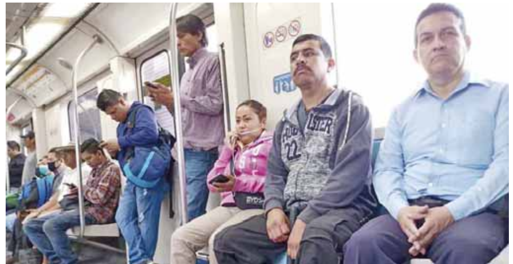
► Algunas personas ya no usan cubrebocas.

La Universidad Johns Hopkins dio a conocer esta tarde que Estados Unidos vuelve a registrar una jornada con más de dos mil muertos a causa del coronavirus Covid-19, hecho que no ocurría desde hace tres meses.