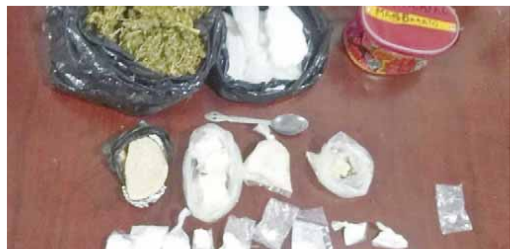
► La AEI y la Guardia Nacional aseguraron la droga.