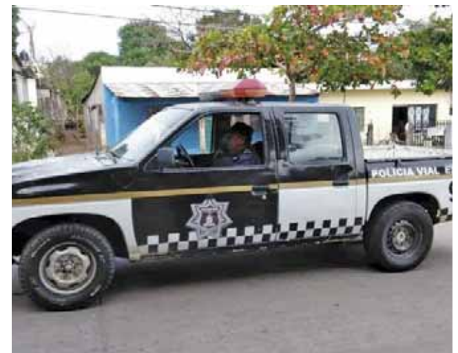
► Se esperan buenos resultados.