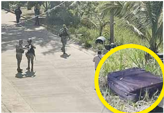
► El cuerpo se hallaba en una maleta.