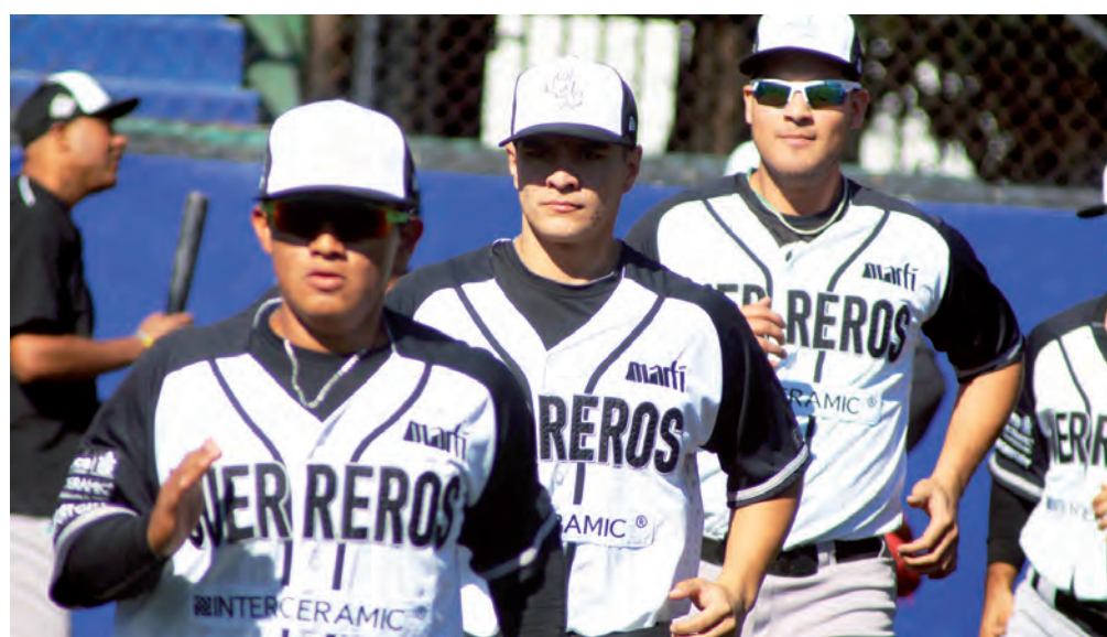
▶ La mayoría de los peloteros ya reportaron con el equipo.

El día de hoy continuará la pretemporada 2020 con trabajo extra para algunos