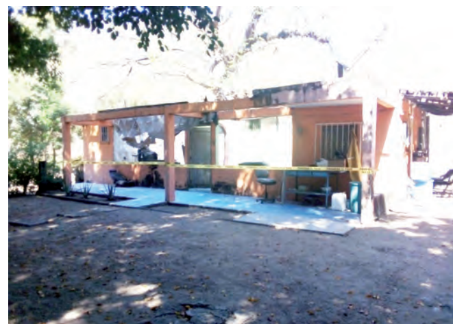
► Los hechos fueron en un aserradero de la localidad de los Limones, Mixtepec.

Por los hechos se inició una carpeta de investigación por el delito de homicidio, en contra de quien o quienes resulten responsables.