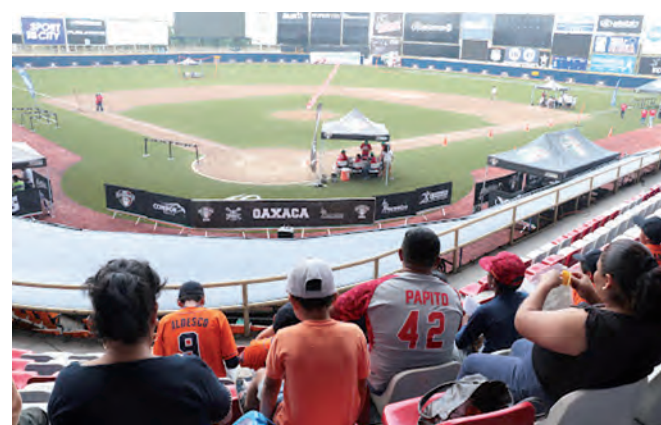
▶ Hoy continuará la preparación con trabajo extra para algunos peloteros.