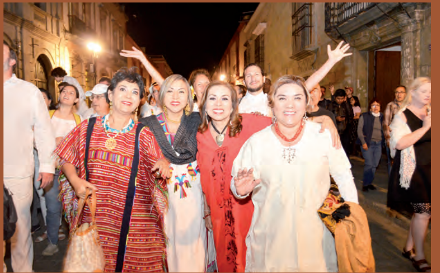
► El Club Rotario Guelaguetza estuvo presentes en esta celebración.

Al culminar el recorrido los Rotarios disfrutaron de una cena en un céntrico restaurante donde convivieron agradablemente, conociendo más sobre este estado.