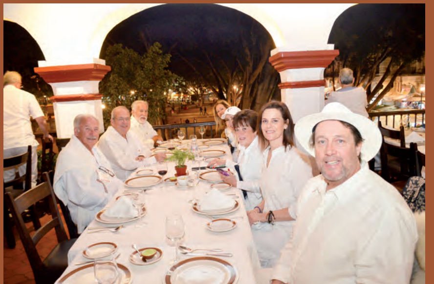
► Los rotarios disfrutaron de una agradable convivencia en un restaurante del Centro Histórico.