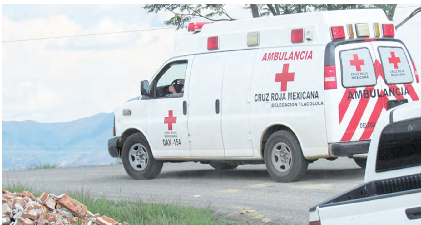
► Al lugar arribaron paramédicos de la Cruz Roja Mexicana, delegación Tlacolula.

policiaaca@imparcialenlinea.com / Teléfono 501 83 00 Ext. 3176