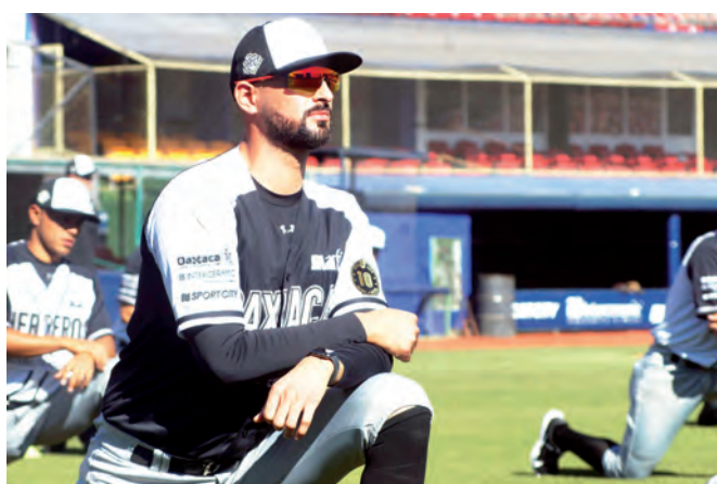
▶ El entrenamiento terminó con práctica de bateo y trote

La sorpresa en la grada y en parte como motivación fue saber que Cristiano Ronaldo, el máximo goleador histórico del Real Madrid asistiría a la cita. INFORMACIÓN 7C