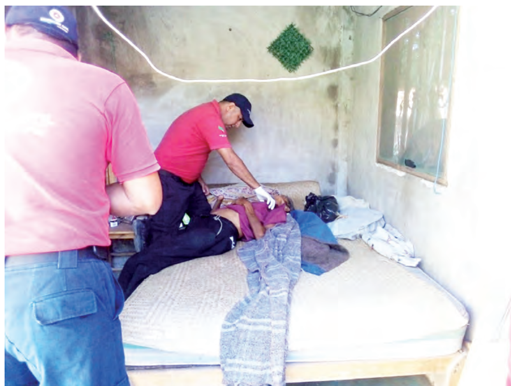
► El abuelito fue hallado muerto en su cama, con dos heridas en el pecho.

Más tarde, a la zona llegaron los elementos de la Agencia Estatal de Investigaciones (AEI), con el fin de procesar el área del crimen, personas quienes se encontraban en el lugar comentaron que el finado respon-