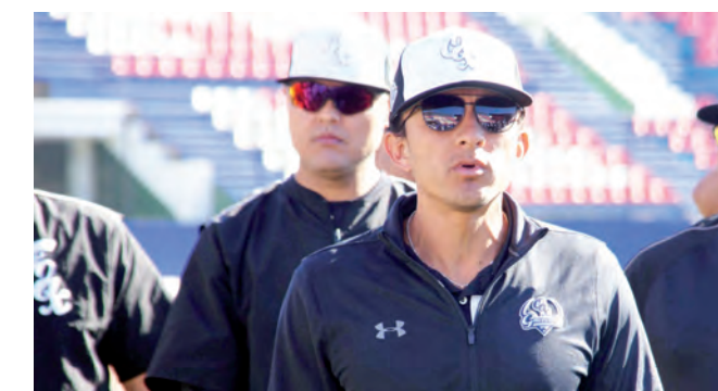
▶ Se preparan rumbo al arranque de la temporada 2020.

Parte de pre temporada 2020 que tendrá el equipo bélico, se efectuará en Juchitán de Zaragoza, en una serie de 3 encuentros frente a los Diablos Rojos del México.