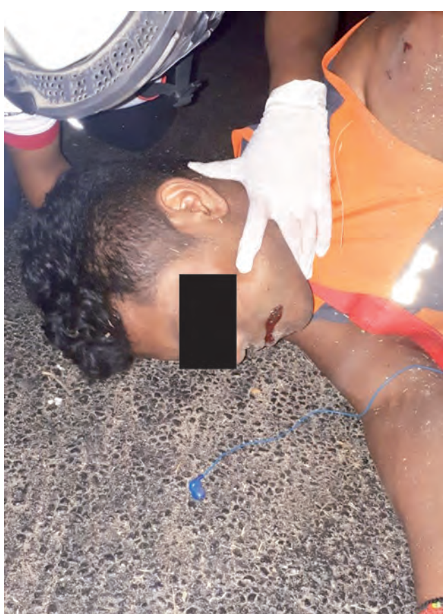
► El joven sufrió un derrape aparatoso.

La motocicleta fue asegurada y trasladada al encierro correspondiente.