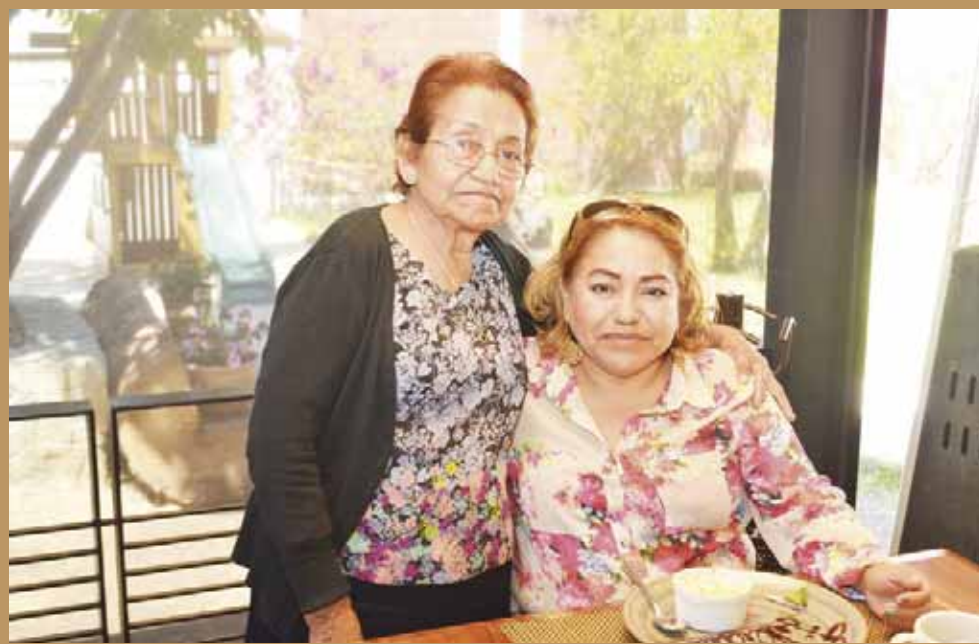
► El cariño y apapacho materno fue parte de esta celebración.