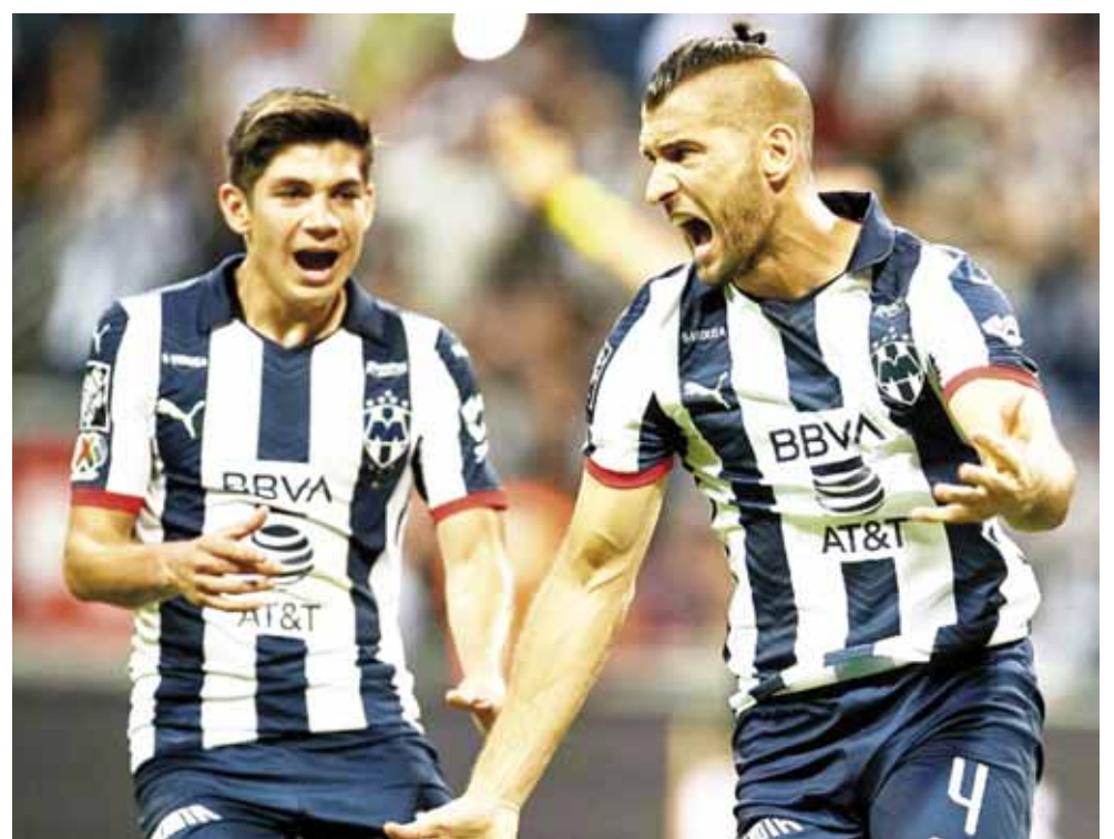
▶ Monterrey enfrentará a Xolos en la Gran Final.