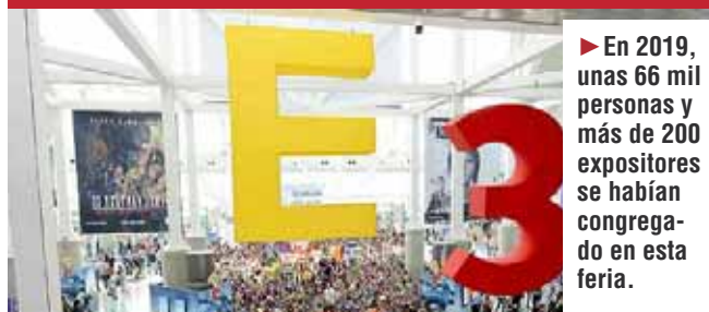
CANCELAN EL SALÓN DE LOS VIDEOJUEGOS

► En 2019, unas 66 mil personas y más de 200 expositores se habían congregado en esta feria.