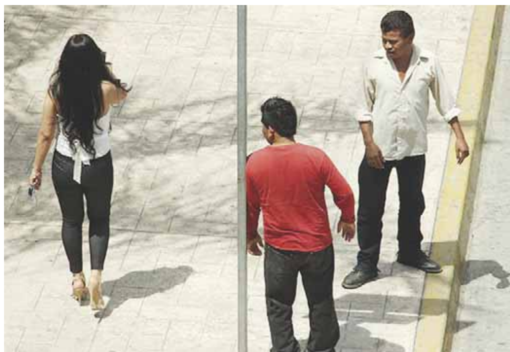
El acoso callejero debe ser frenado en la ciudad, afirman regidoras.

Para propiciar acciones que contribuyan a la prevención y erradicación de la violencia sexual contra las mujeres, se han organi-