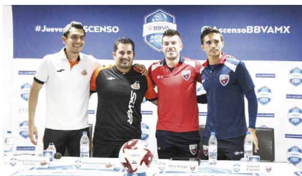
▶ En conferencia, aseguraron que el equipo está comprometido a dar lo mejor de sí esta noche.