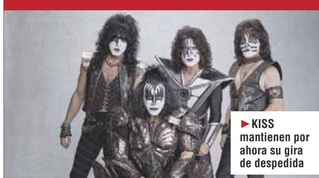
KISS SUSPENDE LOS "MEET & GREET"

► KISS mantienen por ahora su gira de despedida