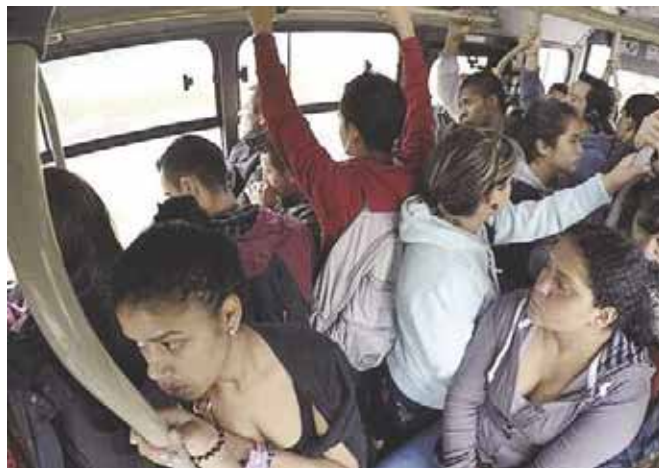
El transporte público es uno de los lugares donde más ocurre el acoso.

zando conferencias dirigidas al personal de las diferentes dependencias municipales.