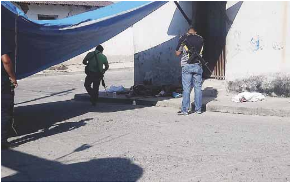
► Elementos policiacos llegaron a realizar las diligencias de ley.

policiaca@imparcialenlinea.com / Teléfono 501 83 00 Ext. 3176