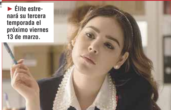
DANNA PAOLA, UNA VÍCTIMA MÁS

► Élite estrenará su tercera temporada el próximo viernes 13 de marzo.