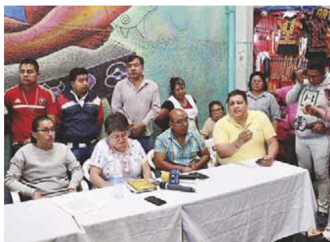
Señalaron al funcionario en conferencia de prensa.

nal de Estadística y Geografía (INEGI) estableció que mientras 10.1 por ciento de hombres entrevistados manifestaron haber sufrido una situación de violencia sexual en la calle, el 27.2 por ciento de mujeres enfrentaron este tipo de violencia.