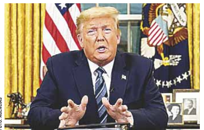
► En un discurso a la nación, Donald Trump anuncia la suspensión de los viajes desde Europa a Estados Unidos.