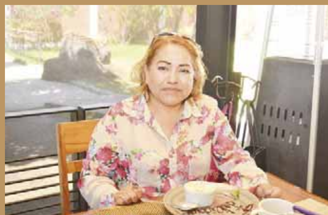
► La cumpleañera se sintió dichosa por esta fecha especial.