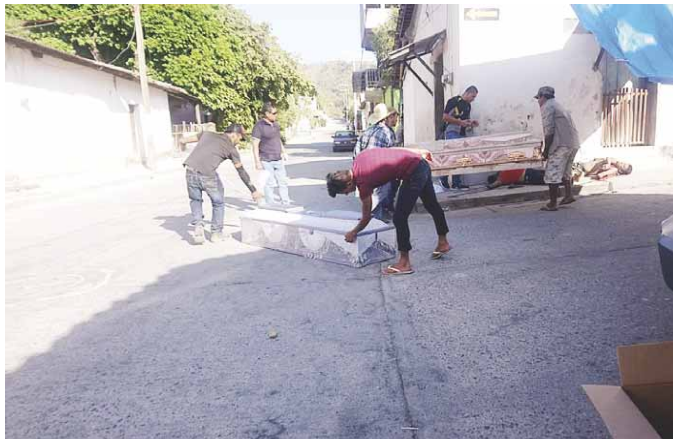
► Los cadáveres fueron llevados en ataúdes hacia el descanso municipal.

Pero cuando madre e hijo esperaban la camioneta que