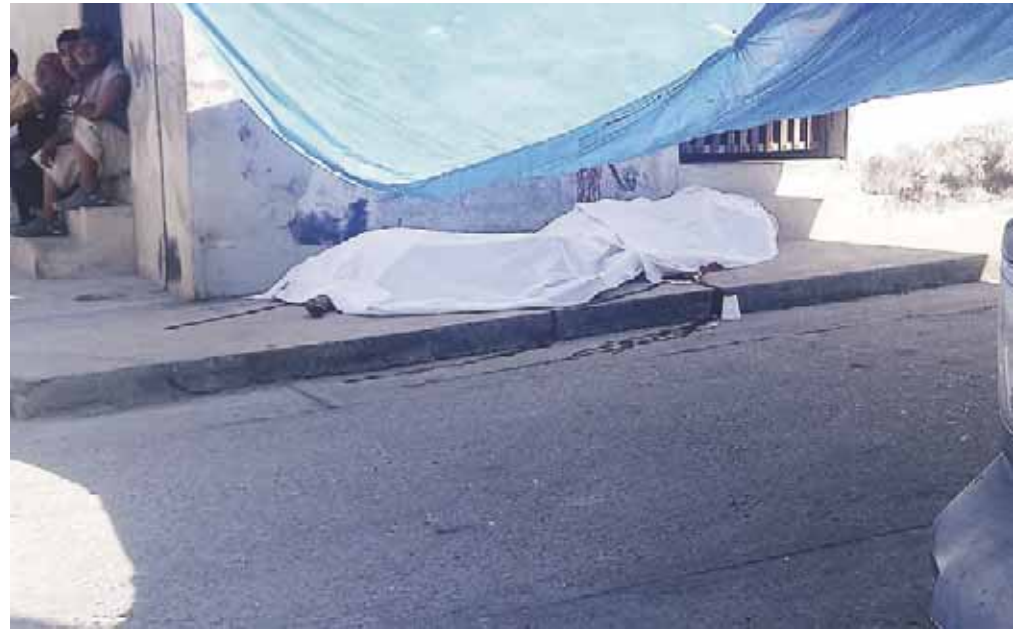
► Los cuerpos de las víctimas fueron cubiertos con una sábana.

Las víctimas esperaban la camioneta que los transportaría a El Coyul El Grande, cuando sujetos a bordo de una moto llegaron y uno de ellos los atacó a balazos