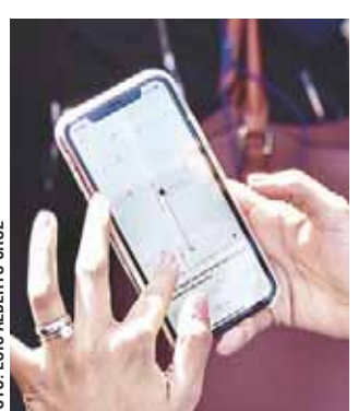
► Llega Didi a Oaxaca.