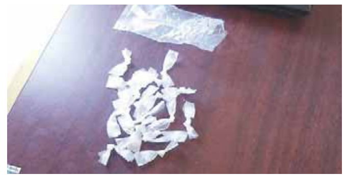
► La droga fue decomisada por los agentes.

teniendo cocaína y 36 bolsas de nylon conteniendo droga conocida como cristal", especificó la instancia.