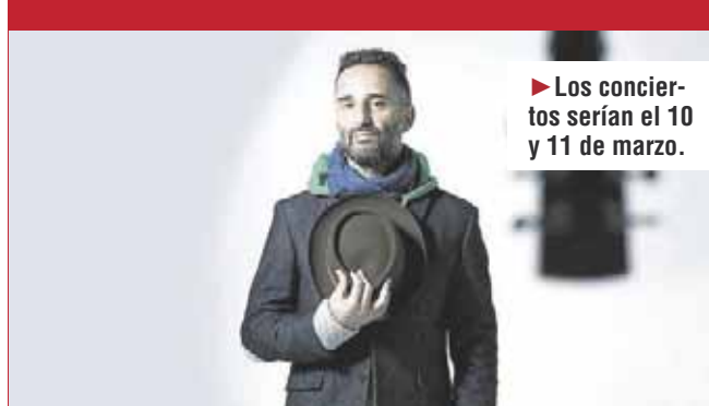
JORGE DREXLER DA CONCIERTO POR FACEBOOK

► Los conciertos serían el 10 y 11 de marzo.