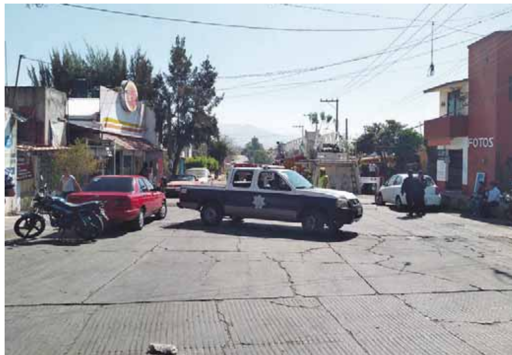
► Familiares aseguraron que tenía tres días desaparecido.