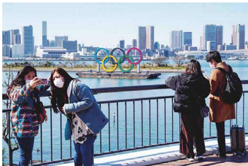
► El COI y el gobierno japonés acordaron el martes el aplazamiento de los Juegos de Tokio.