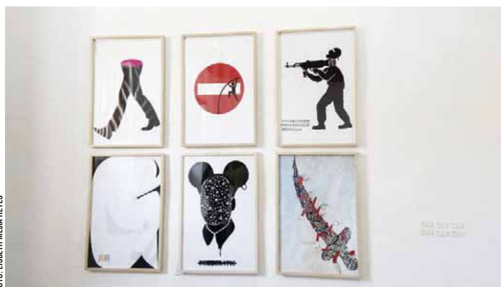
► El año pasado, la bienal tuvo como tema Carteles sin represión.

Para esta ocasión, la temática vuelve a enlazarse con una de las causas que promovió el artista y promotor cultural: La problemática actual del Agua. Sobre ello, el IAGO señaló en un comunicado que el tema fue propuesto por el autor a principios de 2019. Antes, aparte de Carteles por Ayotzinapa, las temáticas fueron sobre la