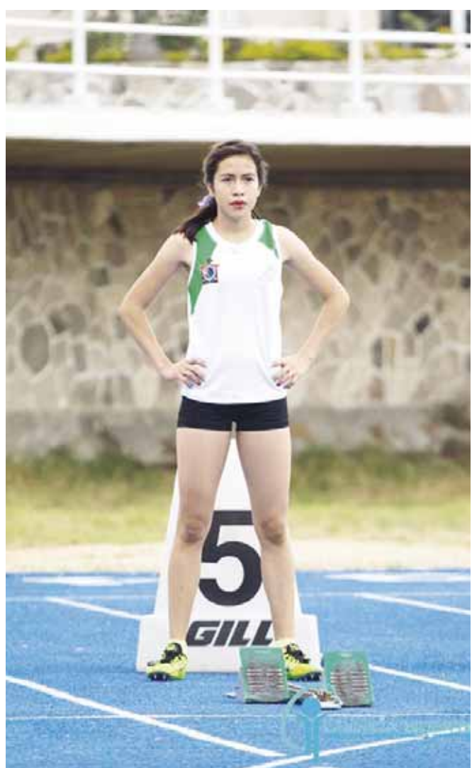
► La campeona nacional busca de nueva cuenta representar a México en justas internacionales.