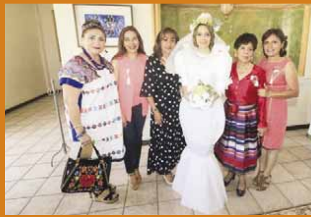
► Las presentes fueron parte de divertidas actividades en honor a la festejada.