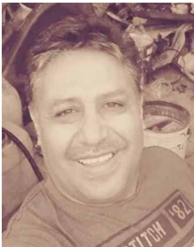
► El hombre perdió la vida tras recibir una descarga eléctrica.

Ante tales hechos se levantó el cuerpo y se ordenó su traslado al anfiteatro Luis Mendoza Canseco para