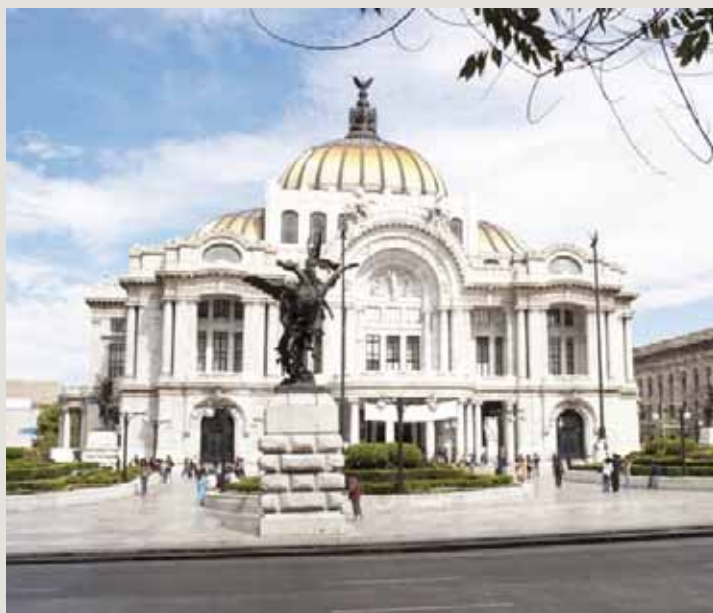
► Habrá recorridos virtuales por museos como el Palacio de Bellas Artes.

Presentada este miércoles por el ente cuya titular es Alejandra Frausto Guerrero, la iniciativa "Contigo en la distancia" abarca una "selección de material cultural, que incluye archivos sonoros, entrevistas, galerías fotográ-