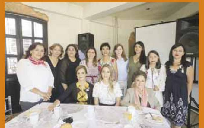
► Amigas y familiares desearon éxito a la festejada.