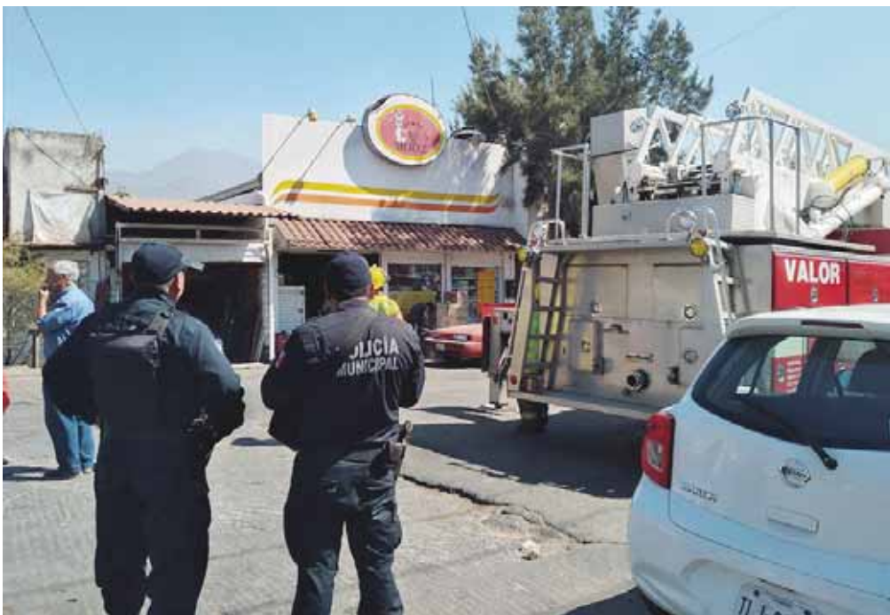
► Policías acudieron al llamado.