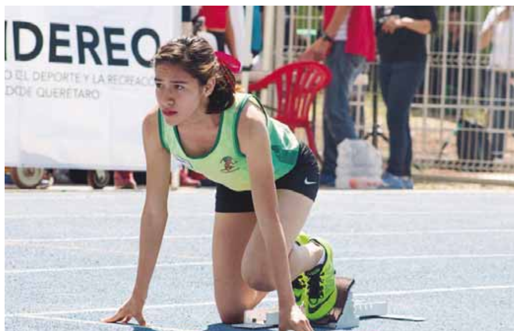
► La oaxaqueña tendrá que esperar para competir en el Mundial de Atletismo sub-20.

Cabe mencionar, la tetra campeona nacional estaría buscando dar las marcas para la justa mundial-