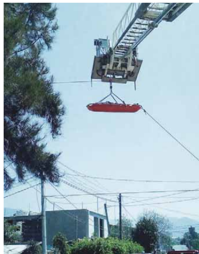
► Su cuerpo fue rescatado y trasladado al descanso municipal.

su necropsia de ley. El cuerpo del maestro mecánico fue identificado por su esposa quien dijo des-