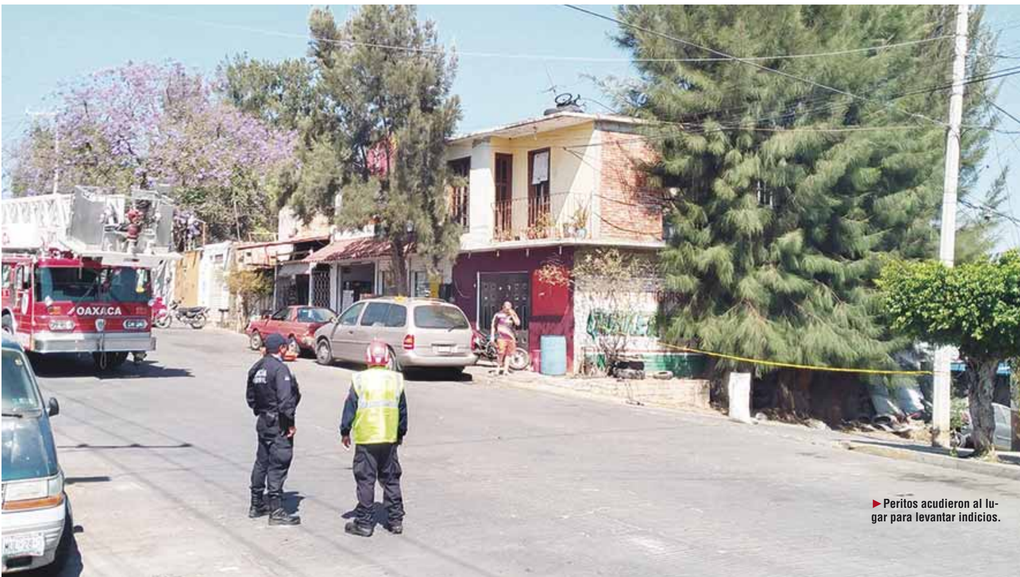
► Peritos acudieron al lugar para levantar indicios.

policiaca@imparcialenlinea.com / Teléfono 501 83 00 Ext. 3176