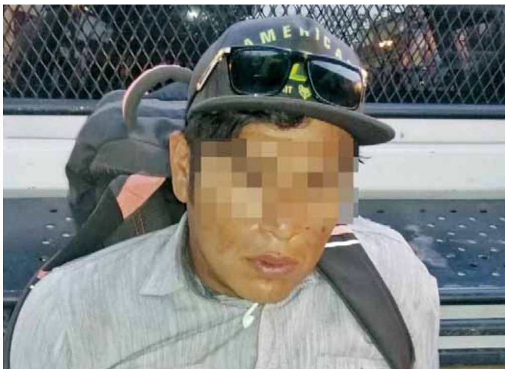
► El presunto ladrón fue detenido por las autoridades.