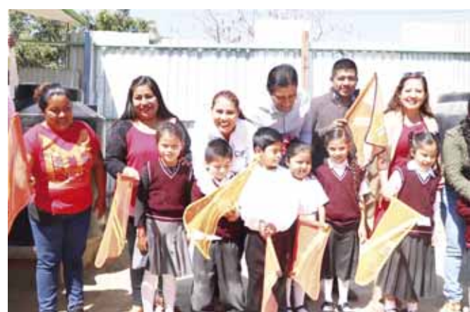
► Dan banderazo para la construcción de una barda perimetral.

El mandatario municipal expresó que esta construcción es fundamental, ya que contempla trabajos con altos estándares de calidad