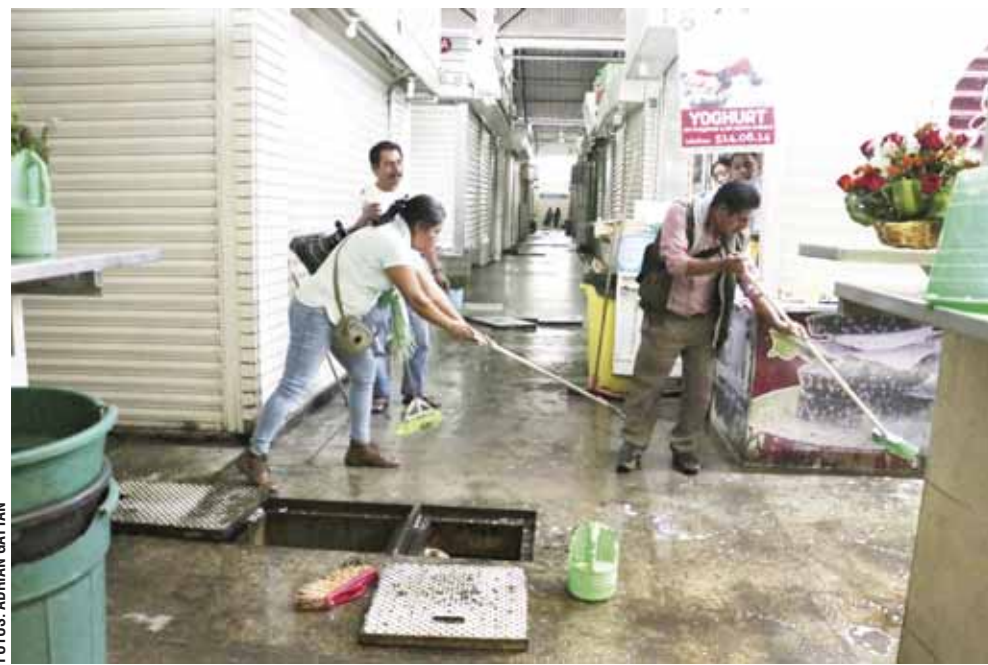
► Esta semana, los locatarios se organizaron para realizar limpieza general de los mercados.

mayor esfuerzo para que en estos espacios los ciudadanos reciban servicios de calidad, para lo cual también se lleva a cabo capacitación a comerciantes y ayudan a conocer estos sitios como parte de la cultura oaxaqueña.