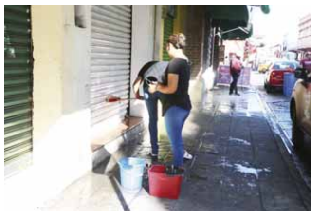
► El objetivo es ofrecer un servicio de calidad a los visitantes.

Sobre todo, el brindar un servicio de calidad que comprende trato afable a consumidores, limpieza y embellecimiento de los lugares