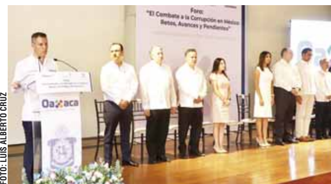
El gobernador Alejandro Murat Hinojosa durante su participación en el foro “El combate a la corrupción en México, Retos, Avances y Pendientes”.

“El combate a la corrupción no se trata de cumplir con la agenda de un gobierno, sino de cumplir con estándares internacionales, que si no se consiguen tiene un efecto negativo en contra del Gobierno”, dijo el