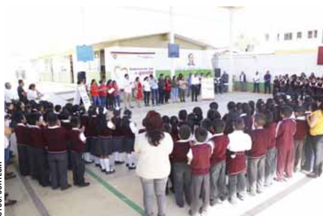
► Se entregaron libros para la biblioteca.

para garantizar la seguridad e integridad de las y los niños que a diario reciben su formación académica en dicha institución.