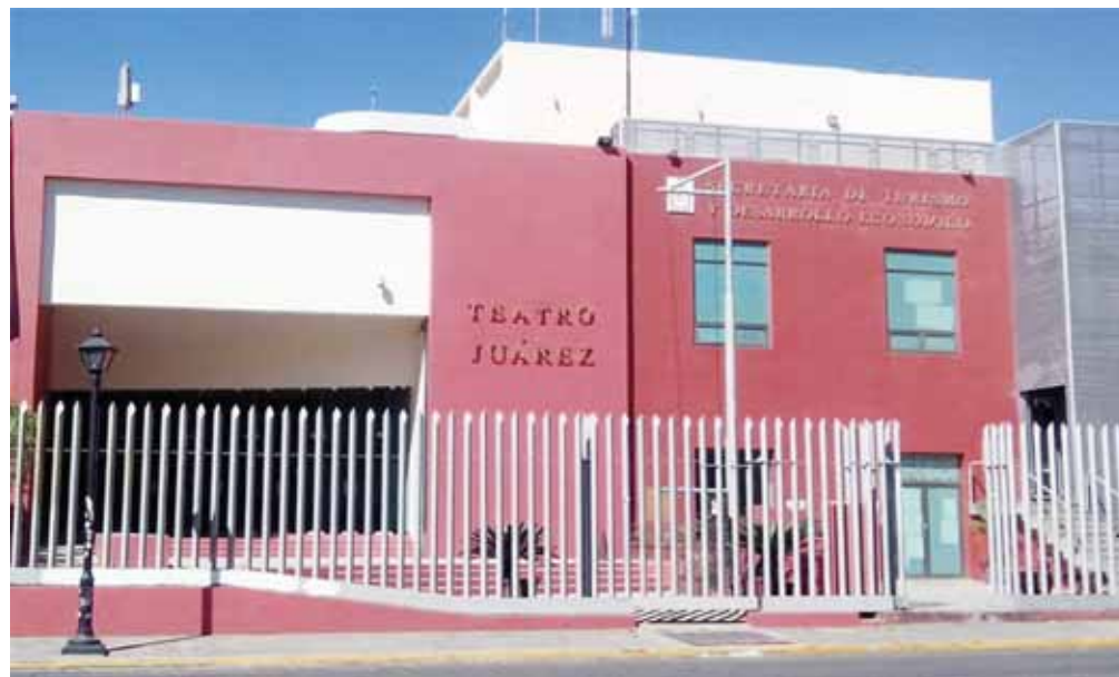
► Se estrena este sábado 7 de marzo, a las 19:30 horas en el Teatro Juárez.