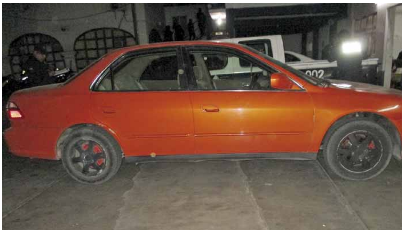
► Fue acusado por robo y daños.

Los hechos ocurrieron en el fraccionamiento de Trinidad de las Huertas donde el propietario de la unidad estacionó el auto durante la noche del jueves fuera de su domicilio. Al despertar, el hombre se percató de que su vehículo se encontraba sobre una pila de ladrillos sin