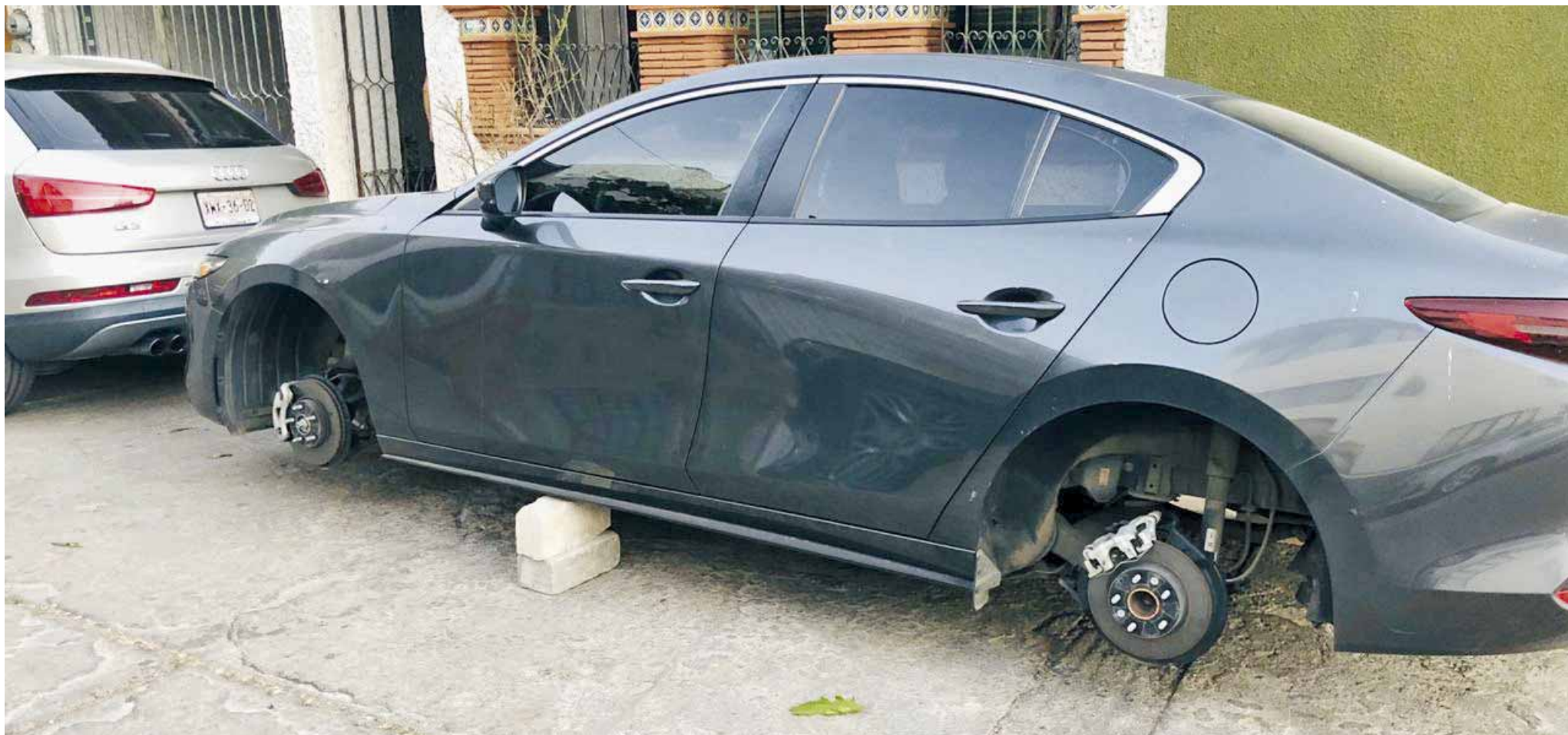
► Otro robo se suscitó en Trinidad de las Huertas.

policiaca@imparcialenlinea.com / Teléfono 501 83 00 Ext. 3176