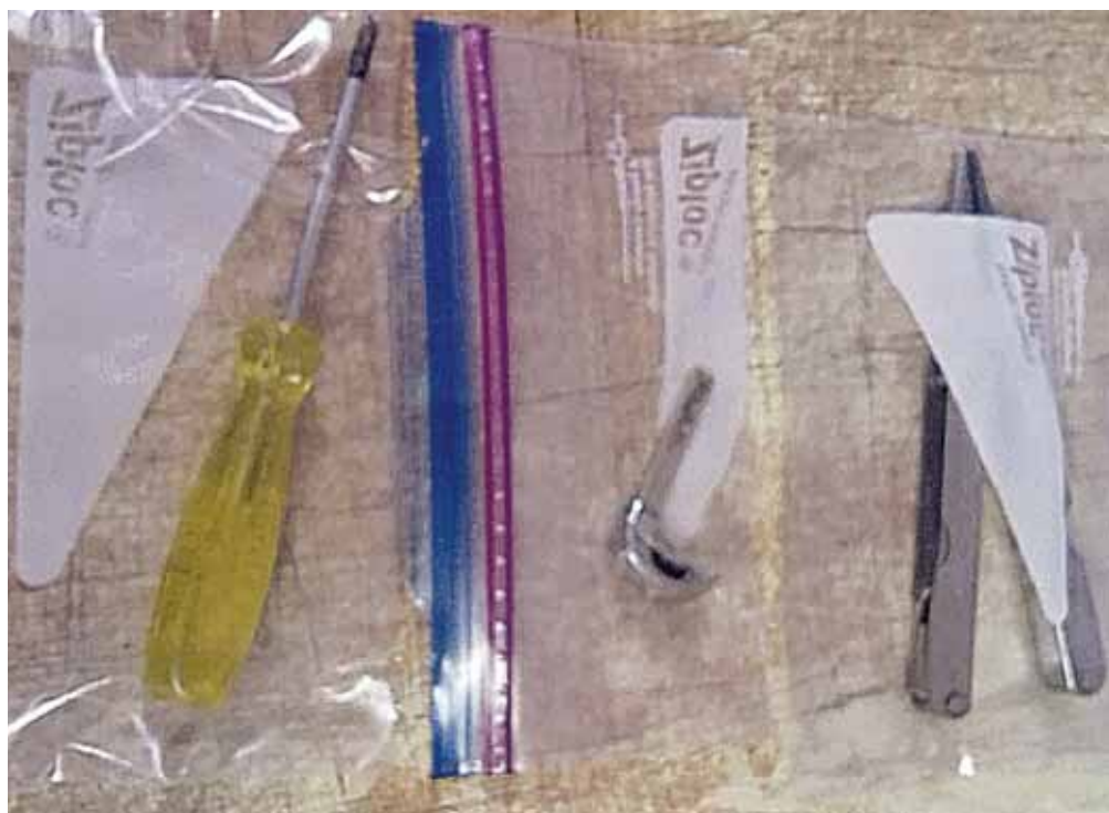
► Le fueron hallados objetos punzocortantes.