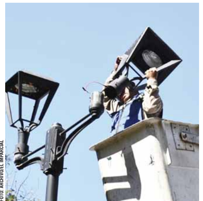
► Hasta el momento se han cambiado 11 mil 129 luminarias.

adecuados y dignos. Con los trabajos de fumigación, los mercados estarán listos para recibir al turismo nacional y extranjero que inundarán sus pasillos durante las festividades de Semana Santa", puntualizó.