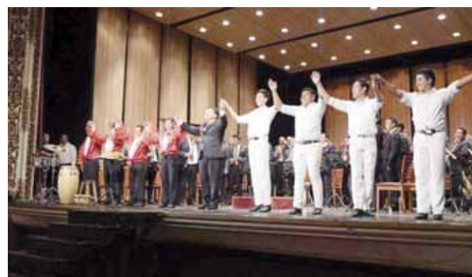
► Interpretaron el mambo de Pérez Prado.