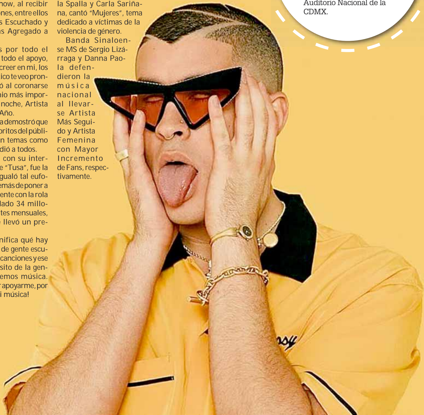
► Bad Bunny se erigió como el principal triunfador del show, al recibir tres galardones.